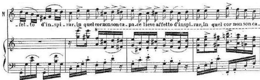
Primjer br. 1 / Ljubavni napitak / arija iz prvog čina: Quanto è bella, quanto è cara!

Nemorino je očaran Adininom ljepotom i inteligencijom, ali osjeća da je nije dostojan i da nije u stanju potaknuti nikakvu naklonost u njezinu srcu. Opisuje sebe kao nezalicu, nesposobnog da na pravi način izrazi svoje osjećaje, te čezne za načinom kako da ju pridobije. U frazi : " Ma in quel cor non son capace lieve affetto d'inspirar " ("al' u takvom srcu nisam sposoban nadahnuti ili probuditi ljubav"), na početku prvo pjeva u čistom C-duru, da bi kraj fraze otišao u e-mol koji odaje nemoć te nastavlja nabrajati Adinine sposobnosti, a sebe smatrajući nesposobnjakovićem. U cijeloj ariji je prisutan deskriptivni moment koji uz bel canto frazu zahtijeva i vrlo jasan izgovor. Na kraju, u repetitiji spomenutog teksta (koji je bio česta pojava romantičke opera te se kasnije izbjegava) prije kadence, Donizetti nam prvo glazbenim proširenjem te naglascima i alteracijama na slici dočarava i pod nos baca očitost njegove nesposobnosti, koju Nemorino gotovo razmaženo i djetinje ponavlja: