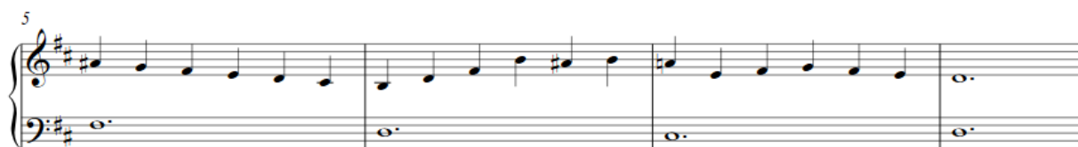
Slika 4: Primjer 13, homofoni dvoglasni diktat