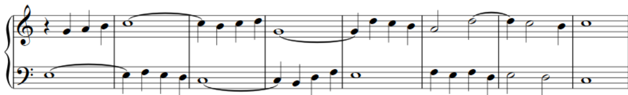
Slika 3: Primjer 6, polifoni dvoglasni diktat za početnike