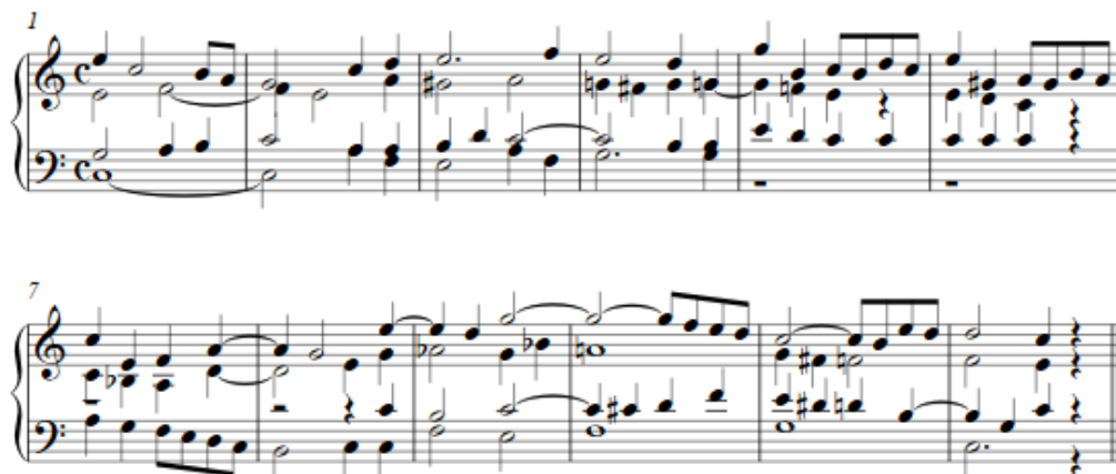
Slika 6: Primjer 58, Dvoglasni diktat, zapisivanje vanjskih glasova iz četveroglasnog sloga