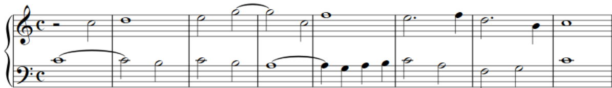
Slika 2: Primjer 2, dvoglasni diktat za početnike