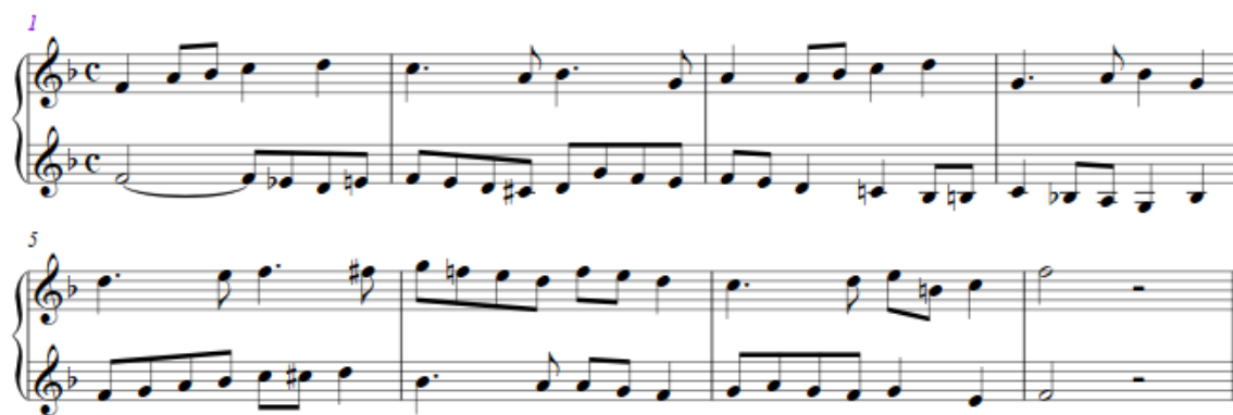
Slika 7: Primjer 150 (reduciran i izmijenjen), dvoglasni polifoni diktat