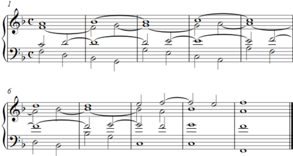
Slika 9: Primjer 107