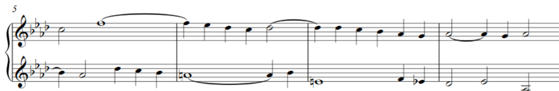
Slika 5: Primjer 33 (reducirana verzija), polifoni dvoglasni diktat s alteracijama