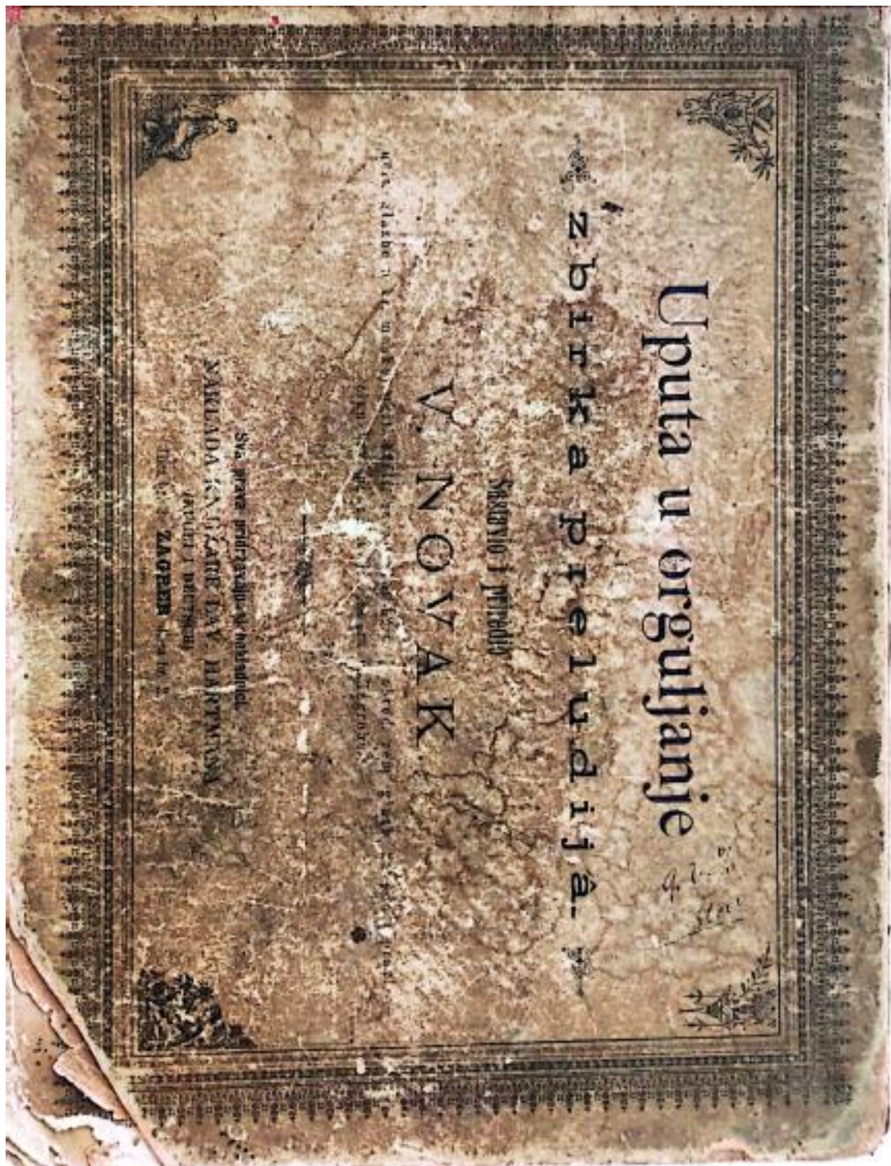
Prilog 19: Naslovna strana udžbenika Uputa u orguljanje