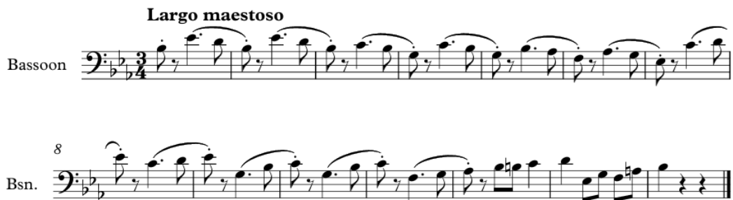
Slika 3: Tema Višegrada

Tema Vltave , iznesena u prvim violinama, pogodna je kao meloritamski primjer za pjevanje u trećem razredu osnovne glazbene škole, pri učenju šestosminske mjere. Tonalitet je učenicima poznat otprije jer se e-mol obrađuje u drugom razredu osnovne glazbene škole (MZOŠ i HDGPP, 2006, 6 – 9), a melodija se cijelo vrijeme kreće postepeno. Iz tog razloga s intonacijom ne bi trebalo biti problema pa se učenici mogu usredotočiti na novu mjeru. Također, tema se može iskoristiti i za melodijsko-ritamski diktat, također u trećem razredu osnovne glazbene škole (slika 4). Na nastavnom satu gdje bi se koristio ovaj primjer, mogli bismo započeti ponavljanjem e-mola, zatim bismo fraze iz navedenog primjera mogli uvježbati radom na modulatoru. U prvoj i trećoj fazi modulatora, poželjno je pjevati fraze u šestosminskoj mjeri u kojoj je i sam primjer. Nakon obavljene pripreme za meloritamski diktat, napisali bismo isti te bismo ga za kraj otpjevali. Ukoliko ostane vremena, nastavili bismo s pjevanjem meloritamskih primjera u istoj mjeri i/ili tonalitetu.