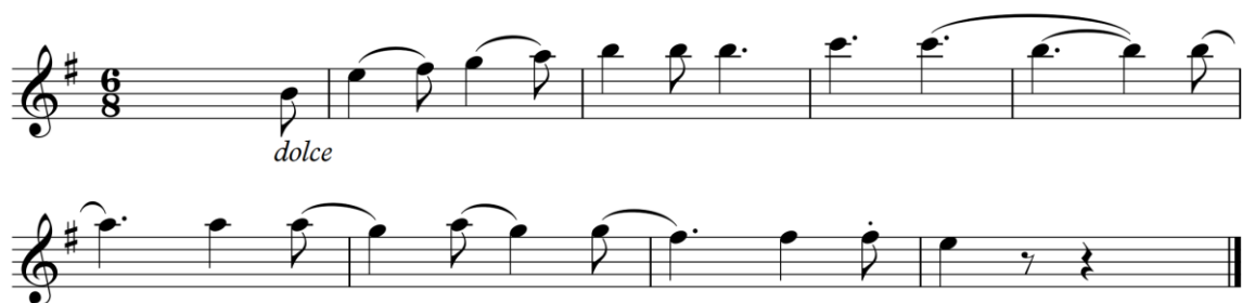
Slika 4: Tema Vltave

Tema Vltave , iznesena u prvim violinama, pogodna je kao meloritamski primjer za pjevanje u trećem razredu osnovne glazbene škole, pri učenju šestosminske mjere. Tonalitet je učenicima poznat otprije jer se e-mol obrađuje u drugom razredu osnovne glazbene škole (MZOŠ i HDGPP, 2006, 6 – 9), a melodija se cijelo vrijeme kreće postepeno. Iz tog razloga s intonacijom ne bi trebalo biti problema pa se učenici mogu usredotočiti na novu mjeru. Također, tema se može iskoristiti i za melodijsko-ritamski diktat, također u trećem razredu osnovne glazbene škole (slika 4). Na nastavnom satu gdje bi se koristio ovaj primjer, mogli bismo započeti ponavljanjem e-mola, zatim bismo fraze iz navedenog primjera mogli uvježbati radom na modulatoru. U prvoj i trećoj fazi modulatora, poželjno je pjevati fraze u šestosminskoj mjeri u kojoj je i sam primjer. Nakon obavljene pripreme za meloritamski diktat, napisali bismo isti te bismo ga za kraj otpjevali. Ukoliko ostane vremena, nastavili bismo s pjevanjem meloritamskih primjera u istoj mjeri i/ili tonalitetu.