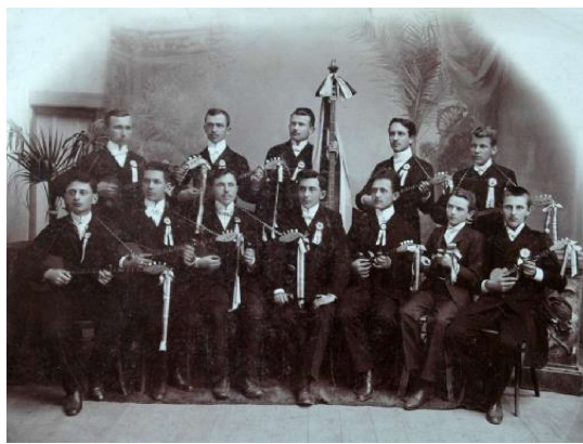
Slika 3: Tamburaški zbor „Osvit”