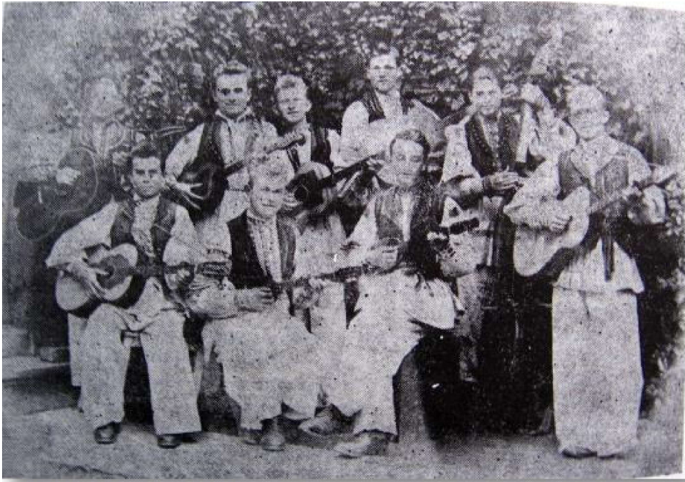
Slika 4: Omladinsko kulturno-umjetničko društvo „Klas”