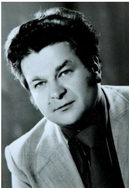
Slika 8: Vladimir Mundar

Zahvaljujući Vladimiru Mundaru (1934.-1990.) koji će svojim dolaskom u Požegu 1959. godine značajno pridonijeti razvoju glazbenog života u Požegi, iste godine počinje tečajna nastava klavira, harmonike i glazbene teorije. Tečaj je prethodio osnivanju Muzičke škole pri Narodnom Sveučilištu 1962. godine. Osam godina kasnije, točnije 1970. godine, škola se osamostaljuje te posjeduje samoupravnu ustanovu zahvaljujući osnivanju redovne Osnovne muzičke škole koja se 1976. godine preimenovala u Osnovnu muzičku školu Krešimira Baranovića. Dolaskom Veljka Valentina Škorvage u Požegu sredinom osamdesetih godina prošloga stoljeća glazbeni život u gradu počeo je iz godine u godinu biti sve bogatiji i sadržajniji. Njegovom inicijativom 1999. godine otvorena je srednja glazbena škola i promijenjen naziv u Glazbena škola Požega, uvedena je tambura u nastavu kao glavni predmet i obnovljen je festival tamburaške glazbe „Zlatne žice Slavonije”.