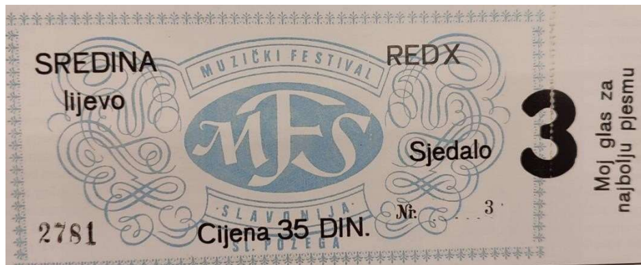
Slika 16: Ulaznica prvog „Muzičkog festivala Slavonije” 1969. godine

sadilo se cvijeće u parkovima, popravljala se javna rasvjeta i dječja igrališta. Sve navedeno, trebalo je dati novu sliku gradu. Na festivalu su sudjelovali umjetnici iz kulture od kojih je najviše interesa pobudilo gostovanje kazališta „Komedijska”. Zanimljivo je da je postojao problem s prenoćištem pjevača i gostiju te Požeški list zbog toga objavljuje oglas i molbu građanima koji su u mogućnosti da na dane 12., 13. i 14. lipnja 1969. godine prime na prenoćište goste koji će doći na festival, a prema posebnim tarifama za takvu vrstu ugostiteljskih usluga predviđena je cijena po ležaju od 5 novih dinara. Pripreme za ovaj prvi festival bile su vrlo detaljne, cjelovite i najduže su trajale od svih ostalih godina organiziranja festivala. Tiskana je knjižica s notnim zapisima i riječima pojedinih pjesama te su izdane i gramofonske ploče koje su bile u prodaji.