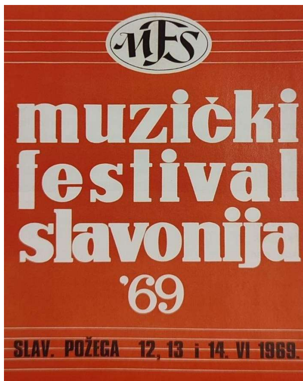
Slika 14: Plakat „Muzičkog festivala Slavonije” 1969. godine

Kako je zapravo došlo do stvaranja ideje možemo vidjeti prema uvodu Festivalskog vodiča iz 1969. godine napisanog od strane direktora festivala Branka Hribara: „Tridesetak Slavonaca, javnih i društvenih radnika, sastalo se ovdje u Požegi prije 17 mjeseci da bi potvrdilo osnivanje i djelovanje prve glazbene manifestacije festivalskog opsega u Slavoniji. Danas smo sudionici oživotvorenja festivalske ideje, prisustvujemo festivalskim koncertima i u mogućnosti smo procijeniti glazbeni i kulturno-zabavni domet ostvarenog. „Festival Slavonija“ 1969. pokušava i Slavoncima i svim ostalim našim sugrađanima pokazati u pjesmi i napjevu otvorenost i širokogrudnost slavonske duše, slavonski smisao za doskočicu i šalu, slavonski trajni životni optimizam – taj danas toliko neophodan stimulatív da se ustraje u sudaru svih nas s naglim svijetom nove civilizacije.”