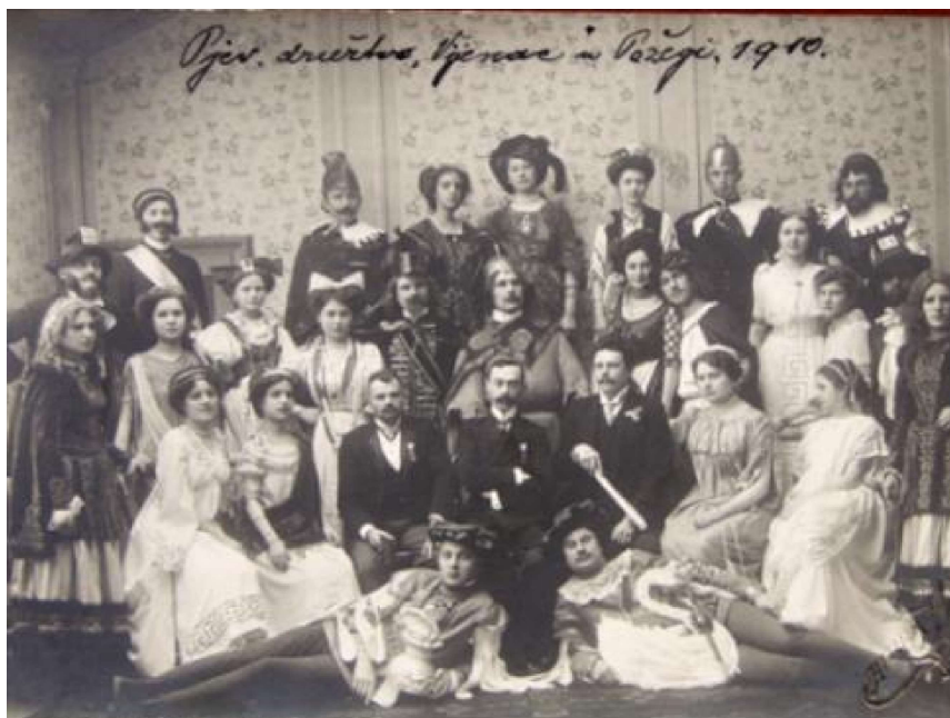
Slika 1: Pjevačko društvo „Vijenac” u Požegi 1910. godine