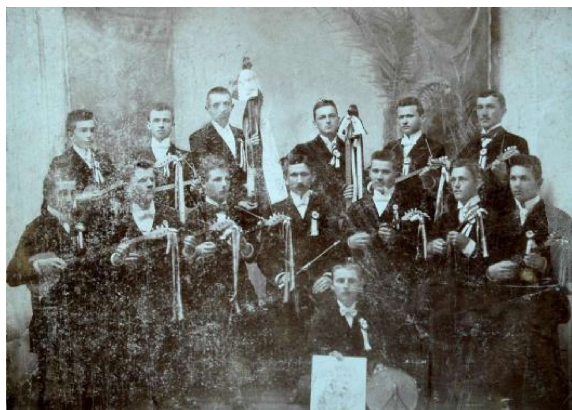
Slika 2: Tamburaško društvo „Bisernica”

tamburaške glazbe pa su oba zbora često i zajednički nastupala na koncertima uz odobravanje požeškog općinstva (Kempf, 1992: 52).