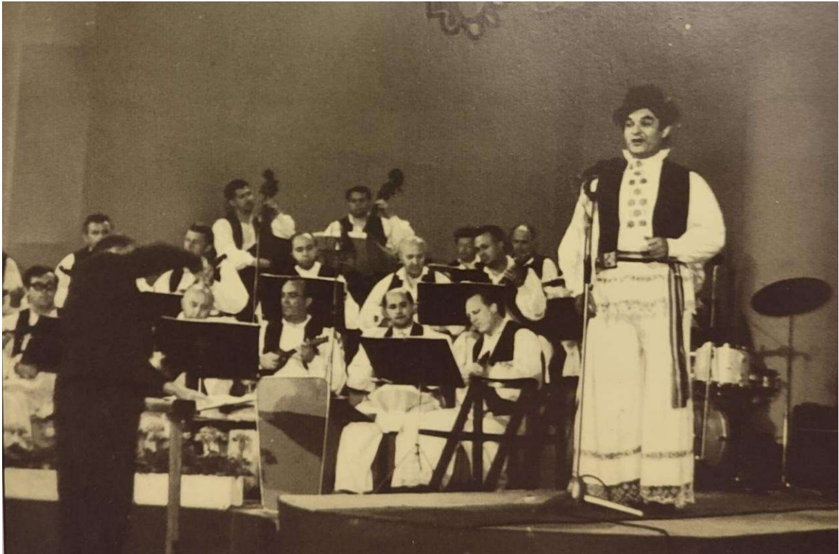
Slika 18: Ivo Robić na „Muzičkom festivalu Slavonije”, 1969. godine