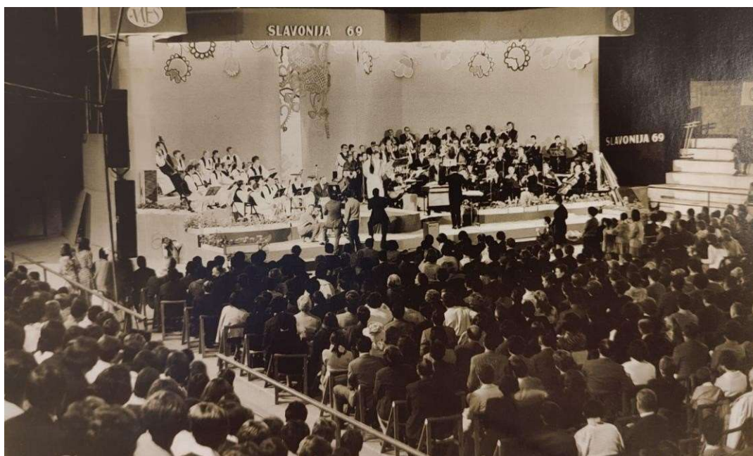
Slika 15: „Muzički festival Slavonije” 1969. godine

U monografiji se navodi kako je najraširenija bila narodna glazba, koju bi seljaci i građani slušali, igrajući kolo uz svirku tambure samice i gajdi – duda. Tako je 1969. godine održan požeški festival pod nazivom „Muzički festival Slavonije”, koji se u današnje vrijeme obilježava pod drugim nazivom, pola stoljeća od prve organizacije. Upravo taj prvi festival otvorio je zbor Hrvatskog pjevačkog društva „Vijenac”. „Muzički festival Slavonije” okupljao je na zabavnoj i koncertnoj večeri istaknute vokalne soliste popularne glazbe i operne umjetnike koji su izvodili nove pjesme uz pratnju tamburaškog i revijskog orkestra. Izvodili su koncertne pjesme i zabavne melodije inspirirane tekstem i napjevom slavonske folklorne i umjetničke glazbe, opisano je u monografiji.