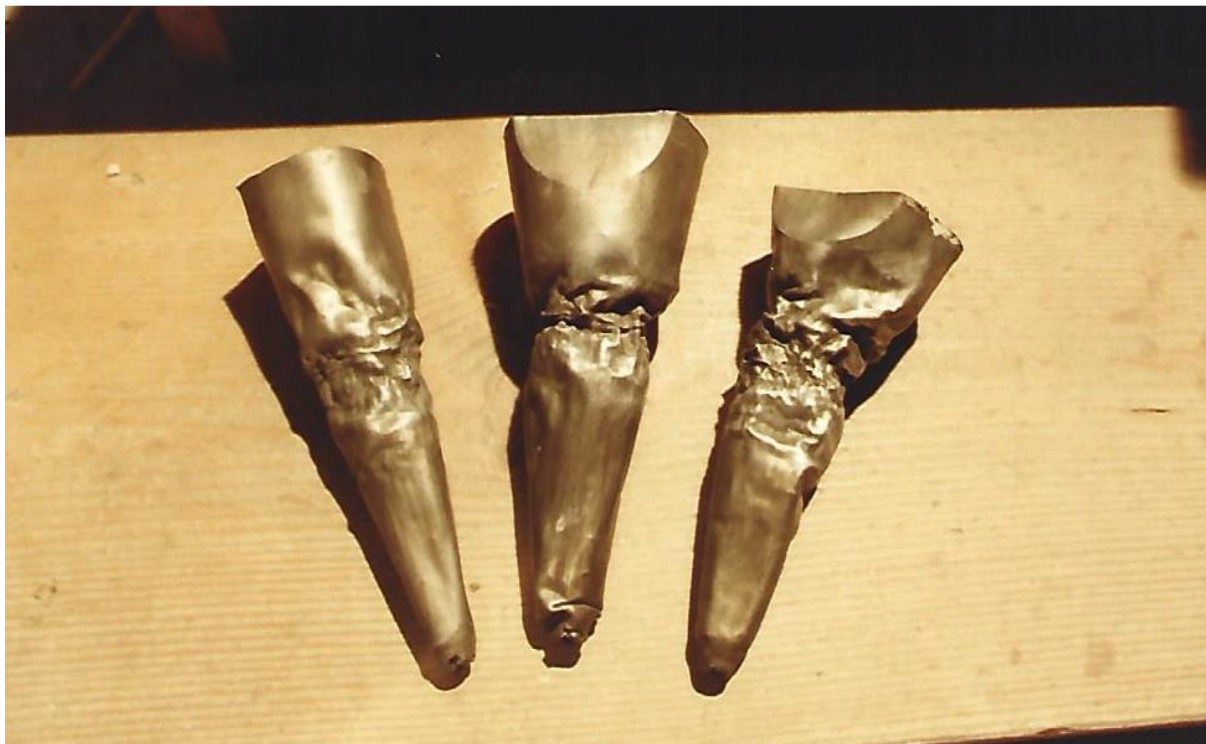
Slika 16. Devastirane metalne svirale