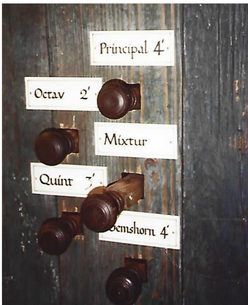
Slika 8. Originalna dispozicija orgulja