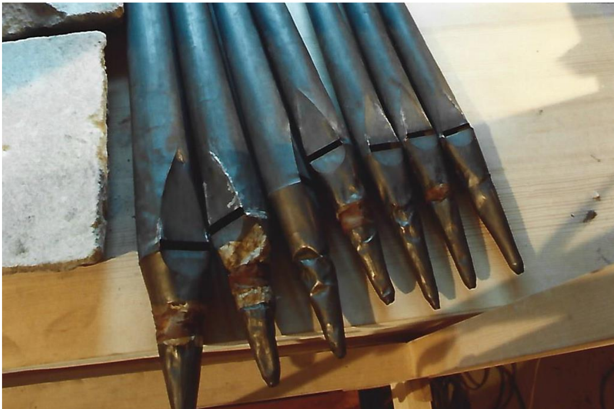
Slika 14. Oštećene svirale registra Gemshorn 4'

Metalne svirale bile su djelomično jako oštećene zbog nestručnih intervencija. Mnoge su nedostajale ili su bile postavljene na krivom mjestu, a neke su bile prekratko odrezane. Usnice i noge mnogih svirala bile su uništene. Da bi se postojeći fonički materijal što bolje sačuvao, zahvati na sviralama radili su se samo tamo gdje je to bilo neophodno. Duboke svirale u registru Gemshorn 4' dobile su novo postolje, a jedna svirala iz prospekta i novi trup. Na prekratke svirale stavljeni su prsteni za ugađanje. Za prvi red registra Mixtur 3f izrađene su nove svirale.