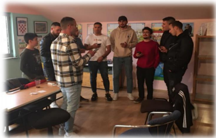
Slika 9. Zabilježen trenutak s radionice: muška sekcija

(kao što je ovdje slučaj), mogu direktno ili indirektno potjecati iz lokaliteta čije napjeve smo zajednički slušali i učili.