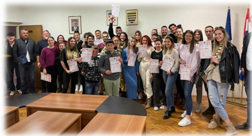
Slika 11. Zajednička fotografija po završetku radionice tradicijskog pjevanja u Dicmu

Napjevi usvajani na radionici svojim porijeklom nisu bili isključivo s područja Cetinske krajine, nego i s područja Ravnih Kotara, Zagore i Imotske krajine te iz Trebižata (mjesto u sastavu grada Čapljine, Zapadna Hercegovina). Na taj način (obuhvatom većeg broja lokaliteta) postignuta je dinamičnost pristupa kao posljedica raznolikosti stilova odabranih napjeva.