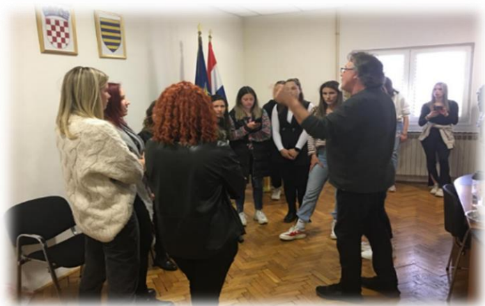
Slika 10. Zabilježen trenutak s radionice: rad sa ženskom sekcijom u manjim grupama

Krajnji ishodi proizašli iz ovog intenzivnog dvodnevnog rada očitivali su se kroz više aspekata. Naime, izazov je nekoga po prvi puta upoznati s vokalnom tradicijskom glazbom bilo kojega područja, radilo se o osobi koja je glazbeno potkovana ili nepotkovana. Mogu reći da je taj izazov obostran podjednako za onoga tko prenosi znanja i za onoga koji ta znanja usvaja. Neki od polaznika imali su strah od pjevanja pred drugim polaznicima pa im je ova radionica pomogla u razvitku vlastitog samopouzdanja na pjevačkom planu. Neki od njih naučili su osloboditi i kontrolirati svoj glas, a neki su unaprjeđivali svoja dosadašnja pjevačka znanja i vještine. No povrh