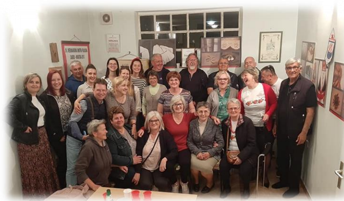
Slika 7. Zajednička fotografija s članovima KUD-ova "Hrastovička Gora" i "Čuntićanka" zabilježena po završetku susreta 5. svibnja 2022.