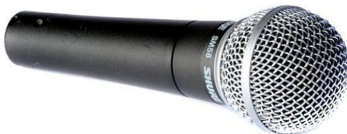
Slika 2: Dinamički mikrofon s titrajnom zavojnicom

Dinamički mikrofon vrsta je pretvarača 36 koji zvučne valove, koji uzrokuju mehaničko titranje zavojnice, pretvara u električni signal/napon pomoću elektromagnetske indukcije. 37 Postoje dvije vrste dinamičkih mikrofona, mikrofoni s titrajnom zavojnicom ili mikrofoni s vrpcom 38 .