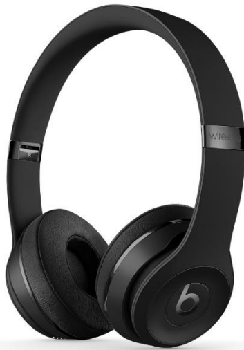
Slika 7: On-ear slušalice

ušne čašice od over-ear slušalica, a često su dizajnirane na način da se mogu sklopiti radi lakšeg transporta i spremiti u zaštitnim futrolama s kojim dolaze. Iako možda ne nude toliku izolaciju od buke kao over-ear slušalice, ostaju hladnije zbog bolje cirkulacije zraka. U usporedbi sa in-ear slušalicama, znatno su udobnije, omogućujući dugotrajno slušanje bez nelagode. On-ear slušalice također se mogu pohvaliti većom zvučnom jedinicom (driverom), omogućavajući reprodukciju šireg raspona frekvencija, a također i širu zvučnu sliku, što ih u usporedbi s in-ear slušalicama po tom pitanju čini preferiranim izborom unutar sličnog cjenovnog razreda.