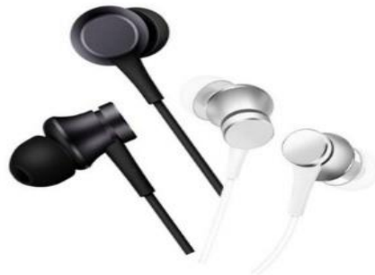
Slika 6: In-ear slušalice

In-ear slušalice, također poznate kao earbuds, danas su u širokoj upotrebi zbog svoje kompaktne veličine i mogućnosti prenosivosti. Stavljaju se unutar ušnog kanala, omogućavajući dobro pristajanje većini korisnika, a u nekim dizajnim in-ear slušalica možemo vidjeti i trake koje se omotavaju oko ušiju radi stabilnosti tokom neke konkretnije aktivnosti. Što se tiče udobnosti in-ear slušalica, iskustva su podijeljena, nekima će biti udobne, a nekima čak i iritantne, posebice nakon slušanja glazbe satima bez prekida. In-ear slušalice imaju manje zvučne jedinice (drive) što ograničava njihovu sposobnost da proizvedu isti frekvencijski raspon, a samim time i raspon zvuka kao on-ear ili over-ear slušalice. Glazbu isporučuju izravno u bubnjić što rezultira manje prostranim i ne baš otvorenim zvukom u usporedbi s drugim vrstama slušalica. Unatoč ovim ograničenjima, danas postoje kvalitetne in-ear slušalice te se njihova prenosivost ne može usporediti s drugim tipovima slušalica.