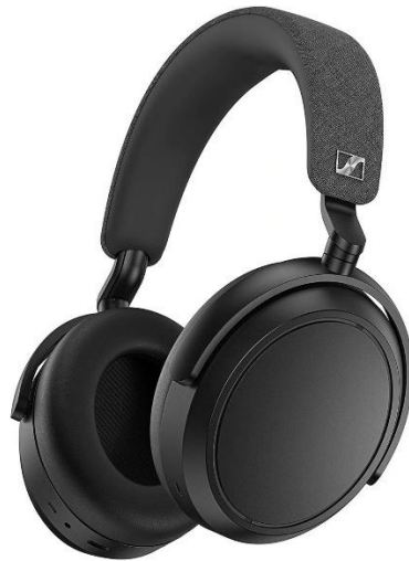
Slika 8: Over-ear slušalice

Audio entuzijasti preferiraju over-ear stil slušalica, koje se stavljaju preko uha, zbog vrhunske kvalitete zvuka. Smatraju se najprodavanijom i najudobnijom vrstom slušalica. Ova vrsta slušalica idealna je za uredsku ili kućnu upotrebu, ali iako se neki modeli mogu sklopiti i isporučuju s putnim torbicama, nisu lako prenosive zbog svoje masivnosti. Over-ear slušalice u potpunosti pokrivaju uši i tako osiguravaju udobnost tijekom dulje upotrebe. Neki vrhunski modeli mogu biti teški pa bi trebalo pripaziti kakvu traku i ušne jastučiće posjeduju. Ove slušalice su opremljene najvećim zvučnim jedinicama (driverima), nude širok raspon frekvencija, dajući glatke visoke tonove i duboke basove tako da je kvaliteta zvuka neupitna. Pri izboru over-ear slušalica, postoji mogućnost biranja između slušalica s otvorenim ili zatvorenim stražnjim dijelom. Zatvorene slušalice pružaju bolju izolaciju buke i sprječavaju da se glazba čuje van njih dok slušalice s otvorenim stražnjim dijelom nisu tako učinkovite u izolaciji buke, ali zato nude širu zvučnu sliku i prostranije iskustvo slušanja, poput kvalitetnih zvučnika.