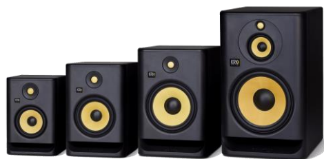
Slika 5: Dinamički zvučnici

https://www.krkmusic.com/ROKIT-Powered-G4-Studio-Monitors