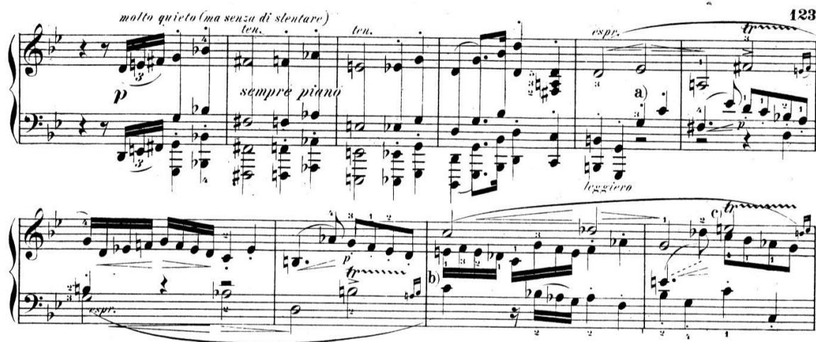
Slika 4. Fugalni dio