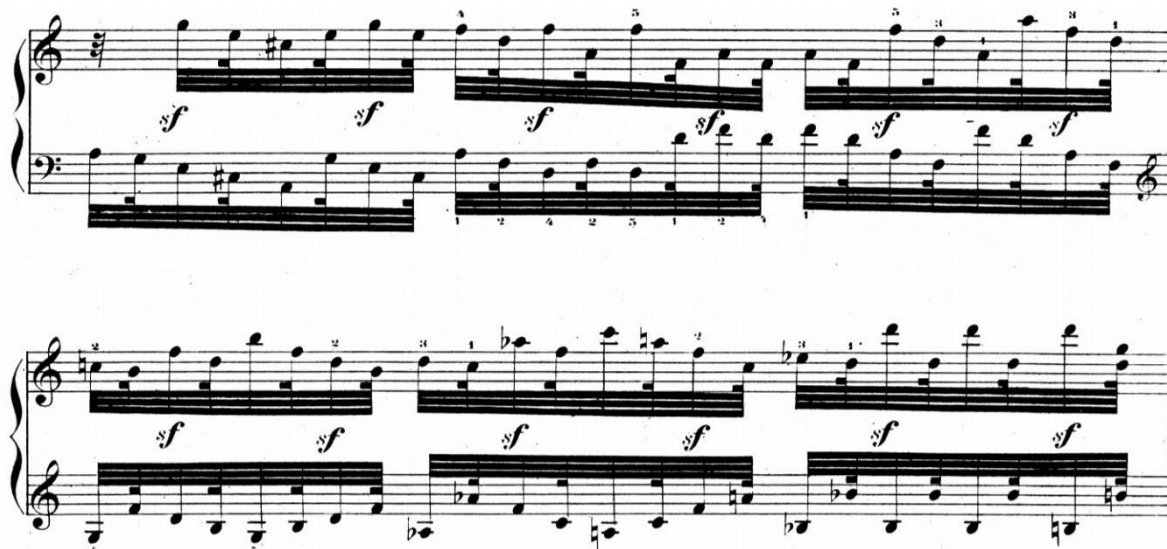
Slika 8. Primjer sf oznaka u trećoj varijaciji