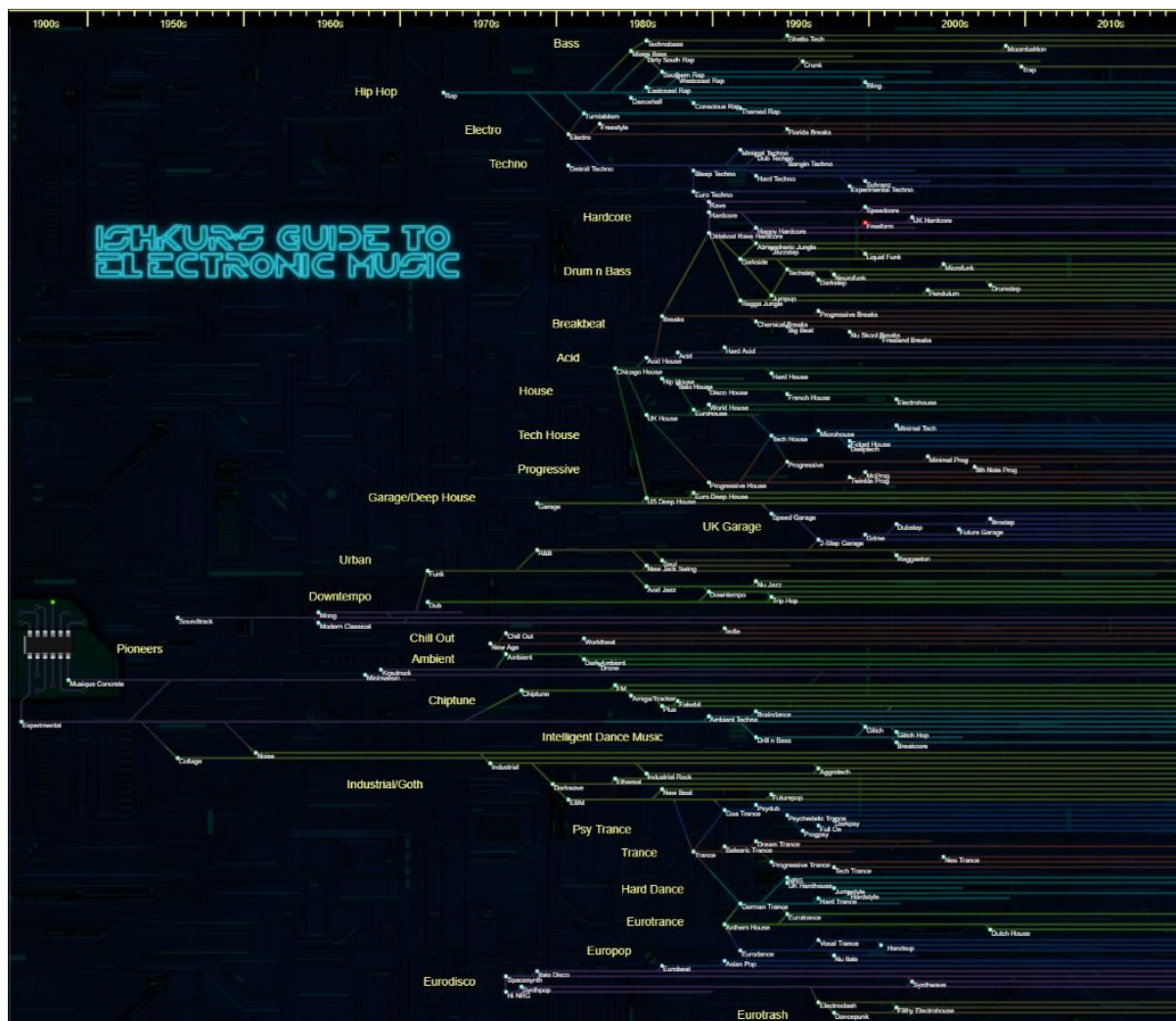
Slika 5. Ishkur's Guide to Electronic Music.

Acid house je podžanr EDM glazbe iz Chicaga koji je postao popularan u Velikoj Britaniji kasnih 80-ih godina prošlog stoljeća. Karakteriziraju ga brzi tempo i egzotični semplovi ptica i ženskog govora te ritam-mašina. Dobar primjer ovoga žanra je pjesma Pacific State skupine 808 State 11 (Demers, 2010). Unutar prve godine nastanka, ovaj je podžanr postao najveći fenomen britanske mladeži od pojave punka deset godina ranije. 12