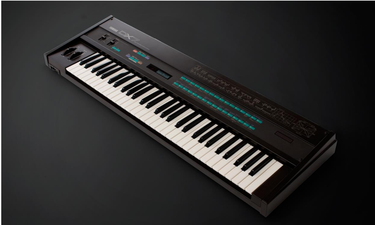
Slika 3. Yamaha DX7 digitalni sintesajzer. 4

Između 1980. i 1984. godine cijena ovih uređaja znatno je pala, stavljajući ih unutar dosega masovne tržišne prodaje. Istovremeno, operacije koje je izvodio sekvencer postale su dostupne u obliku programske opreme koja se mogla instalirati na osobna računala. Kao rezultat toga, do sredine 1980-ih prosječne osobe su u svojim kućama mogli imati glazbenu opremu napredniju od velikih elektroničkih studija koji su postojali samo deset godina ranije (Taruskin, 2010).