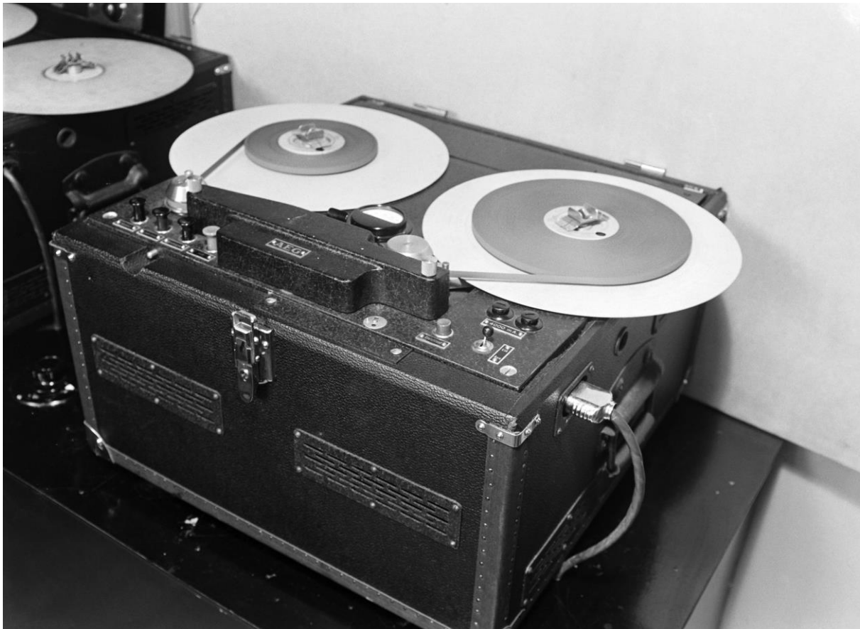
Slika 1. Fotografija ranog oblika magnetofona tvrtke AEG. 2

Studiji s magnetnim vrpcama iz 1966. godine još uvijek su predstavljali vodeću tehnologiju u elektroničkoj glazbi. Samo 18 godina nakon osnivanja prvog značajnog elektroničkog glazbenog studija u Parizu, postojalo je najmanje 560 institucionalnih i privatnih studija za vrpce diljem svijeta. Od njih je samo 40 posto bilo sponzorirano od strane institucija i korporacija, dok su ostali bili opremljeni i upravljani privatno kao rezultat sve veće dostupnosti snimača za trake, miksera, mikrofona, oscilatora i drugih osnovnih alata struke. Godina 1966. bila je ključna jer je označila točku u kojoj su najraniji analogni glazbeni sintesajzeri postajali poznati. Prvi sintesajzeri nisu bili dizajnirani kao izvođački instrumenti za izvođenje žive glazbe, već kao sofisticirane modularne alternative za stvaranje elektroničkih zvukova za studio s vrpcama. Unatoč brojnim uzastopnim valovima razvoja glazbene tehnologije, mnogi osnovni estetski koncepti i umjetnički izbori koje su prakticirali rani skladatelji s vrpcom ostaju u središtu elektroničke glazbe koja se i dalje proizvodi danas. Ova obilježja