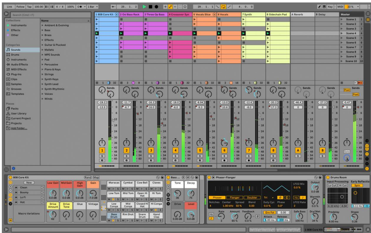
Slika 4. Prikaz modernog DAW-a (Ableton Live). 6

manipulacije zvuka, MIDI kontrole, sekvenciranje, baratanje audio pluginovima itd. (slika 4) (Manning, 2013).