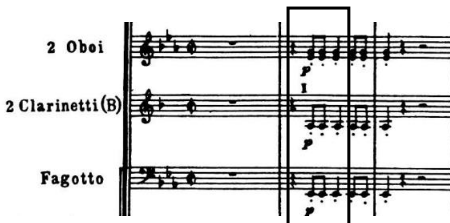
4.1.2. Drugi motiv koji iznosi orkestar