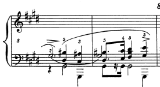
Slika 18. Preludij br. 10 u cis–molu, taktovi 3 - 4

Oznaka za ovaj preludij je allegro molto i leggiero , dakle brzo, živahno i lagano. Sastavljen je od brzih silaznih pasaža, nakon kojih dolazi smirenje u kratkom akordičkom dijelu ritma karakterističnog mazurki. Preludij je vrlo kratak, prava minijatura, i djeluje poput improvizacije pijanističkim figurama. Zanimljivo je da nema niti jedne dinamičke oznake. Iz tog možemo zaključiti da je interpretacija ostavljena umjetničkoj slobodi izvođača, ali, prema strukturi i uputi leggiero , rekla bih da je ovaj preludij potrebno odsvirati s lakoćom, živo i slobodno, ostavljajući dojam improvizacije.