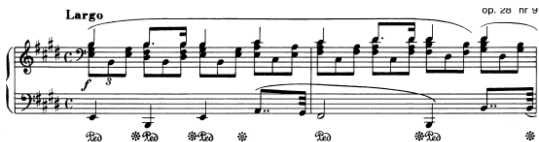
Slika 16. Preludij br. 9 u E–duru, taktovi 1 - 2

Kao kontrast prethodnome dolazi ovaj preludij poput koračnice, plemenitog, čvrstog i staloznog karaktera. Sastavljen je od melodije u gornjem glasu, podležućih akorada u triolama te snažne linije basa. Oznaka tempa je largo , široko; dakle tempo je sporiji, što izvođaču daje dovoljno vremena za stvaranje velikog i svečanog tona. Ritam je bitna stavka interpretacije ovog preludija, obzirom na različiti ritamski obrazac punktiranih tonova u sopranu i basu, te ga, iz tog razloga, treba izvesti vrlo precizno. Vrhunac prema kojemu sve ide je u osmome taktu, gdje Chopin piše dinamičku oznaku fortissimo , koju rijetko koristi, što znači da taj vrhunac doista treba donijeti s puno tona. Fortissimo piše i u posljednjem taktu, prije kojeg je oznaka ritenuto , koja implicira pripremu tog fortissima kao svečanog finala.