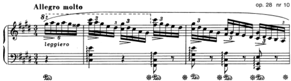
Slika 17. Preludij br. 10 u cis–molu, taktovi 1 – 2