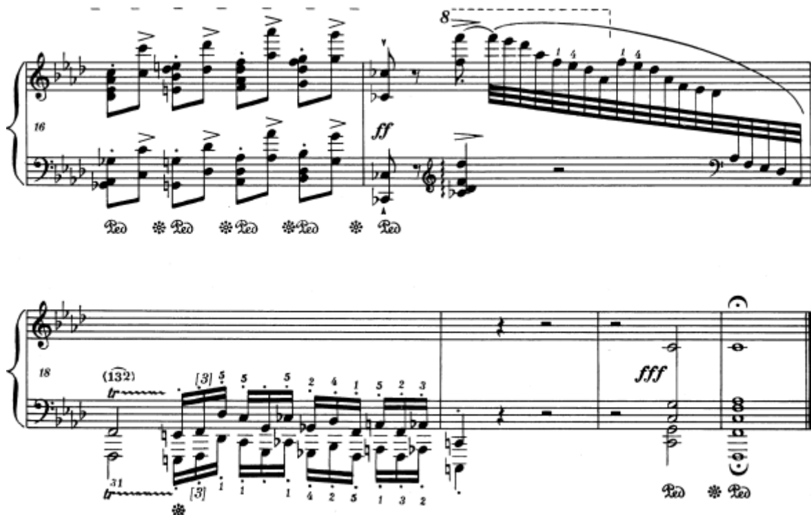
Slika 29. Preludij br. 18 u f–molu, taktovi 16 - 21