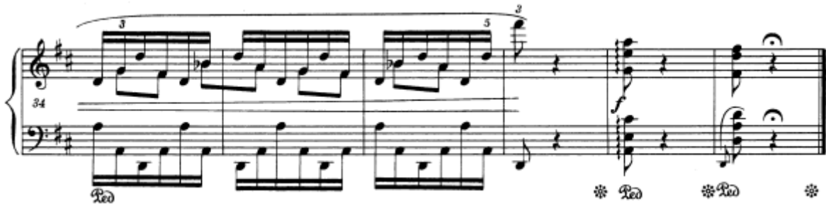
Slika 11. Preludij br. 5 u D–duru, taktovi 34 – 39

Ovaj je preludij strukturom sličan prvome. Kao što je vidljivo na slici 10, u prva četiri takta te, kasnije, u taktovima 17 – 20 te 33 – 36 melodija i oblikovanje nota tvore hemiolu, koju Chopin pedalom ističe, uparujući ga s osminkama koje su tonovi melodije. Te sinkopirane osminke, dakle, treba istaknuti kao glavnu melodiju iznad arpeggirane podloge lijeve ruke i ostatka tonova desne. Ostatak preludija prati troosminsku mjeru, s napomenom da su šesnaestinke nekad grupirane po tri, a nekad po dvije. Na samome kraju, u taktovima 34 – 37, nalazi se produženi pedal, koji obuhvaća sinkopirane osminke melodije te jednoličnu pratnju harmonijskih šesnaestinki, a svrha mu je kreiranje mutnije zvučne slike koja se „povećava“ i vodi do finalna dva forte akorda. Osim strukturom, na prvi preludij podsjeća i karakterom, koji je vedar, dostojanstven i poletan.