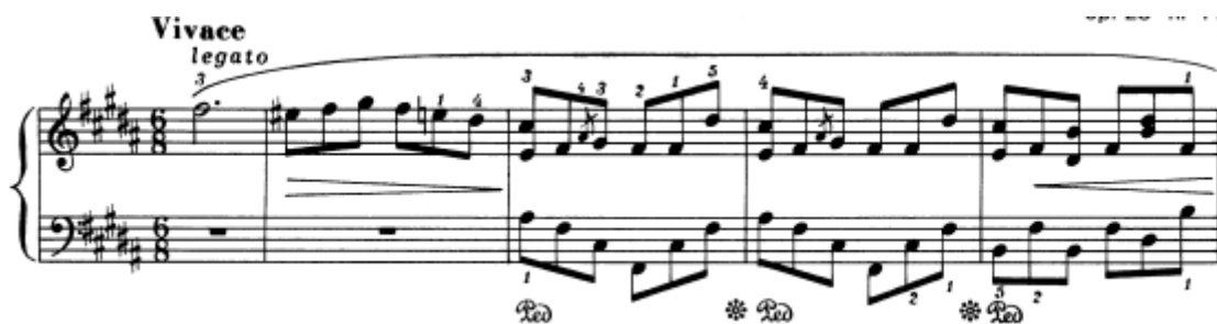
Slika 19. Preludij br. 11 u H–duru, taktovi 1 - 5

Jedanaesti po redu preludij jednostavne je strukture i gracioznog, živahnog, zbog oznake vivace , karaktera s umirujućom sveukupnom slikom. Cijeli preludij je u osnovnom tonalitetu te se kreće u osminkama, koje u desnoj ruci čine melodiju, a u lijevoj rastavljeno – akordičku harmonijsku podlogu. Na početku se nalazi uputa izvođaču legato – dakle, ovaj preludij treba svirati s aktivnim prstima, kako bi se mogao postići taj legato te ostvariti traženi smirujuć i mekan zvuk klavira. Od dinamičkih oznaka u notama se nalaze samo oznake crescenda i decrescenda , iz čega možemo zaključiti da u izvođenju ne treba biti velikih dinamičkih razlika, već samo nijansiranje unutar piana .