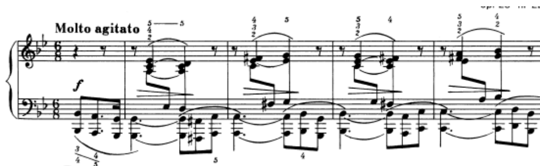
Slika 33. Preludij br. 22 u g–molu, taktovi 1 - 4

Ovo je preludij, oznake molto agitato te glasne dinamike oznaka forte i kasnije fortissimo , strastvenog i snažnog karaktera. Sastoji se od dijaloga oktava u lijevoj ruci i sinkopiranih akorada kao odgovora u desnoj. U izvođenju je bitno svirati oktave u lijevoj ruci precizno i snažno, a desnu ritmički naglašeno. Obzirom na oznaku molto agitato , dakle vrlo uzbuđeno, tempo može biti s tendencijom ubrzavanja kroz preludij. Od 30 – og takta postoji oznaka più animato , tu svakako tempo treba biti brži, sve do kraja. Ovo je jedan od preludija koji pokazuje koliko je Chopinov zapis detaljan i precizan te u kojoj mjeri može i mora utjecati na izvođenje; pravilnim čitanjem uputa u notnom zapisu lako je razumjeti željenu ideju za krajnji rezultat.