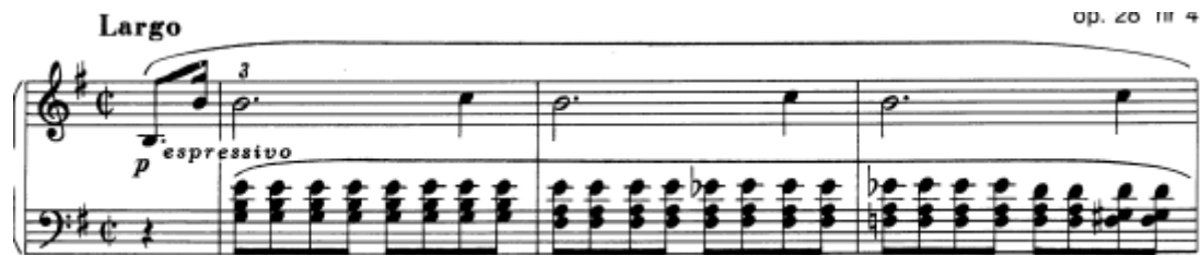
Slika 9. Preludij br. 4 u e–molu, taktovi 1 – 3

Oznake za ovaj preludij su largo i espressivo , znači široko, u smislu širokog i velikog tona, i izražajno. Mjera je, ponovno, u autografu, dvopolovinska, označujući ipak potrebnu pokretljivost tog larga . Jedino mjesto na kojem je upisan pedal u autografu su taktovi 17 i 18, sa dinamičkom oznakom forte , označujući potrebno zadržavanje basa. Međutim, izvori navode da je vjerojatno razlog izostanka zapisa pedala Chopinovo mišljenje kako se on treba svirati na osnovni i najjednostavniji način, mijenjanjem na svaku promjenu harmonije, s argumentom da svirati ovaj preludij bez pedala nema smisla zbog posljedičnog dobivanja isprekidanog zvuka, kojem nije mjesto u napisanim dugim i širokim frazama. 16 Dakle, primjereno je svirati sinkopirani pedal mijenjan usporedno s promjenom harmonije, kako bi postigli čisti zvuk melodije u desnoj ruci te, u isto vrijeme, postigli legato sviranje. Ovaj je preludij nastao u trenutku Chopinovog razbolijevanja, 1839. godine, a na orguljama je odsviran u crkvi