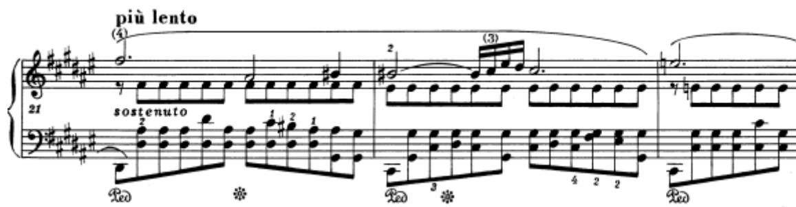
Slika 22. Preludij br. 13 u Fis–duru, taktovi 21 - 23

Ovo je preludij strukture A B A, širokog akordičkog zvuka s jednoglasnom melodijom i troglasnom pratnjom. Lijeva ruka, u kojoj se nalaze osminke u službi pratnje, je na početku označena legato , što znači da njezinim sviranjem treba postići jednoličnu konstantnu obojenu podlogu melodiji. Također, sviranjem desne ruke vrlo sostenuto i dajući pažnju svakome tonu može se postići poželjna duga, pjevna fraza. Drugi je dio, B, označen più lento i drugačije je strukturiran od A dijela – melodija je u zapisu jednoglasna, iz čega slijedi da ju treba svirati određenije. U ovome preludiju poželjno je u velikom opsegu korištenje pedala kako bi se postigla željena boja i duga fraza.