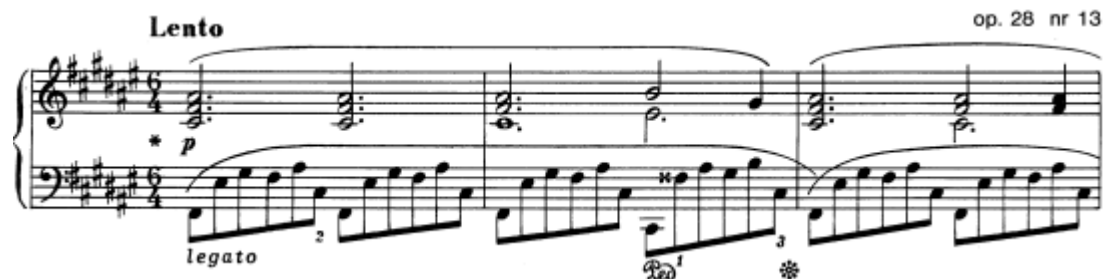
Slika 21. Preludij br. 13 u Fis–duru, taktovi 1 – 3