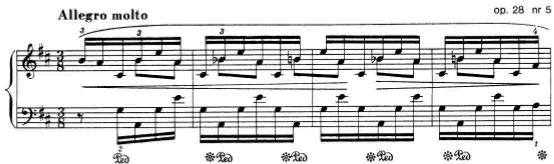
Slika 10. Preludij br. 5 u D–duru, taktovi 1 – 4