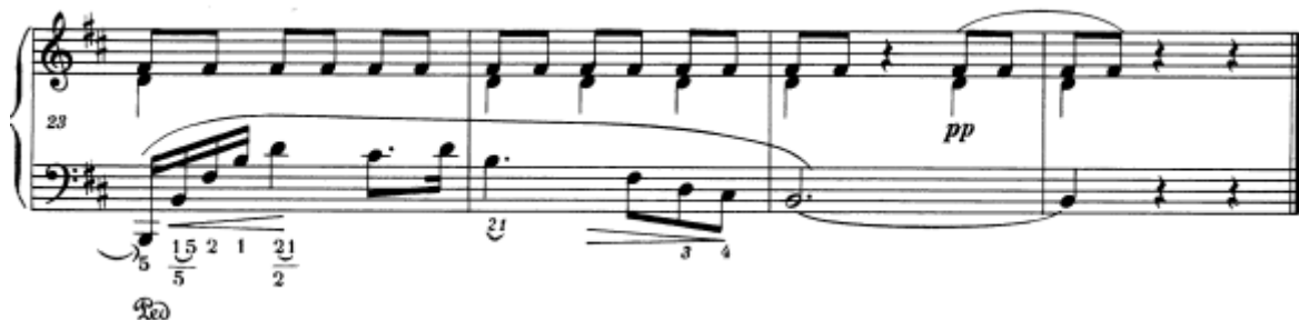
Slika 13. Preludij br. 6 u h–molu, taktovi 23 - 26

George Sand je o ovome preludiju zapisala sljedeće: „ Postoji jedan ( preludij ) kojeg je smislio na kišnu i tmurnu večer i koji gura duh u potpuni očaj. ( ... ) Kad sam mu skrenula pažnju na kapljice kiše koje su zaista ritmično padale na krov, rekao je da ih nije čuo. ( ... ) Njegova kompozicija nastala te večeri bila je, doista, puna kapljica kiše, koje su se sa jekom odbijale od rezonantnog krova samostana, ali u njegovoj mašti i melodiji postale su suze koje padaju s neba na njegovo srce.“ 18