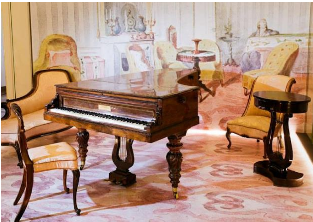
Slika 2. Chopinov Pleyel iz 1848., slika iz Muzeja Fryderyka Chopina u Varšavi