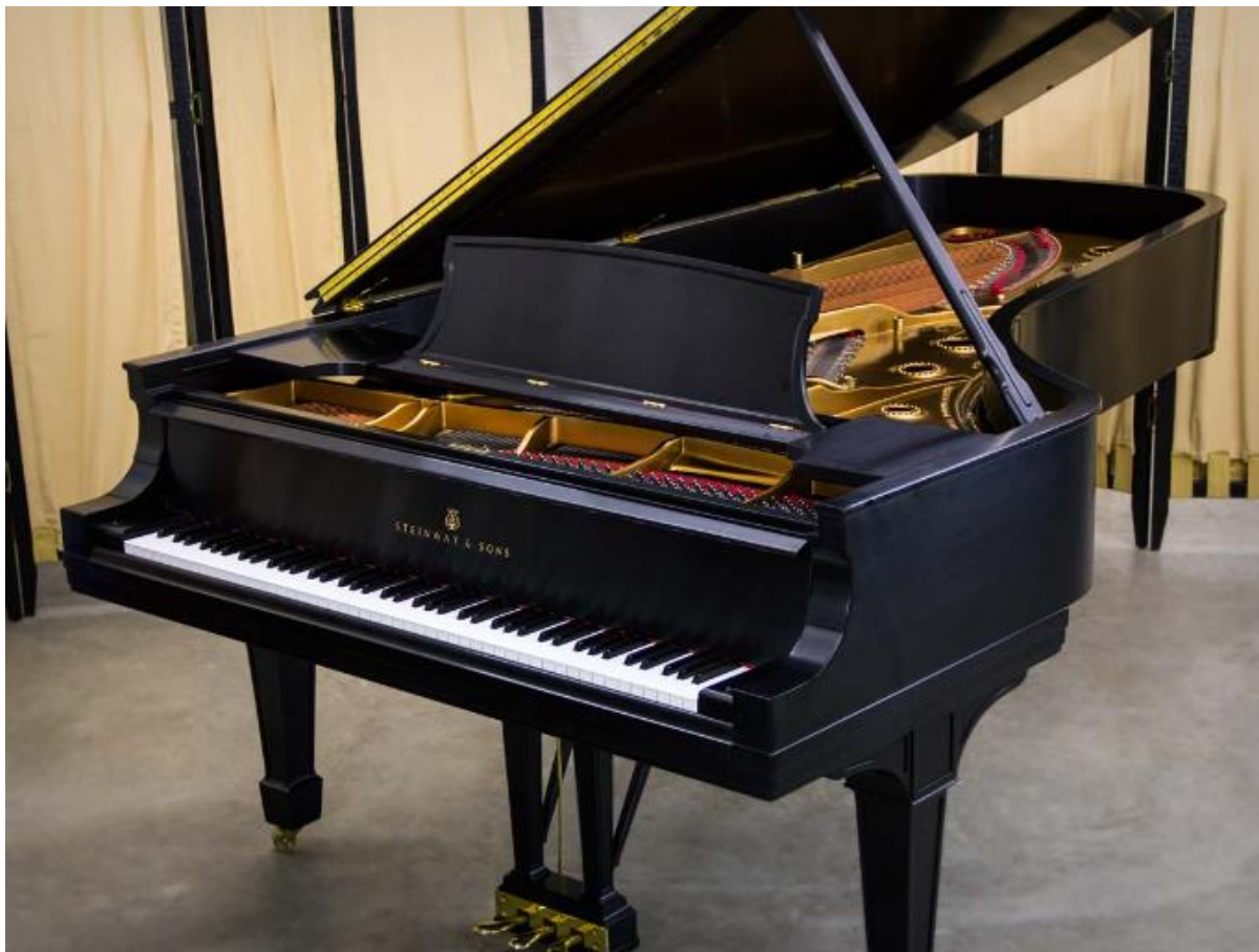
Slika 1. Moderni klavir, Steinway & Sons, model D