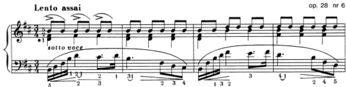
Slika 12. Preludij br. 6 u h–molu, taktovi 1 – 4