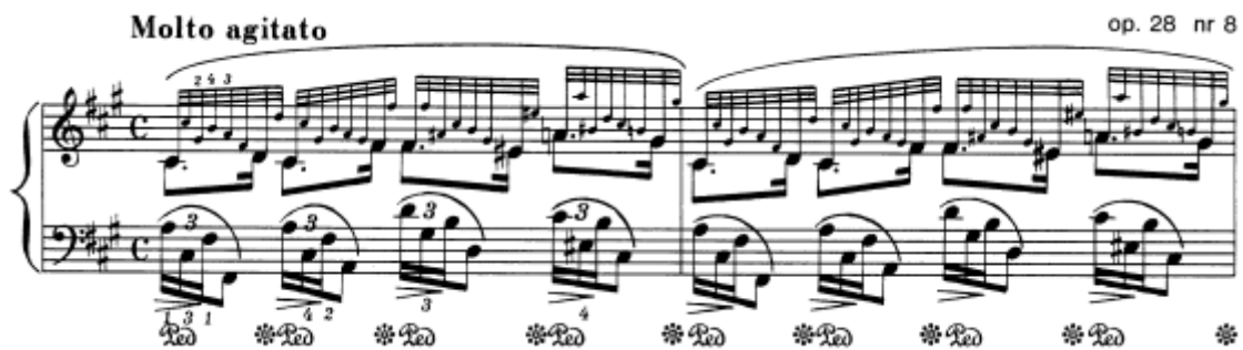
Slika 15. Preludij br. 8 u fis–molu, taktovi 1 – 2

Ovaj preludij, na prvi pogled poput etide, i doista jedan od tehnički zahtjevnijih, sastavljen je od tri razine zvuka koje je potrebno odvojiti. U prvome je planu melodija sastavljena od punktiranog ritma, u srednjem planu su rastavljeni akordi u lijevoj ruci, dok su ostalne tridesetdruginke u desnoj pozadina u svrsi boje. Oznaka je na početku molto agitato , dakle uzbuđeno, označujući dramatičan karakter, s kulminacijom u reprizi koja je označena molto agitato e stretto . Dakle, uzbuđenje treba biti prisutno kroz cijeli preludij i rasti prema kraju. Ta tenzija i strast postižu se stalnim mijenjanjem obojenosti tridesetdruginki, naglašavanjem promjena harmonija i, uvjetno rečeno, tempa, obzirom da uputu stretto u reprizi možemo shvatiti kao malo brži tempo. Dodatni adut u postizanju dramatičnosti je pedal, koji je zapisan u autografu, na početku s puštanjem na zadnju šesnaestinku svake dobe, a kasnije postoje i duži pedali, po dvije dobe, na samome kraju i po četiri.