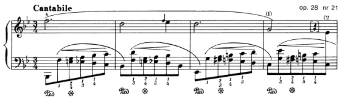
Slika 32. Preludij br. 21 u B–duru, taktovi 1 – 4

Ovaj preludij poput nokturna trodijelnog je oblika ( A B C ), smirujućeg i ljupkog karaktera s izražajnom melodijom u desnoj ruci i pratnjom u lijevoj. Uputa cantabile naglašava važnost melodije koju treba izvesti legato pjevnim tonom, a pratnju lagano i tiho.