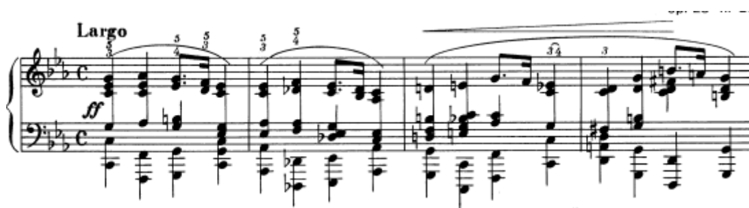
Slika 31. Preludij br. 20 u c-molu, taktovi 1 - 4

„Ti akordi ( odsvirani pod njegovim prstima ) bili su božanski, a ne s ove Zemlje, bili su to akordi puni inspiracije koja doseže vječnost.“ 20