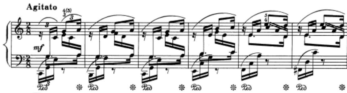
Slika 3. Preludij br. 1 u C-duru, taktovi 1 - 6

Brojni izvori ističu da tonalitetom i građom, s temeljem u isprekidanim akordima, uvelike podsjeća na Bachov prvi Preludij iz zbirke „Dobro ugođeni klavir“. Schumann ga opisuje kao strastveno disanje . Oznaka ovog preludija je agitato , uzbuđeno, označujući veličanstven početak ciklusa. Ta oznaka daje slobodu u tempu omogućujući izvođaču sviranje svake fraze do kraja odslušano i dinamički bogato. Chopinov akordički zapis šesnaestinki može značiti da sveukupni zvuk treba odavati dojam akorada koji se harmonijski mijenjaju, što se postiže svirajući šesnaestinke legato , a ne preartikulirano i odvojeno.