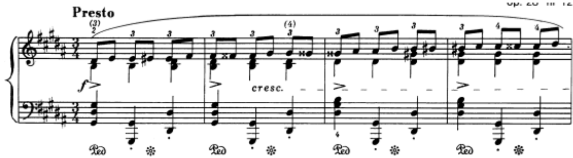
Slika 20. Preludij br. 12 u gis–molu, taktovi 1 – 4

Ovaj je preludij strukturom velika trodijelna pjesma ( A B A ) s kodom. U desnoj ruci se nalazi, većinom uzlazni, nekad i silazni, obrazac osminki kromatskog kretanja s konstantnim ponavljajućim tonovima, što preludij, uz zadani brzi tempo, čini tehnički vrlo zahtjevnim. Osim toga, njega krasi strastveni i jaki karakter, potkrijepljen čestom uporabom neakordičkih tonova te uzbudljivih harmonijskih progresija. Srednji, B, dio ima mirniji, plemeniti karakter. Dinamičke oznake kroz cijeli preludij su forte , s oznakama crescenda i decrescenda , što naglašava njegov snažni karakter. Prema kraju dolazi smirenje, uz oznake poco ritenuto i diminuendo do posljednja dva takta u kojima dolaze dva staccato trozvuka označena fortissimo , kao jeka prijašnjeg snažnog zvuka.