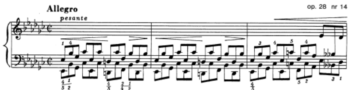
Slika 23. Preludij br. 14 u es–molu, taktovi 1 - 3

Preludij je sastavljen od unisonih triola u desnoj i lijevoj ruci u oktavama. Oznaka tempa je allegro , a mjera je, prema autografu, dvopolovinska – osjećaj dva otkucaja u taktu omogućava da tempo stalno ide malo naprijed, čime se postiže i željeni napeti karakter. Interpretativna oznaka na samome početku je pesante , značenja teško, a u brzom tempu je, što preludij čini tehnički izazovnim. Uz prožimanja crescenda i decrescenda kroz cijeli preludij, jedina striktna dinamička oznaka je fortissimo u 11 – om taktu, što implicira pretežnu glasniju dinamiku. Također, nema niti jedne oznake za pedal što označava, vjerojatno traženi, „ suhi “ zvuk. U današnjim izvedbama se, naravno, koristi pedal, ali ovu ideju zvuka bi trebalo imati u razmišljanju o sveukupnom zvučanju.