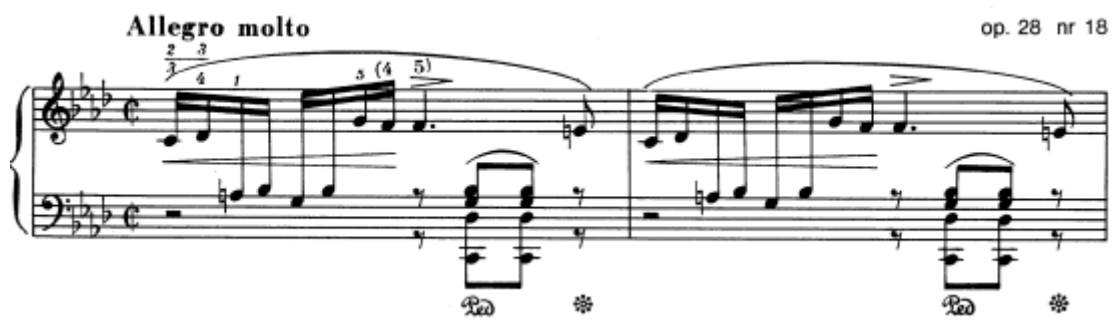
Slika 28. Preludij br. 18 u f–molu, taktovi 1 – 2