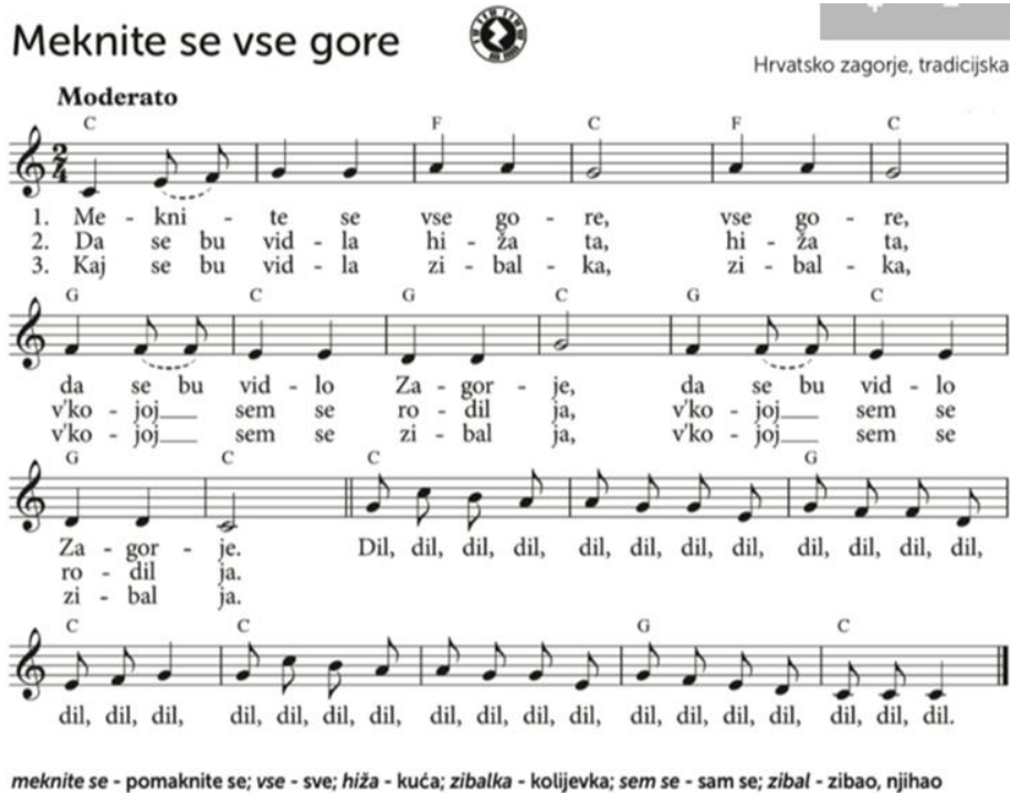
Slika 18. „Meknite se vse gore“

Uz ovu pjesmu moguće je uvježbavanje tradicijskog plesa iz Hrvatskog zagorja. Učenicima bi se predstavio folklorni ples te bi oni u nekoliko susreta naučili korake i koreografiju koju bi zatim mogli prezentirati u školi ili na nekoj drugoj kulturnoj manifestaciji. Bilo bi poželjno kada bi učenici imali mogućnost odjenuti narodne nošnje – u ovom slučaju iz Zagorja – i u njima otplesati uvježbani ples. Uz to, vjerujem da bi se mnogi učenici zainteresirali za tradicijsku glazbu te izrazili želju za sviranjem na tradicijskim glazbalima. U tu svrhu moguće je pokretanje „malih tamburaša“ koji bi funkcionirali kao izvannastavna aktivnost. Svrha te aktivnosti bila bi da učenici nauče svirati tamburice te da se postupno osnuje orkestar koji bi u budućnosti pratio ples i pjevanje tradicijskih pjesama. Vjerujem kako bi ta aktivnost bila dobro prihvaćena jer u svojoj sredini imam dobar primjer vrlo uspješnog funkcioniranja takve aktivnosti, zahvaljujući voditelju koji je zainteresiran da djeci prenese svoje znanje i vještine.