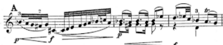
Slika 2: Početak 1. razvojnog dijela Bachovog Adagia

Nakon prva tri takta B-dijela dolazi do mutacije u G-dur i ubrzo do modulacije u C-dur u kojem se odvija ostatak B-dijela. Nakon prva tri takta B-dio je okarakteriziran melodijskom razradom prvotnog punktiranog motiva: melodijske linije su šireg intervalskog opsega te se u pojedinim taktovima dodaje terca ili seksta glavnoj melodijskoj liniji. U 34. taktu prekida se dosadašnja akordska pratnja punktiranom melodijom, dolazi do modulacije u G-dur, a melodija prelazi u donji glas dok je nova pratnja (dugi ležeći tonovi) u gornjem glasu. U donjem glasu se pojavljuje sekvenca s modelom u trajanju od tri dobe. Ubrzo nakon pojavljuje se dio koji slični početku B-dijela (1. razvojni dio u tridesetdruginskim notnim vrijednostima) u C-duru, privremena modulacija u c-mol, mutacija u C-dur te autentična kadenca u G-duru.