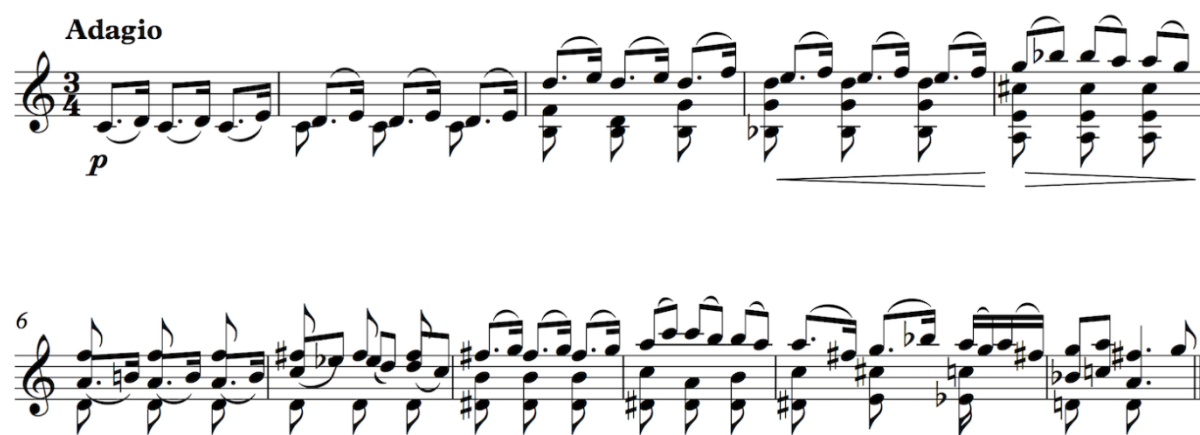
Slika 1: Prvih 11 taktova Bachove 3. sonate

U Bachovom Adagiu A-dio počinje u C-duru koji traje prvih devet taktova nakon kojeg slijedi enharmonijska modulacija preko sm7 na povišenom II. stupnju C-dura u g-mol. Na kraju A-dijela prekida se karakteristični punktirani ritam pojavom četiri šesnaestinke na trećoj dobi tog takta i punktiranom četvrtinkom u idućem taktu. U tom taktu (11. takt) završava A-dio polovičnom kadencom na V. stupnju u g-molu.