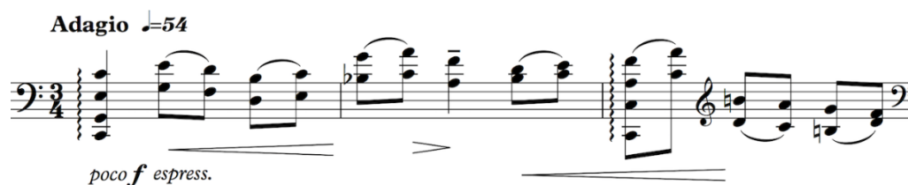
Slika 6: Prva 3 takta Regerovog Adagia

I kod Regera, i kod Bacha, kod početnog izlaganja motiva nema izmjena harmonija, već se izlaganje odvija samo na I. stupnju G-dura. Najveća sličnost, osim zadržavanja harmonije, je upravo spomenuta akordička figuracija i osjećaj stabilnosti te zatvorenosti motiva koji Bach postiže skokovitom izmjenom tonova h i d kojom se potvrđuje tonički kvintakord G-dura, a Reger melodijskom linijom koja vodi do tonike (ton g) u zadnjoj šesnaestinki motiva.