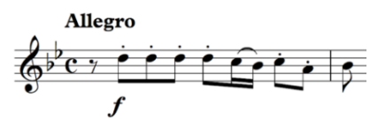
Slika 8: Tema Bachove Fuge.

Kod oblika fuge bitno je sagledati temu budući da je od nje i eventualnog stalnog kontrapunkta građena većina stavka. Tema Bachove fuge prve sonate počinje osminskom pauzom i traje četiri dobe (jedan takt) i jednu osminku. Upečatljivi element kod nastupa teme je ponovljeni ton d2 u četiri uzastopne osminke nakon kojeg slijedi izmjena harmonije (zbog jednoglasne melodijske linije teško je jednoznačno ustanoviti o kojoj je harmoniji riječ), uz karakterističnu pojavu šesnaestinskog izmjeničnog tona na lakom dijelu 3. dobe.