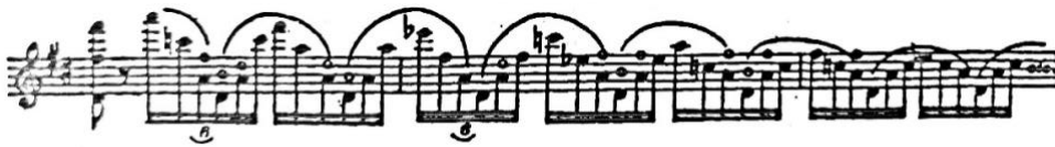
Slika 2. Brahmsova alternativna verzija (Schwarz, 1983)