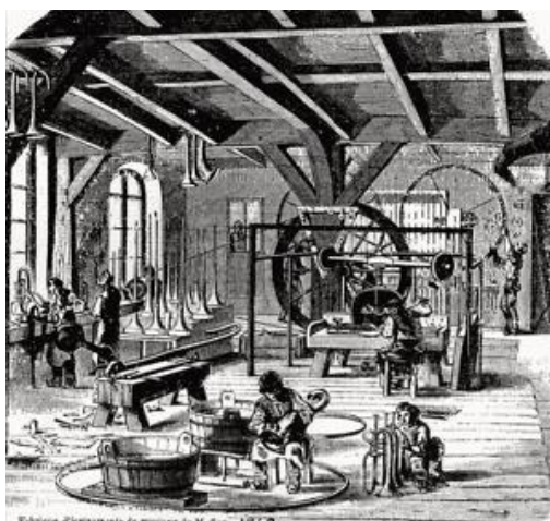
Ilustracija 1: Saxova tvornica u No. 10 Rue Neuve Saint-Georges u Parizu 7

Adolphe Sax je, preselivši se u Pariz 1843., otvorio svoju radionicu na No. 10 Rue Neuve Saint-Georges (Slika 1). Tijekom prvih nekoliko mjeseci nakon preseljenja, gotovo bez novaca, uspio je nastupajući zaraditi dovoljno novca da radionica može opstati. U novoj radionici i okruženju pogodnom za rad na novim glazbalima, Sax je krenuo u proizvodnju svojih glazbala na kojima je često nastupao kako bi ih promovirao u što boljem svjetlu. 1847. godine, u blizini radionice otvara i koncertnu dvoranu kapaciteta oko 400 sjedala. Berlioz je podržao otvorenje dvorane jer je i sam kazao da je Parizu potrebna manja koncertna dvorana za komorne sastave 6 .