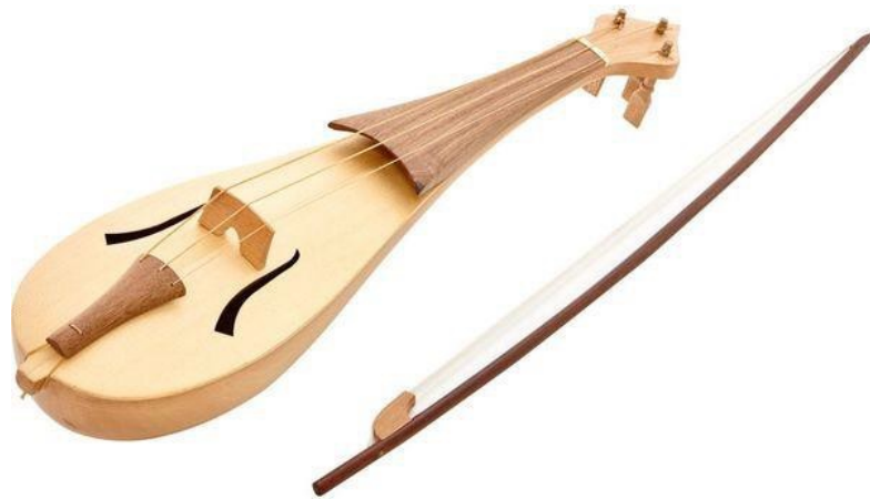
Slika 1: Rebec

Prvi gudački instrumenti u Europi pojavljuju se u srednjem vijeku dolaskom muslimana koji su između ostalih sa sobom su donijeli instrument rabāb , odnosno rebec . Izvorno, rabab je imao plitku rezonantnu kutiju kruškolikog oblika od kože. Dolaskom u Europu koža je zamijenjena drvom te je dodana hvataljka. Rabab se svirao uspravno položen na bedro ili naslonjen na prsa dok je pridržavan bradom. Najbliža poveznica je balkanska izvedenica istog, gusle, koja je i danas aktualna. Tri žice rababa bile su ugođene u intervalima čiste kvinte. U početku rabab je bio instrument sopranskog registra, no do kraja 15. stoljeća rababi su bili izrađivani u rasponu od soprana do basa. U 16. stoljeću rababi su zamijenjeni violama (viol).