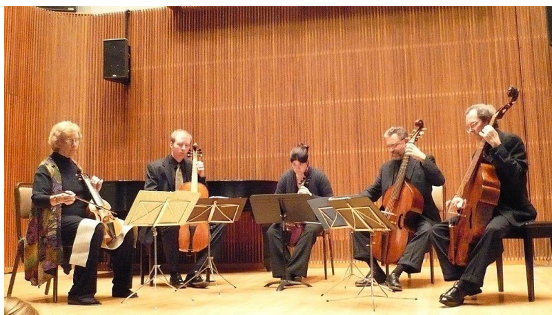
Slika 2: The Smithsonian Consort of Viols

Iako je pojam konsort najčešće povezan s renesansnom glazbom, njegova suština i ideja mogu se primijeniti na različite vrste glazbe u kojima postoji skupina glazbenika ili pjevača koji sviraju ili pjevaju zajedno.