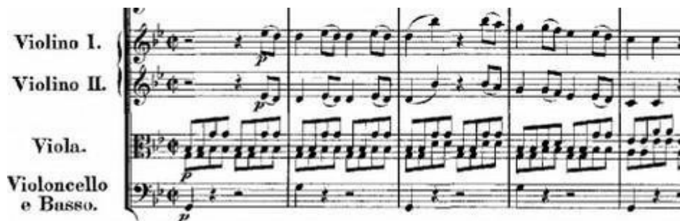
Notni prikaz 2: Ulomak iz Mozartove simfonije u g molu.

Simfonija u g molu je odličan primjer u kojoj je Mozart dao važnost diviziranim violama na početku same simfonije..