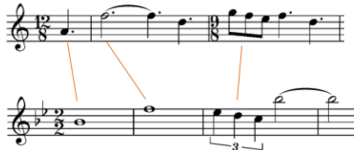
Notni zapis 22: Sličnosti između teme „ Across the Stars “ i Lukeovog lajtmotiva.

Anakin i Padme roditelji su Lukea i Leie stoga se određeni fragmenti teme „ Across the Stars “ poklapaju sa lajtmotivima iz originalne trilogije. Primjerice u A dijelu teme možemo čuti sličan ritamski obrazac i intervalski pomak onome u Lukeovom lajtmotivu. B dio teme bit će sličan B dijelu Lukeove teme. Također bitan je i interval sekste koji ćemo povezati s Leiom.