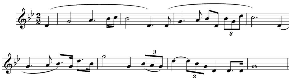
Notni zapis 18: Lajtmotiv sile. Transkripcija i redukcija Erin Keleuva, 2023.

Lajtmotiv Sile jedan je od najprisutnijih u cijeloj Star Wars sagi. Misteriozna energija koja prožima cijelu galaksiju primarno se veže uz vitezove Jedije koji uspješno vladaju Silom i koriste se njome u borbi protiv zla. U originalnoj trilogiji ovaj lajtmotiv prvotno se veže za lika Obi-Wan Kenobija, tj. „starog Bena Kenobija“.