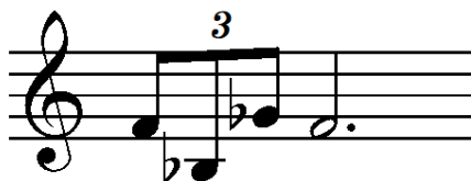
Notni zapis 15: Fragment Yodinog lajtmotiva sa izmijenjenom sekstom i sekundom.

Fragment neizmijenjenog Yodinog lajtmotiva posljednji put čut ćemo u dionici roga u vrlo sporom tempu, a nadovezat će se na temu sile koja će biti popraćena fragmentom motiva u kojem su veliku sekstu i sekundu zamijenile male.