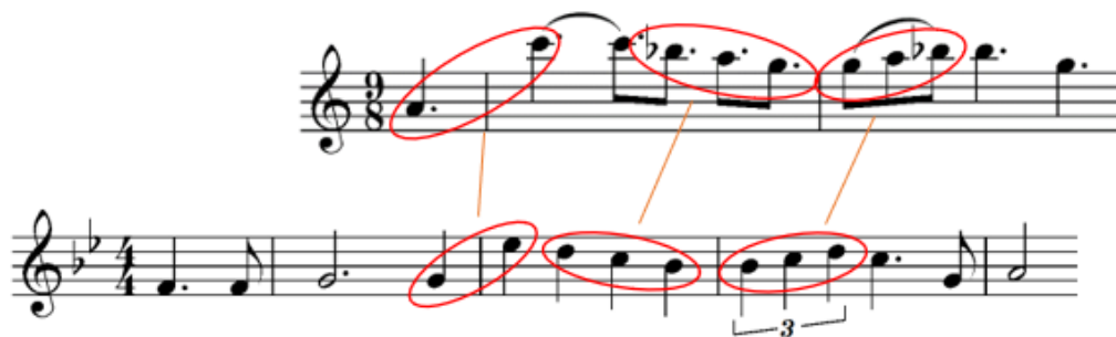
Notni zapis 23: Sličnosti između B dijela teme „ Across the Stars “ i B dijela Lukeove teme.

Transkripcija i redukcija Erin Keleuva, 2023.