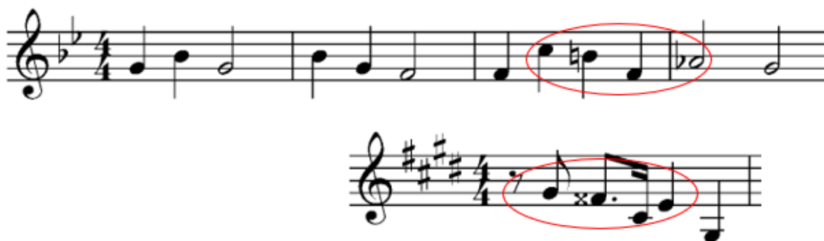
Notni zapis 25: Sličnosti među Sidiousovom i Kylovom temom.

Williams će uspješno Kylovu prošlost, ideale i utjecaje povezati sa lajtmotivima originalne trilogije. Primjerice, njegovu glavnu temu možemo direktno povezati sa Sidiousovim lajtmotivom, a Kylov motiv oklijevanja možemo protumačiti kao nesigurnu verziju Vaderove teme. Pošto je Kylov životni cilj nastaviti djedovim stopama to se očituje i u njegovoj glavnoj temi. Kada poslušamo Sidiousov lajtmotiv i početak Kylove teme možemo primijetiti da je kraj Sidiousovog lajtmotiva gotovo identičan početku Kylove teme. Ovo možemo shvatiti kao nastavak slijeđenja Vaderovih stopa i imperijalnih ideala.