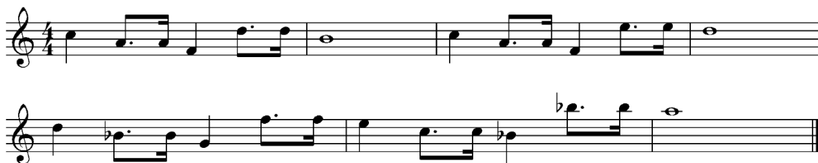
Notni zapis 14: Yodin lajtmotiv izmijenjenog ritma. Transkripcija i redukcija Erin Keleuva, 2023.

Yodina tema u zadnjem filmu originalne trilogije imat će svoja zadnja pojavljivanja u trenutcima kada Yoda umire. Luke se vraća na planet Dagobah kako bi završio svoju obuku i postao Jedi. Yoda ga prima u svoj dom i priča mu o tome kako je star i bolestan. U tom trenutku čujemo Yodin lajtmotiv u E-duru, a naposljetku će mutirati u e-mol. Kada mu Luke kaže da ne može umrijeti na Yodin lajtmotiv nadoveže se lajtmotiv sile. Nakon nekoliko trenutaka melodija će se opet vratiti na Yodin lajtmotiv, ali ovaj puta u potpunosti u molu.