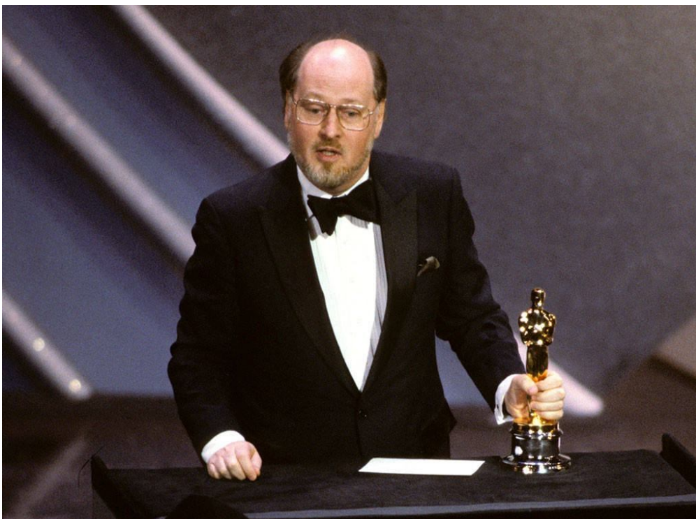
Slika 3: John Williams na dodjeli nagrade Oskar 1978. godine.

Glazba za film Valley of the Dolls (1967., Mark Robinson) Johnu Williamsu donijet će njegovu prvu nominaciju za Oskara, a osvojiti će ga 1972. godine za adaptaciju glazbe i originalnu pjesmu u filmu Guslač na krovu (1971., režija: Norman Jewison) (Reason, 2011.). Radeći na raznovrsnim projektima, John Williams se pokazao kao izrazito sposoban skladatelj koji je svoj tadašnji stil po potrebi mogao prilagoditi bilo kojoj priči koristeći se raznim izvorima i upotrijebivši značajke stilova drugih poznatih skladatelja kako bi stvorio vlastiti zvuk.