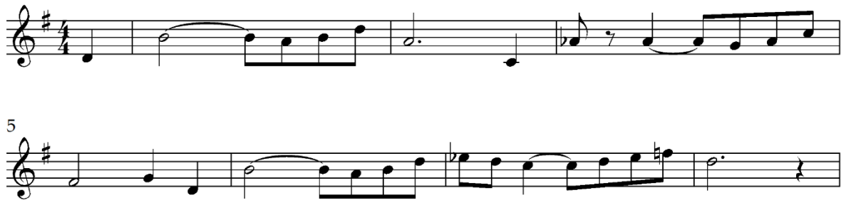
Notni zapis 6: Ljubavna tema „Han Solo and princess Leia“.

Zanimljiva je činjenica da se Lein lajtmotiv u drugom filmu originalne trilogije, „Imperij uzvraća udarac“, pojavljuje tek jedanput te se nakon toga u potpunosti stapa s ljubavnom temom pod nazivom „Han Solo and princess Leia“. Sličnosti među temama postoje, primjerice početni interval sekste je zadržan, ali je kretanje melodije puno gušće nego u Leinoj temi. Zbog toga se tema Hana i Leie čini puno čvršća i romantičnija od prijašnjeg lajtmotiva.