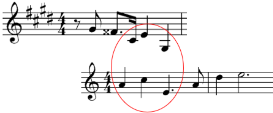
Notni zapis 28: Povezanost Kylove i Reyine teme.

Williams je također uspio povezati Kylovu i Reyinu temu tako što je kraj Kylove teme povezo sa početkom Reyine. Kylo i Rey su povezani u Sili što ih je činilo vrlo moćnima. Sidious je to nazvao „dijadom Sile “. Williams je tu dijadu uspješno projicirao u svoje teme.