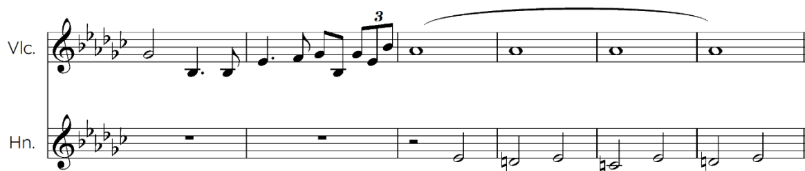
Notni zapis 19: Motiv „Dies Irae“ nakon lajtmotiva sile. Transkripcija i redukcija Erin Keleuva, 2023.

Vrlo zanimljiva pojava lajtmotiva je u sceni kada Luke pronade strinu i strica mrtve. Nakon lajtmotiva sile koji je izložen u dionicama, u rogovima se kratko može čuti motiv iz gregorijanskog koralala „Dies Irae“, koji je Williams simbolički „ugradio“ na kraj ove scene.