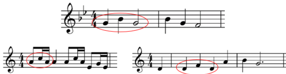
Notni zapis 27: Sidiousov motiv u fragmentima Reyine teme.

Reyina tema podijeljena je na više segmenata, a u više njih moći ćemo čuti Sidiousov lajtmotiv. Na ovaj način Williams je predvidio radnju čak dva filma prije potvrđivanja iste na velikom platnu. Primjerice, u motivu „galopa“, koji je zapravo jedan od prvih segmenata Reyine teme koji čujemo u filmu, možemo načuti fragment Sidiousovog lajtmotiva. Također, Sidiousov fragment možemo čuti i u punom izlaganju Reyine teme gdje on ostaje tek suptilan element koji ne iskače previše iz cjeline.