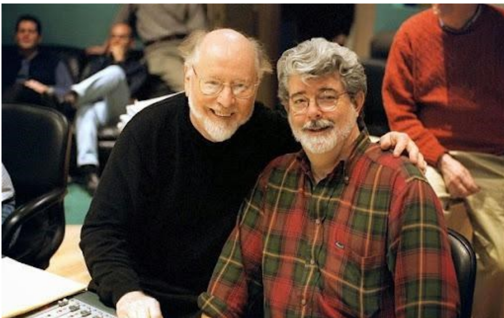
Slika 5: John Williams i George Lucas u Abbey Roads studiju prilikom snimanja glazbe za drugi nastavak novije trilogije „Star Wars“ (2002)