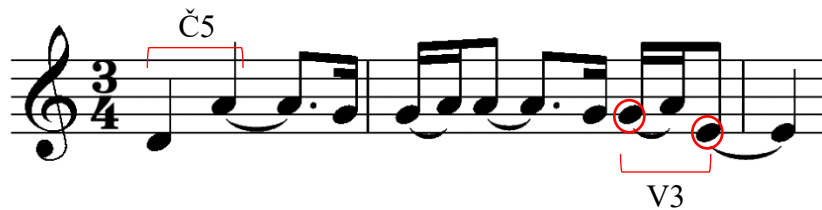
Notni zapis 4: Fragment Lukeovog lajtmotiva, izmijenjen melodijski i ritamski. Transkripcija i redukcija Erin Keleuva, 2023.

Lukeova tema prolazi i kroz razne ritamske, melodijske i harmonijske varijacije. Trenutci mira odlikuju se čistim harmonijama, kao i akcijske scene u kojima će ritamski puls biti brži dok će scene u trenucima sumnje i straha biti prožete disonantnim akordima kao i lajtmotivom u molu. Melodija će u većini slučajeva ostati potpuno prepoznatljiva, ali u sljedećem primjeru 5 je toliko komprimirana da je ostao prepoznatljiv samo interval čiste kvinte na početku te interval velike terce na kraju lajtmotiva.