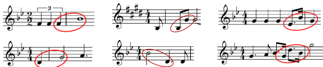
Notni zapis 20: Poveznice sa lajtmotivom sile u lajtmotivima Lukea, Leie i Darth Vadera.

Fragmenti lajtmotiva sile utkani su u lajtmotive ostalih likova osjetljivih na silu. Primjerice, Lukeov lajtmotiv ponekad počinje triolskim uzmahom koji sa samom početkom lajtmotiva čini čistu kvartu što je vrlo slično čistoj kvarti na početku lajtmotiva sile. Interval velike sekste povezat će silu sa Leiom, a rastavljeni molški kvinakord s Vaderom.