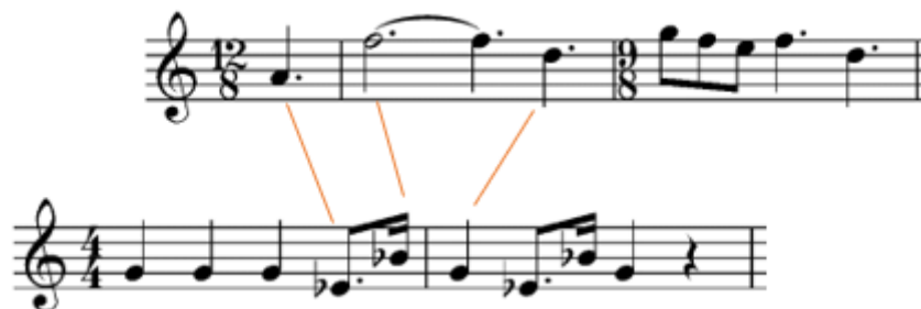
Notni zapis 24: Vaderov motiv u temi „ Across the Stars “.

Unutar teme možemo čuti i fragment Vaderovog lajtmotiva iz razloga što je Anakin upravo zbog ove tragične ljubavi i prešao na tamnu stranu sile.