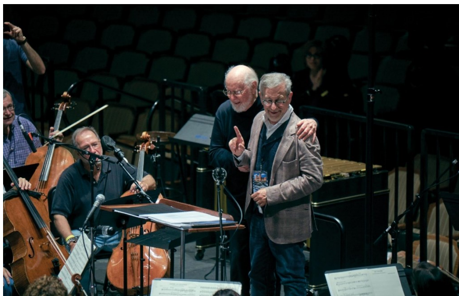
Slika 4: John Williams i Steven Spielberg na snimanju glazbe za film „The Fablemans“ (2022).

Film Ralje (1975.) je bio prvi Spielbergov pravi uspjeh koji velike zasluge pripisuje Williamsu zato što je svojom glazbom „oživio“ radnju filma. Glazba za film Ralje Johnu Williamsu donijela je prvi Oskar za najbolju originalnu glazbu. Ralje su bile samo početak četrdesetogodišnje suradnje između Spielberga i Williamsa. Ova suradnja iznjedrila će mnoge nagrađivane projekte kao što su Bliski susreti treće vrste , E.T. , Carstvo sunca , Schindlerova lista te serijale Jurski park i Indiana Jones .