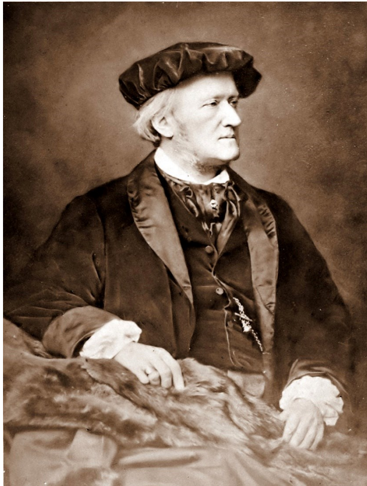
Slika 1: Portret Richarda Wagnera. Franz Hanfstaengl, 1870.

Nakon Wagnera, lajtmotiv postaje standardni dio skladateljske prakse u romantizmu te se očituje u djelima velikih skladatelja kao što su Ludwig van Beethoven, Franz Liszt, Johannes Brahms. Petar Iljič Čajkovski, Sergej Rahmanjinov te Johann Strauss I. (Bribitzer-Stull, 2015; Davies, 2015).