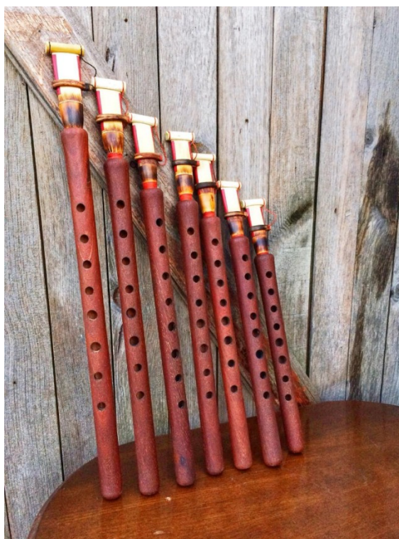
Slika 5: Različite veličine duduka

Duduk je drveni aerofoni folklorni instrument koji ima jedinstveno mjesto u armenskoj povijesti i kulturnoj baštini, s kojom je vezan približno tri tisućljeća. Tradicionalno se koristi pri pogrebima, ali i u raznim slavljinama i praznicima vezanima za armenski nacionalni identitet 4 . U 2005. godini, UNESCO ga je uvrstio na popis nematerijalne kulturne baštine. 5 Iako u regiji postoje slični instrumenti, na primjer gruzijski duduki ili iranski balaban/balaman , duduk se od njih razlikuje građom, načinom sviranja i bojom zvuka. Duduk je građen isključivo od drva marelice, a ima manji pisak i više rupica od turske varijante. Ipak, najznačajnija razlika jest ton. Duduk je instrument koji najbolje izražava tugu i čežnju, svojim toplim i mekim tonom imitirajući karakteristike ljudskog glasa. Uglavnom se koristi za sviranje dugih, liričnih, polaganih melodija, no ima bitnu funkciju i u bržim, plesnim verzijama.