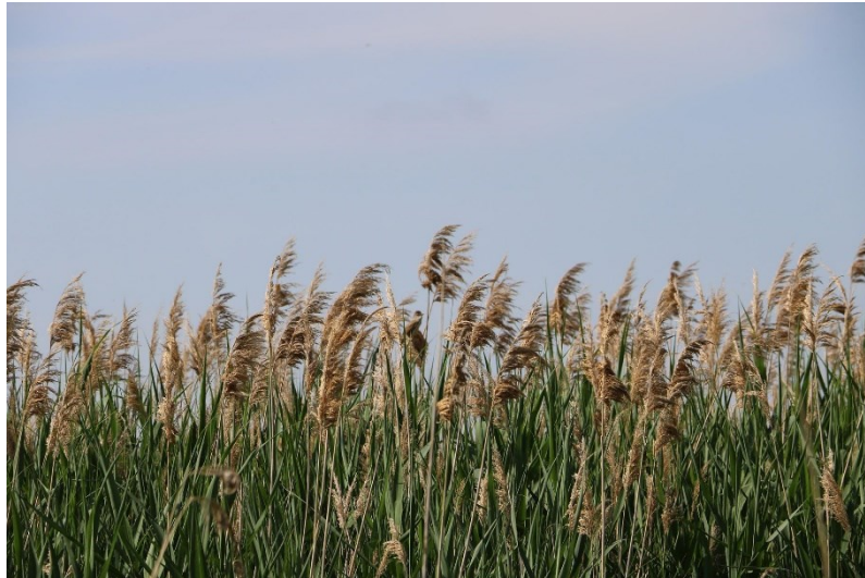
Slika 10: Phragmites australis

Izrada piska vrlo je kompliciran proces koji zahtijeva puno vremena i vještine. Prvi korak je selekcija i rezanje dostupnih trski, koje se prirodno suše 3 godine, a prije sušenja se ne može raditi na njima. Nakon toga, suše se još toliko vremena, ali ovaj put unutra, iznad tradicionalnog kamina irorri s udubljenim vrhom, kako bi ih blizina vatre dodatno dehidrirala. Tim procesom trska postaje otpornija, pisak duže traje i dobiva specifičan prodorni ton. Nakon toga se odreže komad s kojeg se skinu dvije trećine kore, dodaje tanki sloj washi papira na dno, a onda se stisne pomoću kliješta da bi se dobile dvije stranice piska. Pisak se zatim tretira toplinom zapaljenog ugljena kako bi dobio na trajnosti. Poslije se oblikuju vrh, koji treba zaobliti, i dno, koje se umetne u drvenu cjevčicu. Zadnji je korak izrada seme , stezaljke korištene za prilagodbu duljine dijela piska koji se nalazi u sviračevim ustima. Ona kontrolira volumen i boju zvuka. Kada se sve završi, potrebno je napraviti male prilagodbe, a svirači uz pomoć posebnog noža mogu personalizirati pisak.