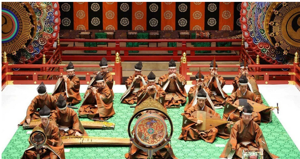
Slika 9: Gagaku ansambl

Gagaku obuhvaća tri cjeline: kunibori no utamai (autohtonu vokalnu i instrumentalnu glazbu uz ples, korištenu u šintoističkim ceremonijama), kangen i bugaku (ples uz glazbu te instrumentalna glazba koja je stigla s kopna), i saibara i rōei (vokalna glazba uz instrumentalnu pratnju koja se razvila u Japanu). Glazbu karakteriziraju spora tempa, ograničeno dinamičko nijansiranje, kompleksna notacija, glasnoća i prodornost, simbolizam, kompleksnost, i ekskluzivna komponenta. Sastav sadrži idiofone, kordofone, membranofone i aerofone instrumente, a u svim žanrovima prisutan je hichiriki. Hichiriki, uz inačicu flaute ryūteki , ima glavnu ulogu u iznošenju melodije u sporom, heterofonom višeglasju.