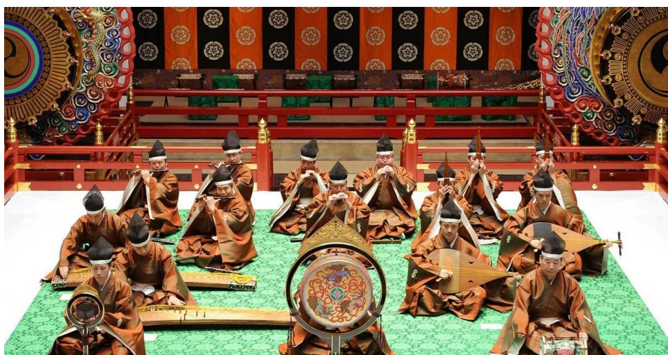
Slika 9: Gagaku ansambl

Gagaku obuhvaća tri cjeline: kunibori no utamai (autohtonu vokalnu i instrumentalnu glazbu uz ples, korištenu u šintoističkim ceremonijama), kangen i bugaku (ples uz glazbu te instrumentalna glazba koja je stigla s kopna), i saibara i rōei (vokalna glazba uz instrumentalnu pratnju koja se razvila u Japanu). Glazbu karakteriziraju spora tempa, ograničeno dinamičko nijansiranje, kompleksna notacija, glasnoća i prodornost, simbolizam, kompleksnost, i ekskluzivna komponenta. Sastav sadrži idiofone, kordofone, membranofone i aerofone instrumente, a u svim žanrovima prisutan je hichiriki. Hichiriki, uz inačicu flaute ryūteki , ima glavnu ulogu u iznošenju melodije u sporom, heterofonom višeglasju.