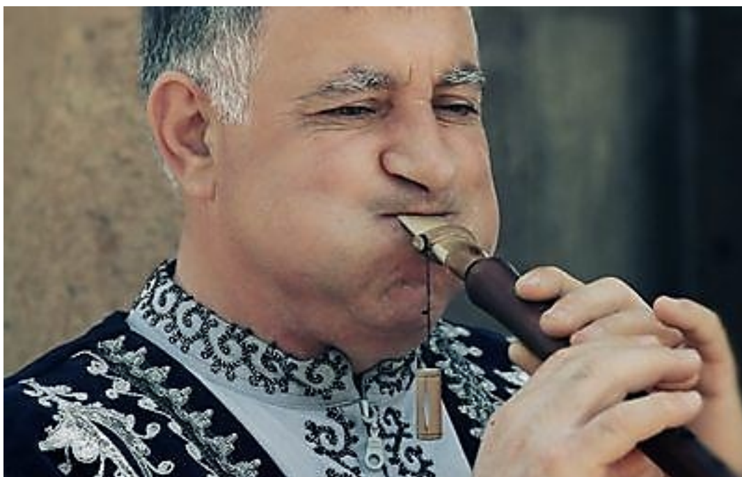
Slika 7: Svirač duduka

Pisak duduka duljine je otprilike trećine tijela instrumenta, a njegov otvor je širi od samog promjera cijevi. Izrađen je od vrste trske Arundo donax , od koje se izrađuju i piskovi za klarinet, obou, fagot i saksofon 8 . Na vrhu instrumenta nalazi se malo proširenje u koje treba smjestiti dobro namočen pisak. Zbog veličine samog piska i opasnosti od oštećenja vrha, većina ih ima dodatne zaštitne navlake koje se stave na vrh nakon završetka sviranja. Osim toga, na sredini piska nalazi se svojevrsna stezaljka zvana parda ; ona kontrolira koliki se dio piska nalazi u sviračevim ustima i pomaže prilagoditi intonaciju. Ako je pisak spreman za sviranje, njegov vrh bit će blago otvoren, a ako nije, potrebno ga je namočiti u vodi. Pri postavljanju piska u usta, parda se mora blago spustiti. Pisak mora biti u istom ključu (transpoziciji) kao i instrument, inače si neće međusobno odgovarati.