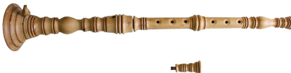
Slika 11: Sopila i špulet

Prije svirke se kroz zvono instrumenta nalijeva voda, pogotovo prilikom vrućih ljetnih dana. Važno je naglasiti da su istarske sopile drugačije od krčkih po odnosima među tonovima, tonalitetima, mjerilima (na primjer veličina), pa čak i glazbenim praksama (sviranje u parovima i sviranje u većim sastavima) 14 . Među najcjenjenije graditelje instrumenata ubrajaju se Ivan Fonović Zlatela, Martin Glavaš, Bruno Učkar i Valter Primožić za istarske sopile, a Marijan Orlić najpoznatiji je graditelj krčkih sopila. Sopile općenito karakterizira glasan, prodoran zvuk, te netemperirano ugađanje koje proizvodi specifične intervale.