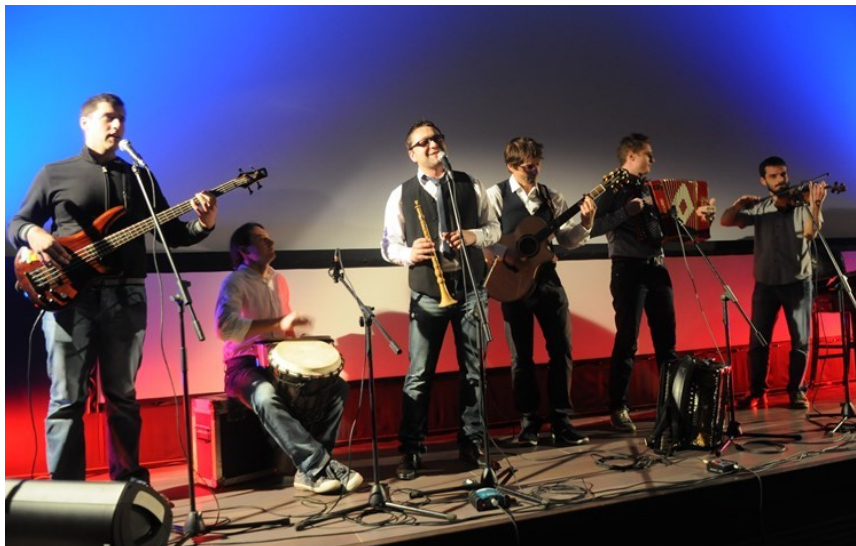
Slika 15: Nastup grupe "Šćike"