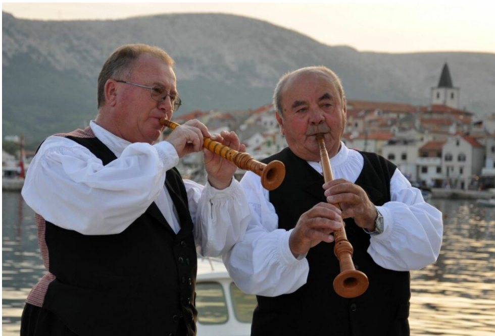
Slika 12: Sviranje vele i male sopile

Uz tonske rupice urezane su i male, blago dijagonalno položene udubine, koje služe tome da prsti bolje zatvore rupice i ne skliznu s istih. Postoje i dodatne rupice s vanjske strane koje služe „za ravnanje glasa“, to jest ugađanje instrumenta. Špulet spaja pisak s tijelom instrumenta. To je valjkasti stupić koji je širi na gornjem dijelu zbog čunjaste rupe u koju se umeće latica ; metalna cjevčica stožastog oblika, svojevrsna hilzna, na koju se natakne pisak.