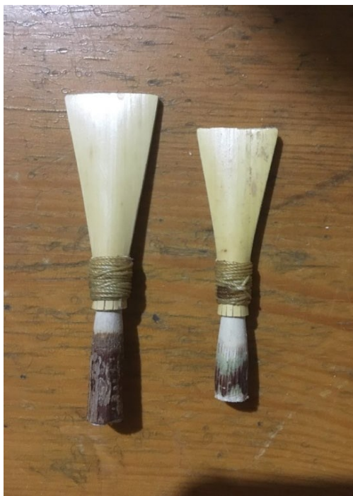
Slika 13: Zavezani piskovi za sopile

Nakon toga je potrebno odrezati bridove tako da se sužavaju prema dnu. Oko rubova se čvrsto namata navoštenu konac uz postepeno stezanje, sve dok na dnu ne nastane kružni otvor koji veličinom odgovara latici. Predzadnji je korak razdvajanje stranica trske pomoću oštrice koja se umeće sa strane i iznutra prema van otvori pisak. Na kraju se vanjske strane postepeno stružu sve dok ne budu dovoljno tanke da vibriraju prilikom puhanja zraka. Prije sviranja se pisak dobro namoči i, ako je potrebno, dodatno stanji kako bi se moglo lakše svirati.