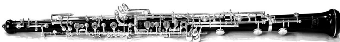
Slika 1: Suvremena oboa

Količina mehanike koja se danas nalazi na instrumentu, uz suvremene tehničke i tonske zahtjeve, dodatno je otežala samo puhanje zraka, iako je olakšala mogućnost izvođenja tehničkih bravura. Oboa je prikladna za duge, pjevne melodije zbog nevelike količine zraka koju troši i tehnike cirkularnog disanja (istovremeno udisanje i ispuštanje zraka). Brzi, artikulirani pasaži, kao i dvostruka/trostruka artikulacija, ne odgovaraju najbolje prirodi instrumenta, pogotovo u niskom registru. Kroz povijest glazbe, oboa je prisutna u svim stilovima, a značajniju je ulogu imala u baroku i romantizmu. Također se koristi u popularnoj i filmskoj glazbi, dok u jazzu nije baš zastupljena. Srodni instrumenti su oboa d'amore i engleski rog, a rjeđe se koriste bas oboa i musette .