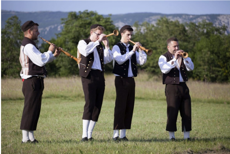
Slika 14: Članovi KUD-a "Ivan Fonović Zlatela" Kršan sviraju sopile