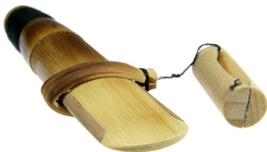
Slika 3: Pisak za duduk