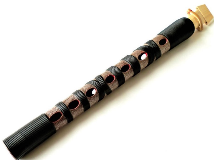
Slika 8: Hichiriki

Hichiriki je japanski folklorni aerofoni instrument izrađen od bambusa. Duljina bez piska mu je oko 18 centimetara, a pisak nadodaje još 4 centimetra. Ima obrnutu koničnu cijev i lakiran je iznutra i izvana. Na prednjoj strani tijela instrumenta nalazi se sedam rupica, a straga su još dvije 9 . Ima jako mali raspon, od g^1 do a^2 , no to nadoknađuje specifičnom bojom tona i izražajnim mogućnostima. Ton je prodoran, nazalan i glasan, idealan za iznošenje glavnih melodijskih linija.