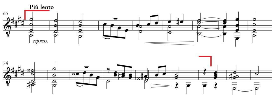
Primjer 12 III. Allegretto vivo , dio c

Na početku B dijela nalazi se velika perioda (8+8 t.) koja započinje uzmahom u prethodnom taktu koji ovom dijelu daje elegantniji karakter. Prva velika rečenica (8 t.) započinje harmonijskom progresijom koja potvrđuje novi tonalitet E-dura. U drugom dijelu rečenice ritam se usitnjava i vodi nas na dominantu E-dura čime završava prva rečenica. Druga velika rečenica (8 t.) također započinje progresijom koja odmah modulira u gis-mol. Novi tonalitet u nastavku se potvrđuje i rečenica završava na tonici gis-mola.