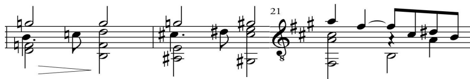
Primjer 17a I. Allegro moderato , t.19– t.21

Prijelazni dio u fis-molu građen je kao mala rečenica (4 t.) i baziran je na materijalu iz prvog stavka (I. stavak: t.19 – t.21). Glavna uloga prijelaznog dijela je nastup vrhunca sonate kao i povratak u temeljni tonaliteta djela. Prvi dio rečenice obogaćen je motivom iz drugog takta prve teme u svom inverznom obliku dok je drugi dio rečenice kompletno građen na augmentiranom motivu iz takta 21 prvog stavka sonate. Prva tema zadnji se put javlja u skraćenom obliku (4 t.) i veže se na codu .