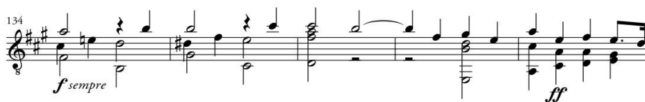
Primjer 17b IV. Allegro non troppo e serio , prijelazni dio, t.134 – t.138