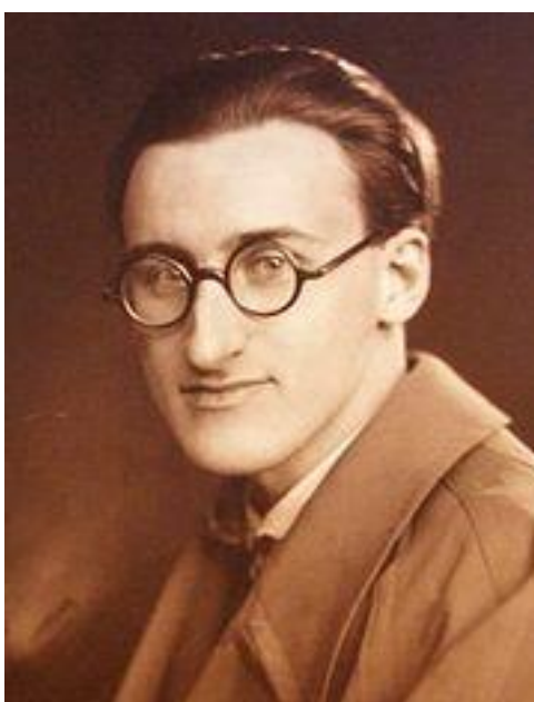
Slika 1. Boris Papandopulo kao mladi glazbenik

U dobi od 18 godina Papandopulo je imao svoj prvi javni nastup u Hrvatskom glazbenom zavodu u Zagrebu. 10 Možemo reći da je to početak njegove umjetničke karijere, gdje je ujedno dirigirao svoju kompoziciju „Svatovske pjesme“, čime se uspješno profilirao kao dirigent i kompozitor. Nakon što je 1929. god. diplomirao na Muzičkoj akademiji u Zagrebu sa temom diplomskog rada Umjetnost dirigiranja 11 , već iste godine preuzima vodstvo nad pjevačkim društvom „Kolo“ čiji je glavni cilj bio njegovanje hrvatske narodne glazbene umjetnosti, a od 1931. do 1935. god. intenzivno surađuje sa Hrvatskim glazbenim zavodom gdje ujedno preuzima ulogu dirigenta Društvenog orkestra. 12