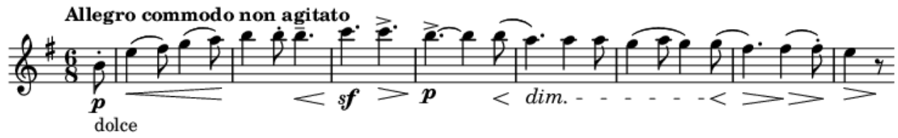
Slika 4. Tema Vltave