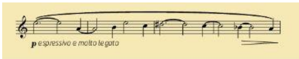
Slika 6. Sunčana polja – tema B