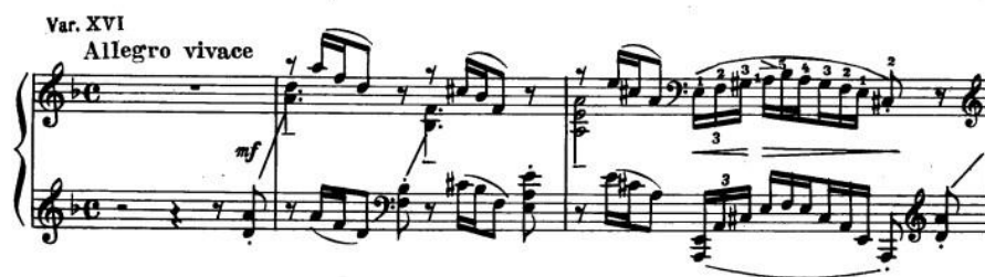
Primjer 12: promjena karaktera u 16. varijaciji