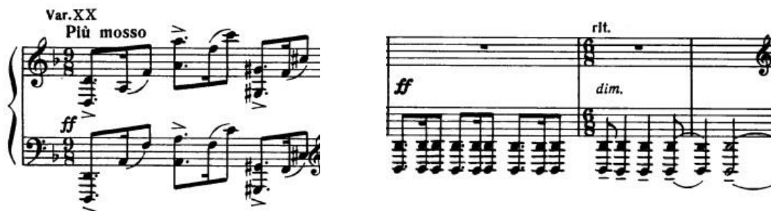
Primjer 16: početak (slika lijevo) i završetak 20. varijacije (slika desno)

taktu. Ritam je zadržan iz prethodne dvije varijacije. Dionice obje ruke kreću se paralelno i većim dijelom unisono, što je također karakteristika prethodnih. Varijacija se sastoji od dvije velike rečenice i vanjskog proširenja druge rečenice. Repetitivnost rečenica prekida promjena kretanja smjera u drugoj rečenici, u taktovima 13-16, koji imaju funkciju pripreme već navedenog vanjskog proširenje. Ono započinje u 17. i završava u 27. taktu. Tu Rahmanjinov upotrebljava harmonije septakorda, nonakorda i undecimakorda. Nakon uzlaznog i silaznog kretanja oktava i akorda dolazi do ponavljanja oktava na tonu „d” u niskom registru čime se dobiva osjećaj završetka borbe cijelog ciklusa. Ovdje skladatelj kao da je rekao jednostavno "dosta".