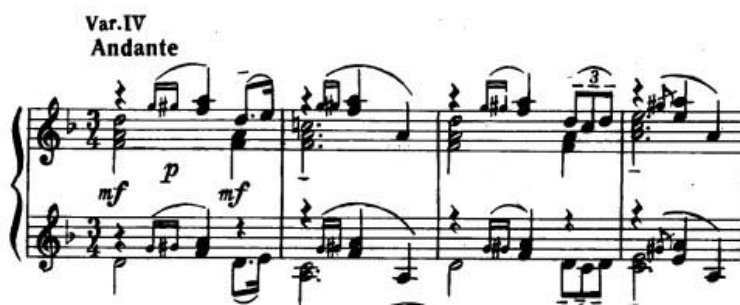
Primjer 5: pregled dvaju prisutnih registra u varijaciji (taktovi 1-4)

Ovdje možemo odmah naglasiti važnost "zvona" u Rahmanjinovljevoj inspiraciji u pisanju ovog ciklusa, a i mnogo ostalih svojih kompozicija. Na samom početku varijacije primjećujemo razliku dubokog i visokog registra koji se čitavo vrijeme nadopunjuju, a melodija teme neprekidno se prožima kroz oba registra. Zvona se očituju u dubokom registru koji ih imitira, a visoki registar stvara efekt jeke. Cijela ljepote ove varijacije zapravo leži u tim promjenama. Građena je od dvije velike rečenice od kojih svaka ima 8 taktova. U 2. i 10. taktu pojavljuje se ton "c" umjesto tona "cis" koji je dosad bio svojstven melodiji teme. Promjena harmonije nastupa od 13. do 16. takta gdje je tema improvizirana i gotovo neprepoznatljiva.