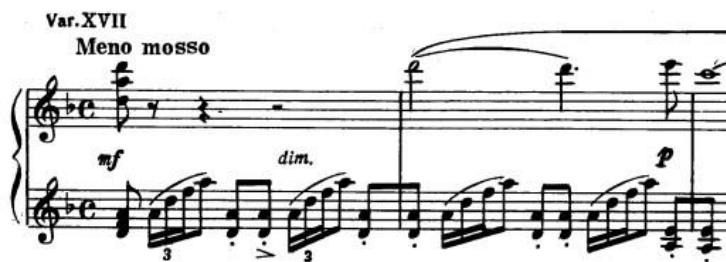
Primjer 13: prikaz violinske tehnike u ostinatima dionice lijeve ruke

Nakon prve varijacije iz završnog dijela (odnosno 16.) s njezinim energičnim, ofenzivnim karakterom, na prvi se pogled dešava nešto nerazumljivo: kretanje i stupanj dinamike te struktura notnog teksta mijenjaju se na posve nov i kontrastan način. Karakter pratnje u dionici lijeve ruke, s kojom i započinje ova varijacija, intrigira i daje osjećaj nemira. Rastavljeni akordi i ritmički ostinato u kvintama daju melodijskoj liniji teme "usamljeni" karakter. Figure rastavljenih akorda u dionici lijeve ruke potaknuta je ponovno violinskom tehnikom kojom je Rahmanjinov bio inspiriran. Ova varijacija ne sadrži rečenice određenog trajanja već se sastoji od niza fraza koje uobičajeno traju po dva takta. U zadnja četiri takta pojavljuje se dodatak ovoj varijaciji označen s poco meno mosso u kojemu dionice obje ruke imaju paralelno kretanje i izmjenu harmonija dominantne i toničke funkcije.