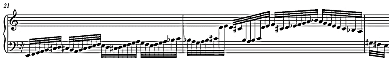
Slika 3.04. P 803, ranija varijanta t. 21-25 (t. 21-23)

niz) i harmonijskom planu ova dva takta (A-dur, zatim d-mol), Johann Sebastian Bach je u revidiranom izdanju očito odlučio nadovezati se na intenzitet kojeg je gradio gotovo od početka kompozicije, umjesto da ga gradi iz početka (kao u ranijoj verziji).