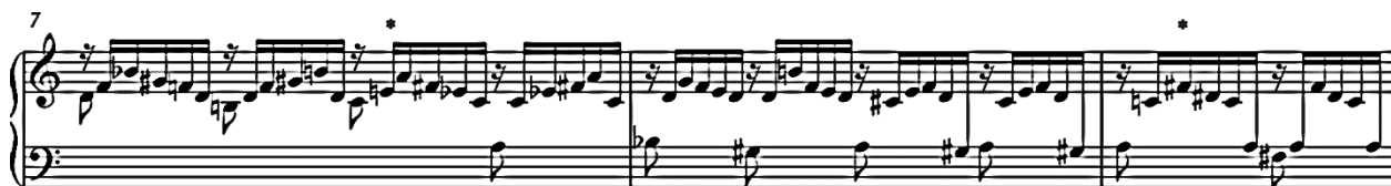
Slika 3.03. P 551, varijanta t. 7-8

Međutim, za određene se promjene pretpostavlja da potječu iz prvotne verzije Fantazije (BWV 903a). Ta je ranija varijanta u rukopisu Johanna Tobiasa Krebsa (P 803) nešto kraća od one u većini poznatom revidiranom izdanju (t. 21-25). U okviru dva takta obuhvaća jednu gestu (slika 3.04). Obje verzije započinju uzlaznom tiratom 14 počevši od istog tona. Ipak, potpuno su različite jer ranija verzija započinje u dubokom registru tonom E , a kasnija s e' te nešto dužim nizom dolazi do b'' nakon čega se kreće u suprotnom smjeru. Ostavši vjeran teksturi (neprekinuti šesnaestinski