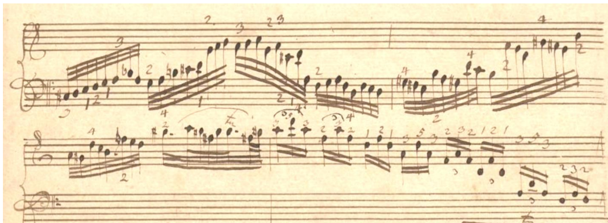
Slika 3.05a. P 551, t. 24-26

Paralelno mjesto u drugom izvoru (P 887) ne nudi tako dobar prstomet. Desna je ruka nešto angažiranija u t. 24 te mijenja nekoliko pozicija kako bi izvela sve tonove u dubokom registru (slika 3.05b).