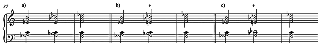
Slika 3.01. varijante t. 37 11

U harmonijski važnijim trenucima u recitativu 12 takav propust na neki način bitno mijenja cjelokupni dojam (slika 3.02). 13 U kratkom trajanju od samo jednog takta, modulacijom iz A-dura