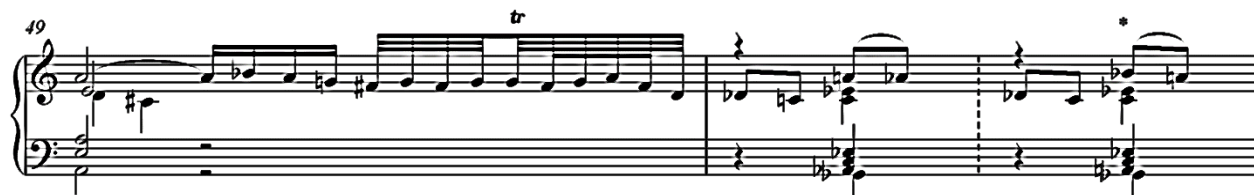
Slika 3.02. Am.B 548, varijanta t. 49-50

Pojedine su varijante nastale možda slučajno. Na samom početku nekih rukopisa (P 551, Am.B 548) predznaci čine nezamjetnu razliku u odnosu na ostale izvore (slika 3.03). Harmonijski gledano nije riječ o velikoj intervenciji ( e'/es' ; fis'/f' ).