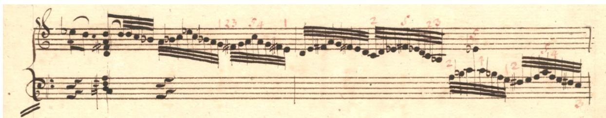
Slika 3.08. Am.B 548, t. 63-64

„Premetanje izvode i drugi prsti, a lakše je kad dulji prst prelazi preko kraćega ili preko palca; koristi se također kad nam „nedostaje“ prstiju. Spretno podmetanje treba izvježbati tako da ne dolazi do zaplitanja prstiju.“ 23