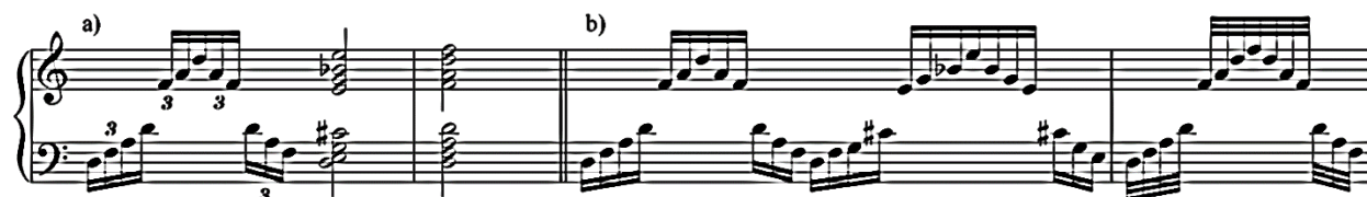
Slika 3.10. t. 27

Izvor daje rješenja za prohodne tonove zapisane u četvrtinskim notnim vrijednostima. Taj slučaj može se pojaviti u najgornjem glaslu (slika 3.11) ili u unutarnjem (slika 3.12).