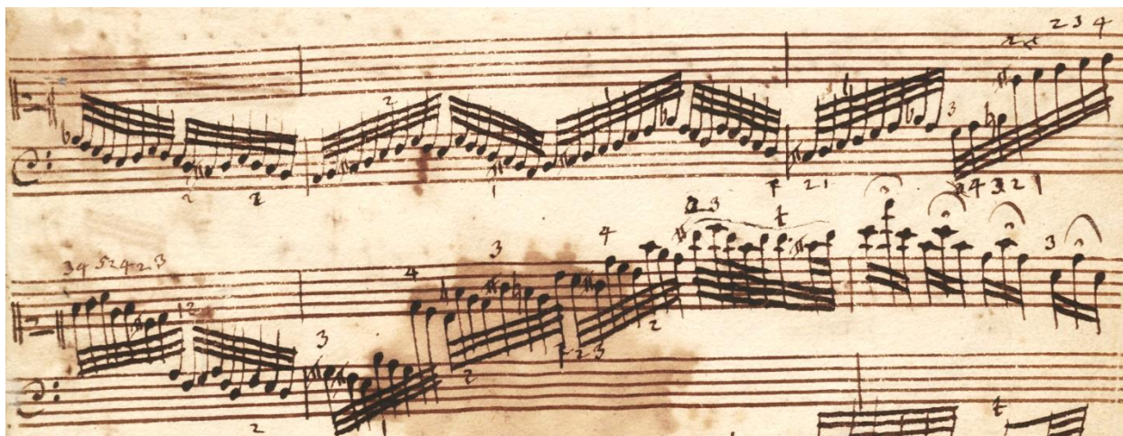
Slika 3.05b. P 887, t. 22.5-26

Rukopis P 551 nudi sasvim jednostavno rješenje prstometu za silazni rastavljeni kvintakord d-mola (slika 3.05, takt 26). Predložen je prstomet u kojem ruka cijelu poziciju kvintakorda u