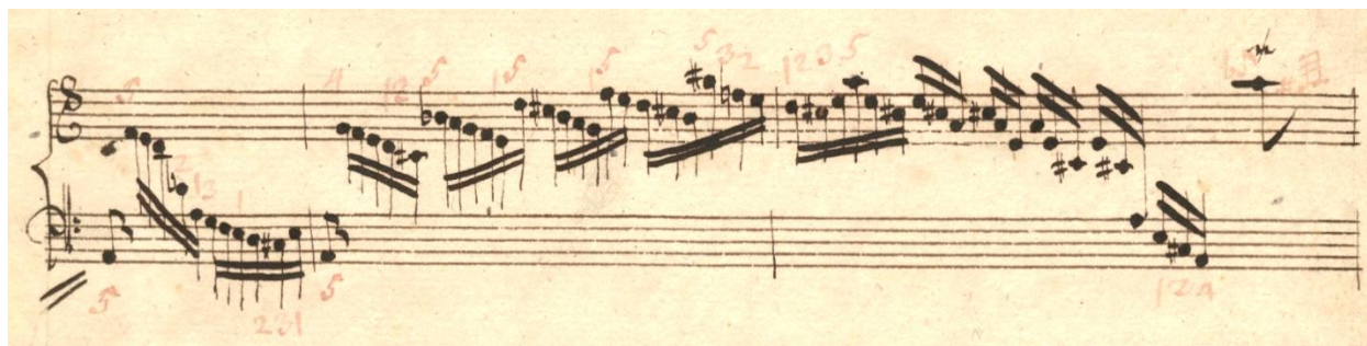
Slika 3.06. AmB 548, t. 18.5-20 21

Neki izvori ponekad predlažu nekoliko rješenja prstometu. U 21. taktu rukopisa P 551 prva varijanta osmišljena je tako da se najviši ton b'' svira petim prstom, a donja četvrtim (slika 3.07). Drugi slučaj je prilično zanimljiv jer četvrtom prstu prethodi peti. To ne predstavlja problem tehničke prirode jer prstomet prati dva različita položaja ruke, uz što je riječ o premetanju duljeg četvrtog prsta preko petog. Ta informacija možda novim položajem ruke zapravo predlaže početak nove geste od najvišeg tona.