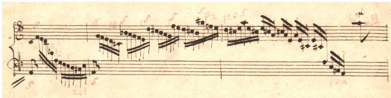
Slika 3.06. AmB 548, t. 18.5-20 21

Neki izvori ponekad predlažu nekoliko rješenja prstometu. U 21. taktu rukopisa P 551 prva varijanta osmišljena je tako da se najviši ton b'' svira petim prstom, a donja četvrtim (slika 3.07). Drugi slučaj je prilično zanimljiv jer četvrtom prstu prethodi peti. To ne predstavlja problem tehničke prirode jer prstomet prati dva različita položaja ruke, uz što je riječ o premetanju duljeg četvrtog prsta preko petog. Ta informacija možda novim položajem ruke zapravo predlaže početak nove geste od najvišeg tona.