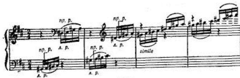
P. I. Čajkovski. Varijacije u f-duru.