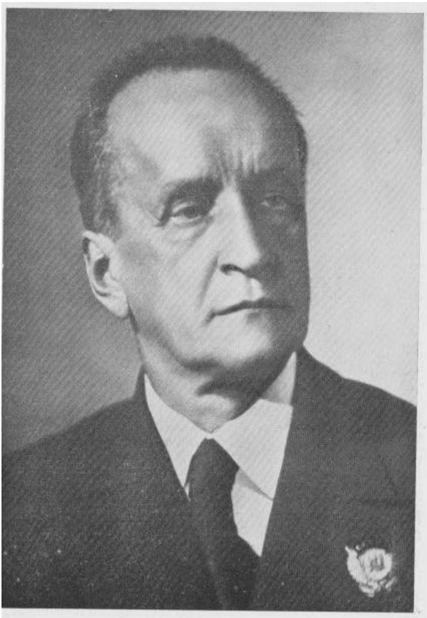
K. N. Igumnov 1937.g.