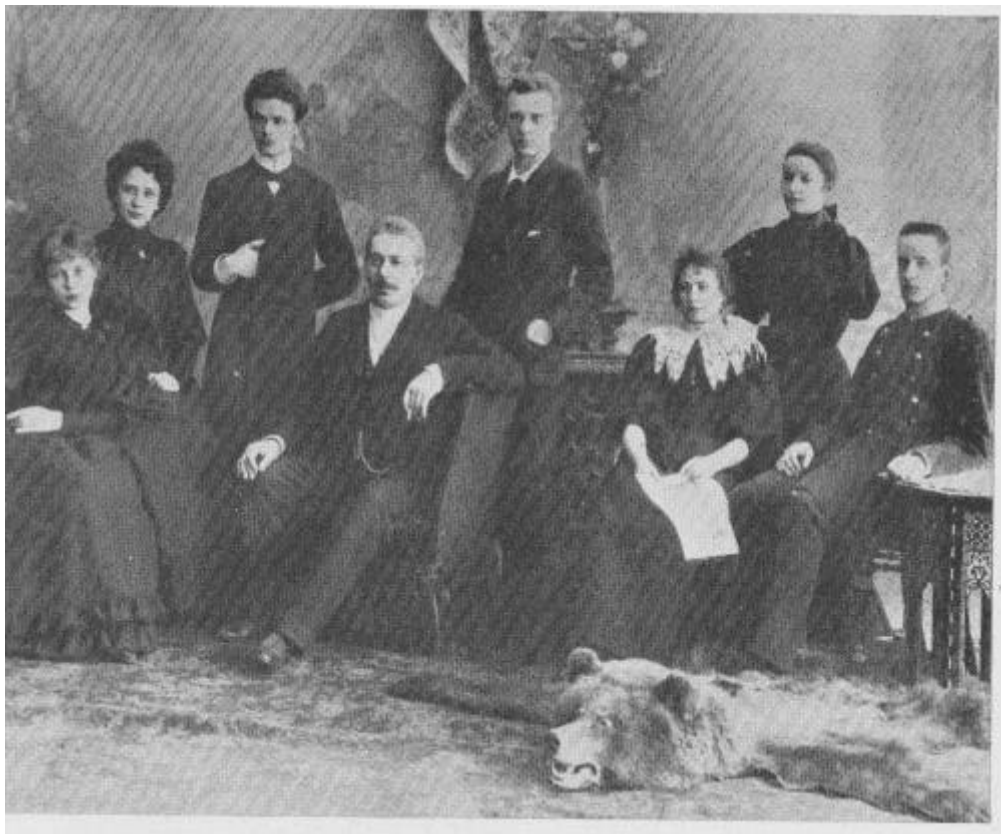
P. A. Pabst sa svojim studentima. S lijeva na desno: