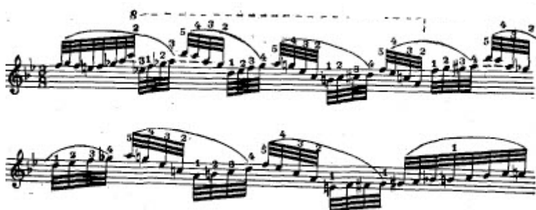
S. V. Rahmanjinov. Preludij u c-molu op. 23.