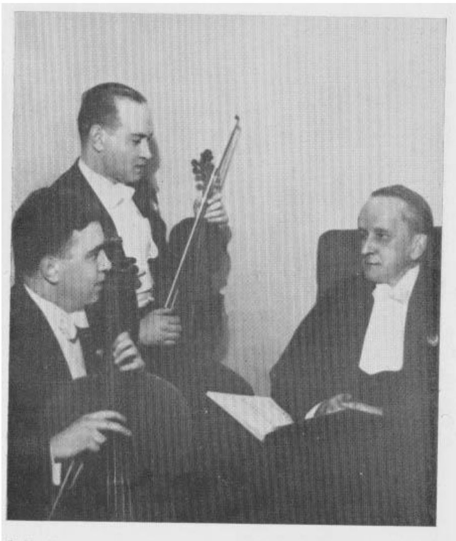
S. N. Knuševitcki , D. F. Oistrach i K. N. Igumnov nakon izvedbe Klavirskog trija Čajkovskog 1939.g.