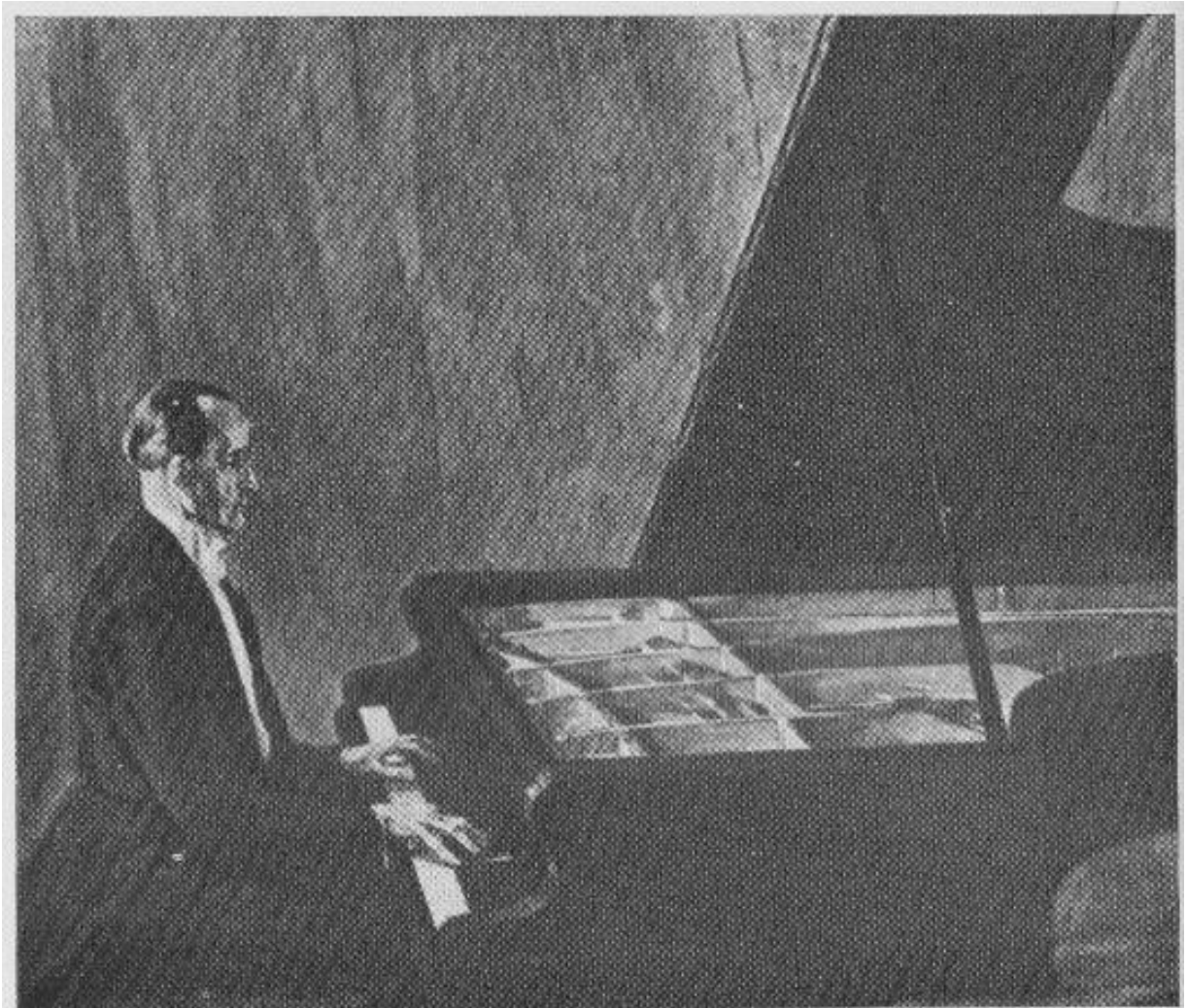
K. N. Igumnov. (P. D. Korin) 1941. - 1943. godine.