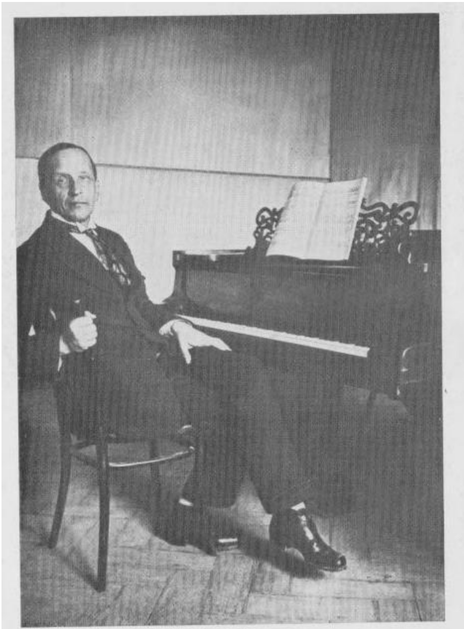
K. N. Igumnov u svojoj učionici na Moskovskom konzervatoriju 1927. g.