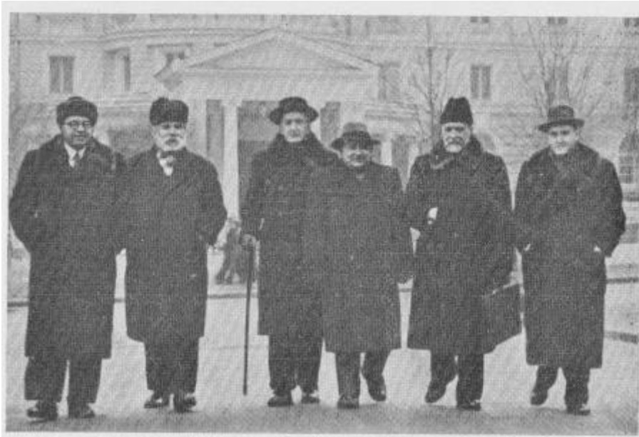
K. N. Igumnov s profesorima Moskovskog konzervatorija u danima 80. obljetnice. S lijeva na desno: L. N. Oborin, A. F. Gedike, K. N. Igumnov, V. J. Šebalin, N. J. Mjaskovski, D. F. Oistrach. 1946. g.