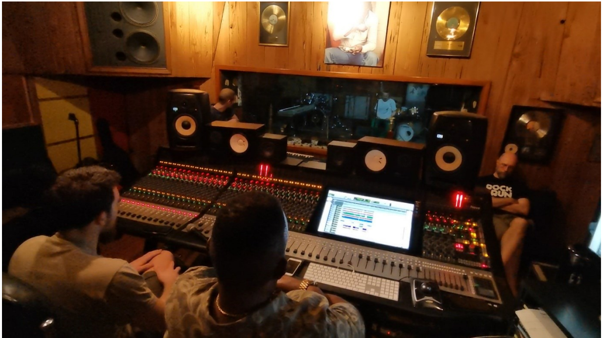
Fotografija 3 – Režija Tuff Gongu (fotografirala: Magda Mas, veljača 2020).

vrećama kako bi funkcionirali kao dodatne velike apsorpcijske površine. Akustički soba nije tretirana na način da oglašuje svaki odjek, već se koristi prirodnim materijalom i nepravilnim oblicima kako bi dio odjeka ipak ostao čujan i prisutan u prostoru. Takvo uređenje prostora, njegova veličina, materijali koji se koriste i odluka o očuvanju prirodnog odjeka prostora čini zvuk Tuff Gongu specifičnim.