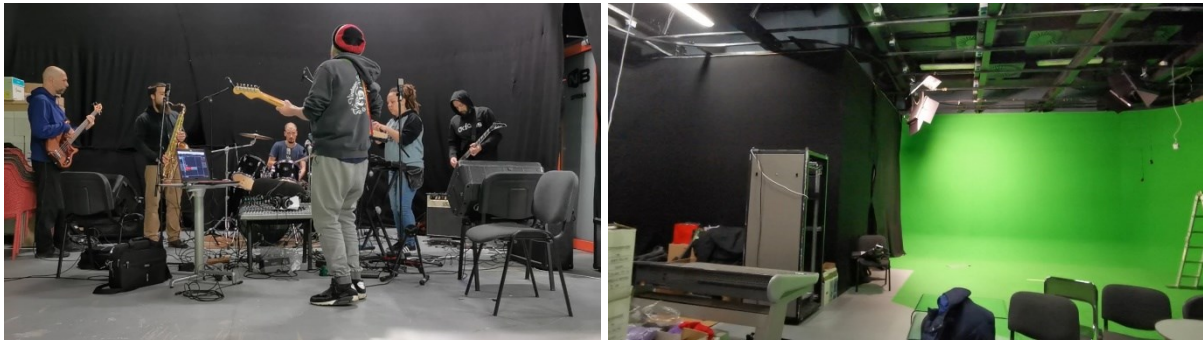
Fotografija 2 a/b – Naš kutak prostorije/green screen (fotografirala: Magda Mas, siječanj 2020).

klavijature. Jedina je iznimka u odnosu na uobičajeni raspored bila u tome što je Gaćina sjedio ispred svih nas, okrenut prema nama zbog kontrole miksete i jednostavnije vizualne i verbalne komunikacije tijekom proba. Svatko od nas imao je dovoljno osobnog prostora, opremu smještenu kako mu najbolje odgovara, slušalice sa dovoljno dugačkim kablom te stolac za odlaganje skripti, akorada, viška odjeće ili za kratki odmor tijekom rasprava.