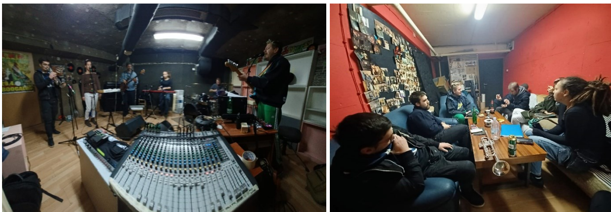
Fotografija 1 a/b – Buksa benda/predsoblje (fotografirao: Dino Mudrić, listopad 2021).