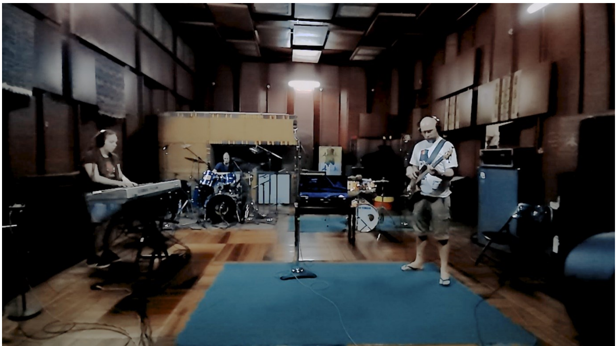
Fotografija 4 – Soba za snimanje u Tuff Gongu (fotografirala: Magda Mas, veljača 2020).