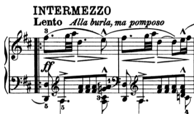
6.6.3 Sonata u fis molu op. 11: Intermezzo

Kako bi Schumann htio postići popmozni karakter vjerujem da je ključ u akcentima na drugi dio treće i četvrte dobe. Istu stvar sam primijetio u Intermezzu trećeg stavka njegove fis mol sonate kod kojega stoji Alla burla, ma pomposo (6.6.3). Akcentima možemo dodatno proširiti prijelaze među taktovima i ostavljati dojam svečanoga.