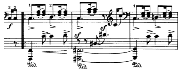
6.6.2 Kreisleriana, br. 8 Schnell und spield

U srednjem, b dijelu, javlja se melodija u srednjem glasu, te ju lijeva ruka ju u kanonu imitira. Potom opet a dio koji modulira iz početnog c mola u As dur zatim u dominantu B dura.