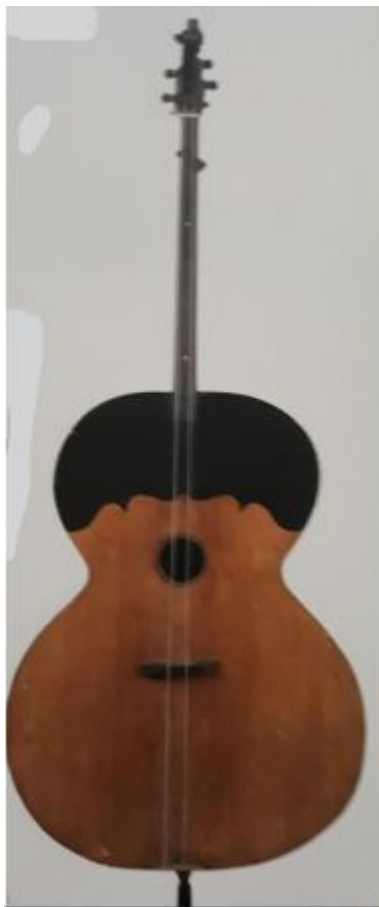
Slika 2: Berde Farkaševog sustava

Slijedeći sustav koji se spominje u literaturi je nazvan Jankovićev sustav . U Zagrebu je troglasne kvintne tambure prvi primijenio Alfons Gutschy početkom 20. stoljeća te je njegov najutjecajniji promicatelj bio Slavko Janković po kome je i sustav dobio ime. Riječ je o sastavu: prva i druga bisernica ( a^2-d^2-g^1 ), treća bisernica (in F; d^2-g^1-c^1 ), prvi, drugi i treći brač ( a^1-d^1-g ), čelović (in F; d^1-g-c ), čelo-brač ( a-d-G ), prva bugarija (in F; g^1-d^1-h ), druga bugarija ( d^1-h-g ) i berde ( Aa-Dd-G ) 7 (slika 3). Gledajući s aspekta tehničkih mogućnosti na berdama ovaj sustav daleko je prihvatljiviji od spomenutog Farkaševog sustava . Samim time što ima tri različite ugođene žice, nudi više tehničkih mogućnosti sviranja. Također, literatura za ovaj sustav kompleksnija je od Farkaševog sustava .