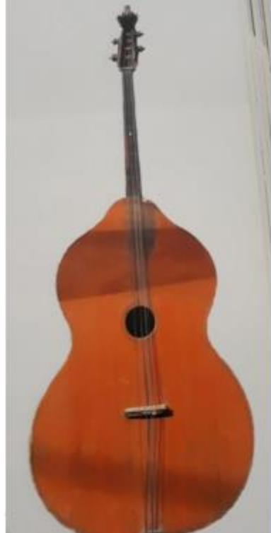
Slika 3: Berde Jankovićevog sustava

Tambure na kojima se danas većinom svira četveroglasnog su kvartnog sustava. Četveroglasni kvartni sustav korijene vuče s početka 20. stoljeća iz Bačke i Srijema, a razvio se iz troglasnoga kvartnog sustava koji se sastojao od dionica prve i druge tambure (obje e^2-h^1-g^1 ), treće i četvrte tambure ( e^1-h-g ), prvog brača ( e^1-cis^1-a ), drugog brača ( e^1-h-gis ) i bas-berda (Ee-Aa). 8 Od tog troglasnoga kvartnog sustava nastao je navedeni četveroglasni kvartni sustav. Ugađao se na dva načina, u e ili u d , te se za taj sustav u narodu zadržao naziv srijemski sustav . Četveroglasni kvartni sustav u e -ugodbi, srijemski sustav , danas je najpopularniji tamburaški sustav u Hrvatskoj, a sastoji se od prve bisernice (prima), druge bisernice (tercprima; obje e^2-h^1-fis^1-cis^1 ), prvoga i drugoga brača (prvog i drugog basprima ili A-brača; oba a^1-e^1-h-fis ), trećeg brača (E-brača; e^1-h-fis-cis ), čela ( a-e-H-Fis ), bugarije E-kontra; e^1-h-gis-e ) i berda (tamburaški bas; A-E-H 1 -Fis 1 ) 9 (slika 4). Na samom instrumentalnom studiju tambure u Zagrebu također se koristi navedeni sustav. U usporedbi s ostalim sustavima, berde su u ovom sustavu