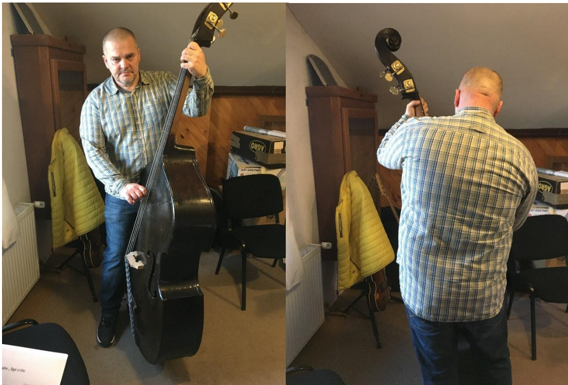
Slika 13: Način pravilnog držanja berda

Vrlo važno za razvijanje bilo kakve tehnike na bilo kojem instrumentu jest pravilno držanje. Berde su specifičan instrument jer su glomazne i samim time se moraju svirati u stojećem položaju. Na početku definiranja pravilnog držanja berda, treba odrediti i visinu instrumenta. Danas, sve više berdaša koristi podešavajuću nogicu za visinu. Nogicu treba po potrebi izvući van ili ugurati unutar berda. Određivanje visine odvija se na način da berdaš stane s bočne strane instrumenta. Pogledom prema hvataljci potrebno je locirati kobilicu 18 koja bi trebala biti u ravnini s obrvama svirača. Nakon što se podesi visina instrumenta, treba prilagoditi tijelo svirača s instrumentom. Pravilno držanje berda bi zahtijevalo stati uz berdu, lijevom nogom nasloniti se na zadnji donji dio lijeve bočnice berda, a desna potkoljenica je uz lagani iskorak naslonjena na desni donji dio bočnice berda uz glasnjaču. Tijelo je vrlo malo nagnuto u desno tako da desna ruka koja drži trzalicu bude u visini struka. Lijeva ruka je u neutralnoj poziciji (ako prsti lijeve ruke ne stižu niti jedno polje) u visini brade (slika 13).