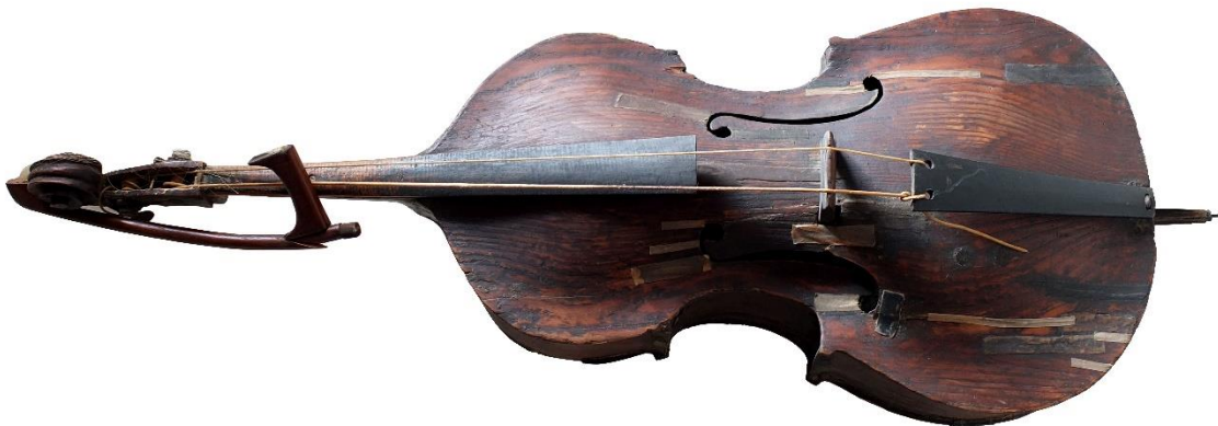
Slika 1: Prikaz dvožičane bajsice

Zbog vrlo raznolikog folkloru u Hrvatskoj, u razvoju današnjih berda svakako bi trebalo spomenuti i instrument bajsica koja se svirala u sastavu koji se nazivaju guci. Guci su skupina glazbenika uobičajena za središnju Hrvatsku u 19. stoljeću, iako postoji mogućnost da su postojali i ranije. U svojem instrumentariju guci su imali jednu do dvije violine (odnosno gusle) od kojih je prva izvodila glavnu melodiju, a druga joj je sučeljavala ili oko nje oplitala sporednu melodiju te trostruni bas (bajs) veličine violončela. 4 Bajsica je kordofono narodno glazbalo na kojem se ton proizvodi kraćim gudalom (slika 1). Ima dvije ili tri žice od goveđih crijeva ugođene u kvintama.