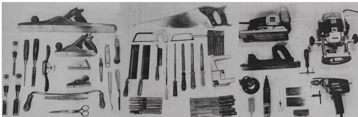
Slika 6: Prikaz alata za izradu berde

Najbolji kalupi za izradu tambura su od metala. Nažalost, takvi kalupi su previše skupi te majstori glazbalari najčešće sami sebi izrađuju kalupe od različitih vrsta drveta. Postoje dvije vrste kalupa: kalup iz tri dijela i kalup iz jednog dijela. Debljina kalupa mora biti oko dvadeset milimetara manja od debljine zvučne kutije berda da bi se mogle staviti stege duž ruba bočnih stranica kada se lijepi rubna letvica. Kalup iz tri dijela sastoji se od osnovne ploče, vanjskog okvira i unutrašnjeg bloka. Osnovna ploča izrađuje se od panel ploče 11 debljine od osamnaest do dvadeset milimetara i u obliku je zvučne kutije. Na osnovnoj ploči nalazi se i produžetak za vrat instrumenta kako bi se vrat mogao točno pozicionirati prilikom lijepljenja za prednji panj. Kalup iz jednog dijela sastoji se samo od unutrašnjeg bloka. S ovakvom vrstom kalupa postoji mogućnost da nastane deformacija bočnih strana te danas majstori većinom koriste kalupe iz tri dijela.