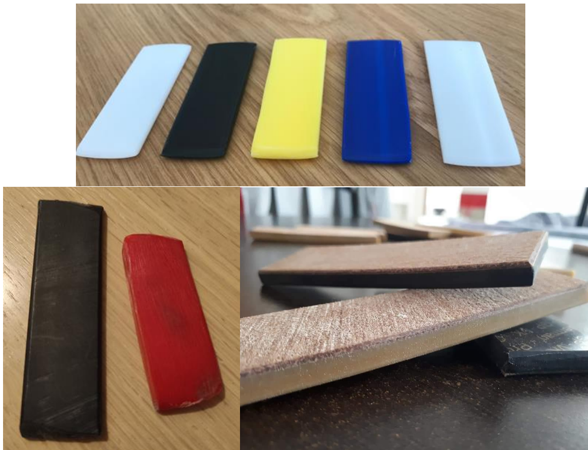
Slika 11: Različite vrste trzalica

Dimenzije trzalica danas su različitih debljina i dužina ovisno o materijalu (slika 11). Plastične trzalice su debljine oko četiri do četiri i pol milimetra dok su kožne i takozvane sendvič trzalice i do pet milimetara. Dužine trzalice variraju od osamdeset do sto milimetara.