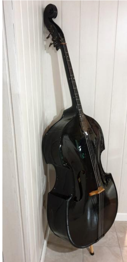
Slika 12: Usporedba kontrabasa i berda