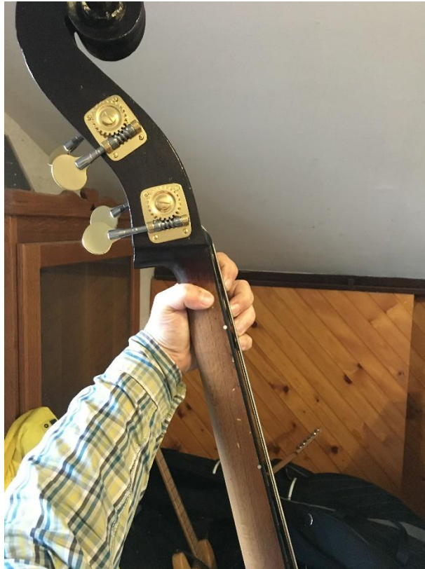
Slika 14: Postava lijeve ruke

Nadalje, položaj lijeve ruke odredit će njezina aktivnost. Bit lijeve ruke, to jest lijeve šake je da obuhvati vrat instrumenta ovisno o poziciji i položaju sviranja zadanih tonova. Palac lijeve ruke mora biti postavljen s bliže strane vrata instrumenta dok su ostala četiri prsta postavljena na žicama (slika 14). Vrlo bitno je napomenuti da je lijeva ruka ovisna o širini i dubini vrata instrumenta.