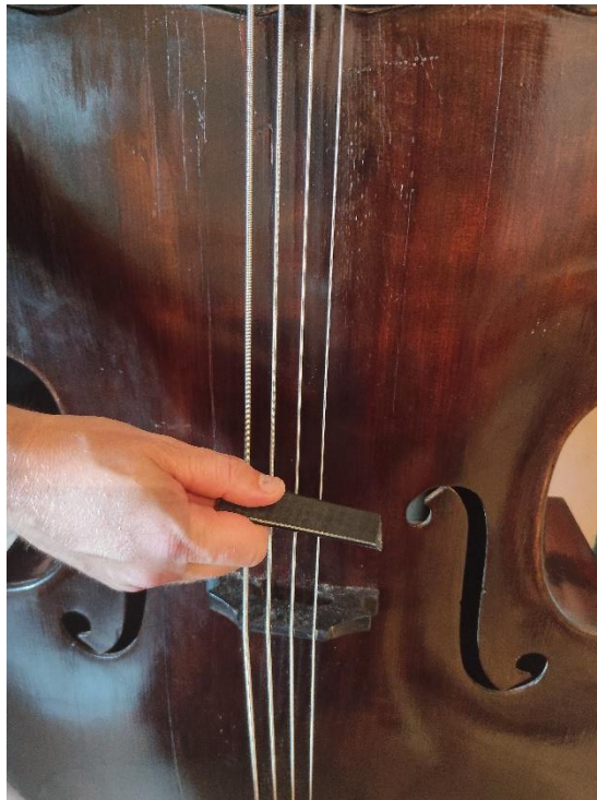
Slika 17: Prikaz postave za slapping

Gledajući kontrabasističku i basgitarističku tehniku, na berdama se mogu izvesti još neke rijetko korištene tehnike. Popping označava čupkanje žica kažiprstom ili srednjakom desne ruke. Ovom tehnikom proizvodimo glasne i perkusivne tonove jer žica udari u pragove na hvataljci. Slapping označava šamaranje žice, a tehnika predstavlja jaki udarac palca desne ruke u žicu. Drugi i puno češći način dobivanja ove tehnike je postava trzalice horizontalno na žicu, ali se ona primi na lagano na samom kraju palcem i kažiprstom desne ruke (slika 17). Ovu tehniku sviranja moguće je izvesti jedino s duljom i tvrdom trzalicom.