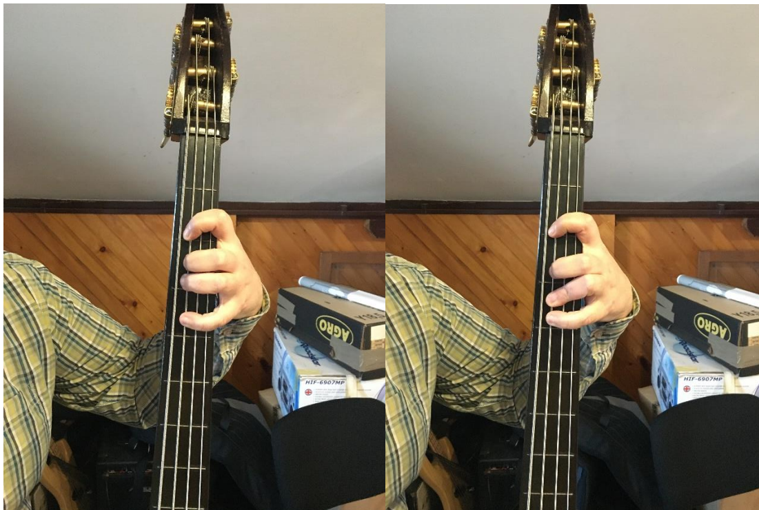
Slika 16: Vrste prstometa na berdetu

da i svaki prst svira svoje polje. Sve u svemu, trenutno ne postoji napisano pravilo za prstomet na berdama. Prstomet ovisi i o debljinama žica, tvrdoći instrumenta, ali i fizičkoj građi svirača.