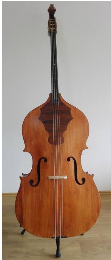
Slika 4: Današnje berde

četveroglasne kao i ostali instrumentarij. Shodno tome, ali i ugodbi žica slično kontrabasu, tehničke, dinamičke i agogičke mogućnosti gotovo su ravnopravne melodijskim instrumentima (bisernici i braču). Gledajući današnju literaturu za tamburaške orkestre, mnogi skladatelji smatraju mogućnosti berda jednakima kao i kontrabasističkim. Usprkos tome, razvoj samih svirača ovisi i o majstorima glazbalarima koji rijetko grade berde po ukusu svirača.