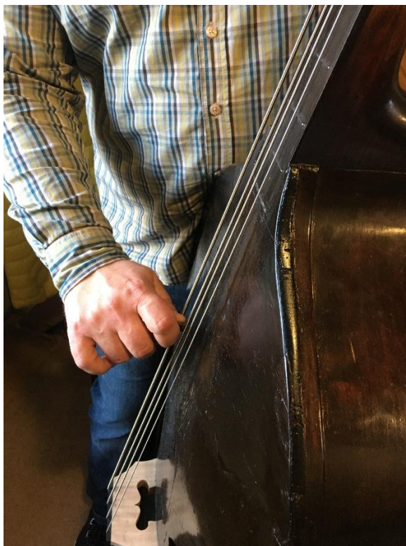
Slika 15: Postava desne ruke

U današnjoj praksi vrlo su česti slučajevi da je berdaš previsok ili prenizak u odnosu na instrument. Jedan od čestih razloga je što se nogica na berdama ne može podesiti. U takvim slučajevima je vrlo teško primijeniti opisano držanje instrumenta, a svirač si sam prilagođava postavu instrumenta. Nerijetko je u današnjici situacija da svirači istegnu lijevu ruku prema kobilici i s njom kompenziraju previsok instrument. U obrnutoj situaciji, svirači često sviraju u nepravilnom položaju, što rezultira čestim bolovima u leđima.