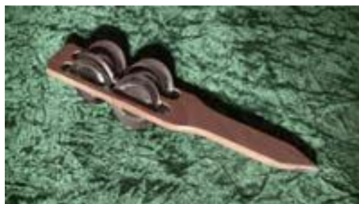
Slika 10: Trzalica zvečka

Kako bi se na tamburi formirao ton, potrebno je žicu dovesti u stanje treperenja. Stoga se koristi TRZALICA (PERO, TERZIJAN, PLEKTRUM), koju su graditelji tambure pravili od kore drveta (višnje, šljive), guščjeg pera, govedskog roga, celuloida, a u zadnje vrijeme i plastičnih masa. 17 Od samog nastanka tambure, a samim time i berda, one su se svirale s nekom vrstom trzalice. U samom razvoju instrumenta, berde su se svirale i s trzalicom koja se nazivala zvečka (slika 10), a s kojom su svirali i kontrabasisti pripadnici romske zajednice. Zvečka je trzalica rađena od komada drveta s prorezom na kojem su se nalazili praporci. Uz dobivanje samog tona na berdama, pomoću praporaka dobio se i efekt perkusija. Danas se kod berdaša susreću trzalice različitog materijala i dimenzija.