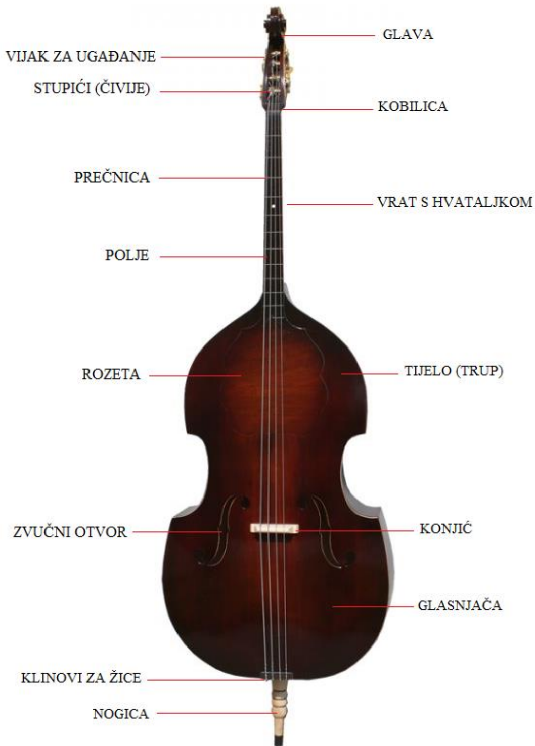
Slika 8: Prikaz dijelova berda