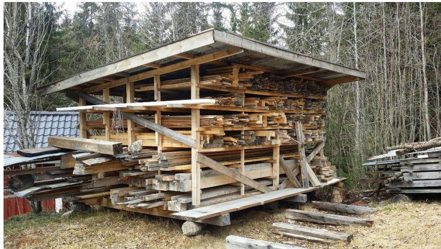
Slika 5: Prikaz sušenja drveta

Prije samog početka gradnje berda, potrebno je izabrati drvo. Za izradu berda koristi se nekoliko vrsta drveta. Za vrat, stranice i leđa majstori najčešće koriste javor, rebrasti ili obični. Za glasnjaču se koristi rezonantna smreka, a za hvataljku se najčešće upotrebljava ebanovina. Prije same uporabe navedenog drveta ono se najčešće suši u prozračnoj hali ili sličnoj vrsti objekta (slika 5) minimalno deset godina. „Trebalo razlikovati drvo koje je CEPANO i drvo koje je REZANO. Cepano drvo je mnogo bolje jer su njegova vlakna čitava cijelom dužinom daske, dok je rezano drvo sigurno s presječenim tj. sa skraćenim vlaknima.“ 10