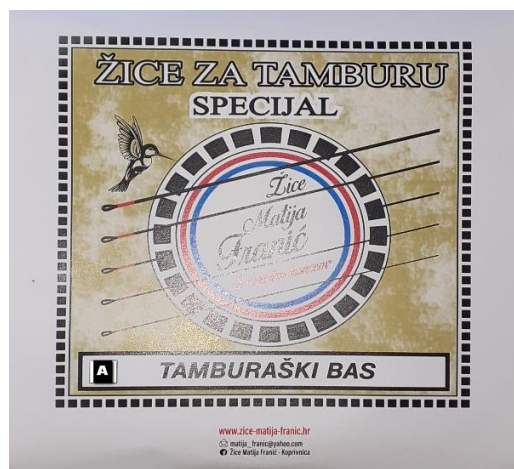
Slika 9: Žice za berde