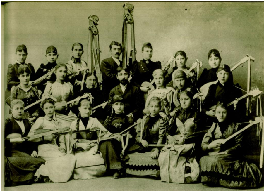
Slika 8: Ženski tamburaški orkestar

Zbog razvitka društvene djelatnosti 1890. godine se osniva ženska tamburaška škola, a uz to i muška pjevačka škola te je ista godina vrlo značajna. Tamburašku školu pohađalo je 25 učenika i 19 učenica, dok je u sastavu orkestra bilo 18 svirača na tamburama. Te godine tamburaški zbor sudjeluje na mnogim koncertima pa tako 13. srpnja izvode skladbe skladatelja Bosiljevca „Hrvatska koračnica“ i Farkaševu skladbu „Uspomena na Slavjanskoga“. (Zeininger, 1892: 253 – 255).