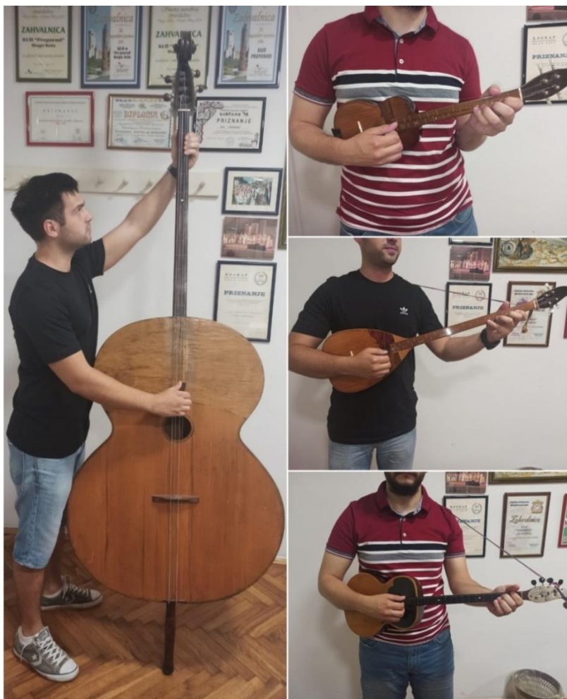
Slika 17: Držanje tambura Farkaševog sustava

Ono što je zanimljivo, a posve drugačije nego držanje tambure danas, je to što se kod Farkaševog sustava desna ruka trebala držati bliže vratu tambure, dok se na današnjim tamburama desna ruka drži paralelno s glasnjačom. Isto tako, Farkaš upućuje da se kod sviranja berde, berdu treba nagnuti prema lijevoj strani.