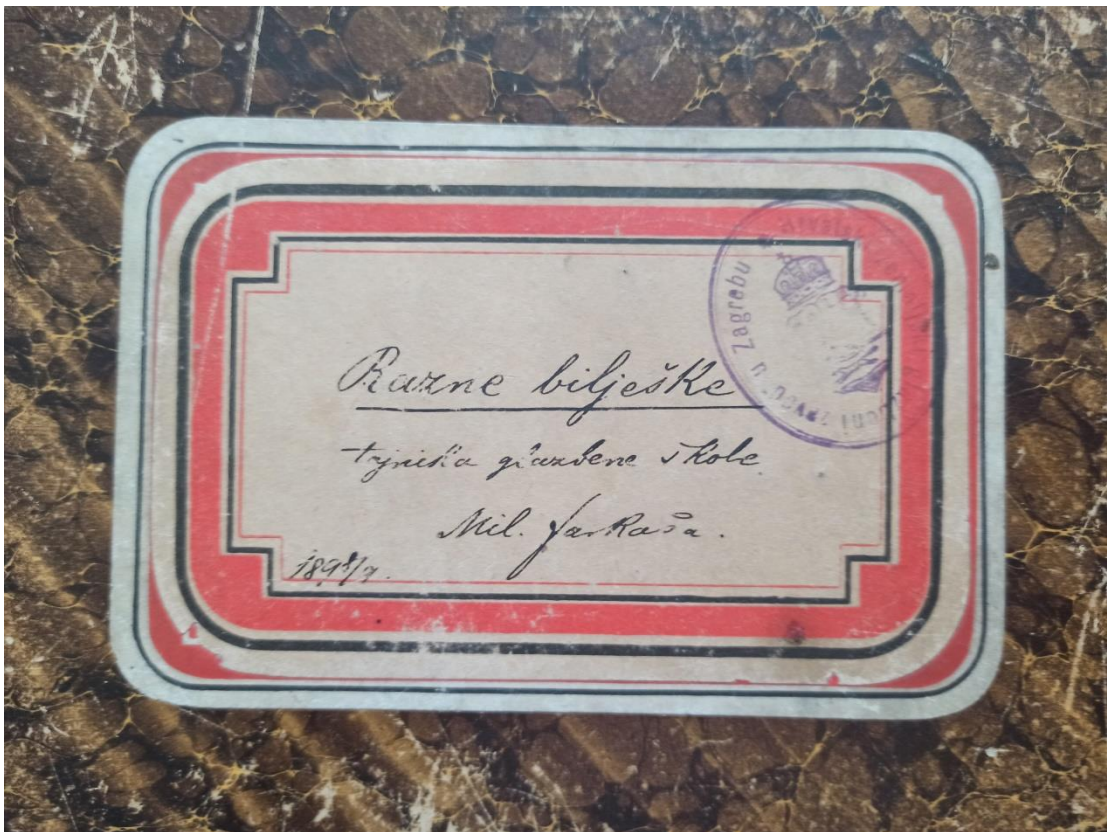
Slika 9: Naslovna strana bilježnice tajnika Milutina Farkaša (fotografirano u prostorima Hrvatskog glazbenog zavoda)

Na kraju je važno istaknuti kako je Farkaš bio i tajnik Hrvatskog glazbenog zavoda, ustanove koja također posjeduje dio njegove ostavštine. S obzirom na to u sklopu istraživanja za ovaj rad, posjećen je Hrvatski glazbeni zavod s nadom da će se tamo pronaći neke knjige i zanimljivosti o njegovom radu. Međutim, na uvid je dobivena samo bilježnica iz 1897./1898. na kojoj piše „Razne bilješke tajnika glazbene škole Mil. Farkaša“. Proučavajući ove bilješke, nije se naišlo na korisne informacije jer se u bilježnici nalazio uglavnom popis učenika koji su izostajali s nastave, dobili karte za razne predstave i drugo.