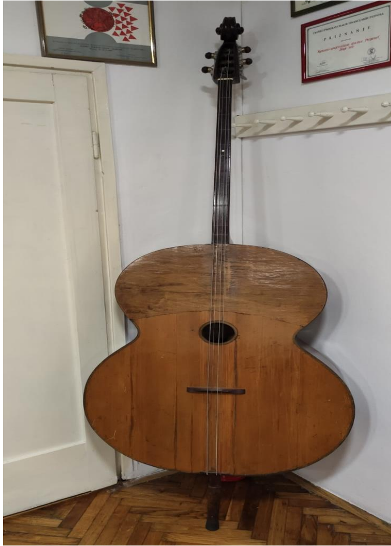
Slika 4: Berde Farkaševog sustava u vlasništvu KUD-a „Preporod“, Dugo Selo

(fotografirano u prostoru KUD-a „Preporod“, Dugo Selo)