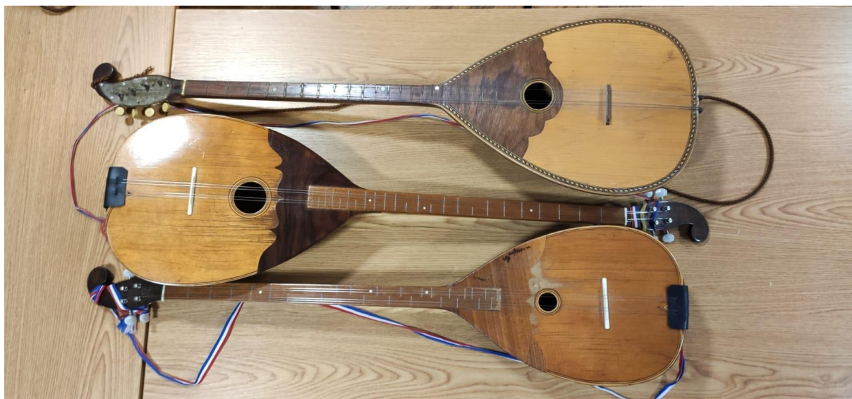
Slika 2: Bračevi Farkaševog sustava u vlasništvu KUD-a „Preporod“, Dugo Selo (fotografirano u prostoru KUD-a „Preporod“, Dugo Selo)

kromatsko – dijatonski na isti način kao i bisernice. (Ferić, 2011: 47). Farkaš tvrdi da je on najpotrebnije glazbalo tamburaškog zbora/orkestra, a zbog svog tona koji nije tako intenzivan kao kod bisernice, može izvoditi solo dijelove skladbe u orkestru ili nekom sastavu poput kvarteta. Također, može izvoditi cijelo djelo solo uz pratnju nekog drugog glazbala, npr. klavira. U većem sastavu često izvodi isto što i bisernica samo oktavu dublje s time da mu lijepo leže tužne i sentimentalne popijevke zbog kvalitete tona. (Farkaš, 1911: 41). Drugi i treći brač također su kruškolikog oblika, a sviraju prateću melodiju prvom braču pa se time dobiva troglasje u svirci. Imaju proširen opseg od kvinte u odnosu na prvi brač. Ugođeni su kromatski tako da se na prve dvije žice svira kromatski tonovi D – dur ljestvice, a na druge dvije žice kromatski tonovi G – dur ljestvice. (Ferić, 2011: 48). Treći brač nešto je veći od drugog i on najčešće svira tercu ili sekstu naspram prvog brača. Drugi i treći brač potrebni su tamburaškom orkestru zbog svojih naizmjeničnih sviranja raznih figura i glazbenih sastavnica poput uklona i modulacija tvoreći zajedno s prvim bračem razne harmonije i suzvučja. (Farkaš, 1911: 47).