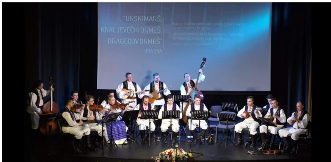
Slika 18: KUD „Preporod“ na Farkašijadi

Uz društva iz Adamovca i Dugog Sela koji se mogu smatrati glavnim održavateljima prakse sviranja tambura farkašica i mnoga druga društva u Hrvatskoj obnovila su tu praksu, pa će ih se u nastavku nabrojati.