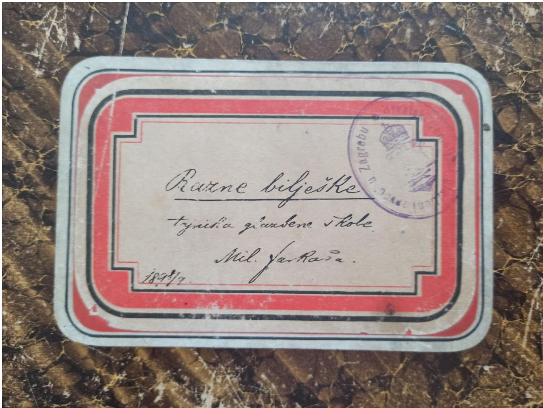
Slika 9: Naslovna strana bilježnice tajnika Milutina Farkaša (fotografirano u prostorima Hrvatskog glazbenog zavoda)

Na kraju je važno istaknuti kako je Farkaš bio i tajnik Hrvatskog glazbenog zavoda, ustanove koja također posjeduje dio njegove ostavštine. S obzirom na to u sklopu istraživanja za ovaj rad, posjećen je Hrvatski glazbeni zavod s nadom da će se tamo pronaći neke knjige i zanimljivosti o njegovom radu. Međutim, na uvid je dobivena samo bilježnica iz 1897./1898. na kojoj piše „Razne bilješke tajnika glazbene škole Mil. Farkaša“. Proučavajući ove bilješke, nije se naišlo na korisne informacije jer se u bilježnici nalazio uglavnom popis učenika koji su izostajali s nastave, dobili karte za razne predstave i drugo.