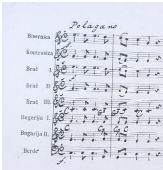
Slika 16: Prikaz partiture za Farkašev sustav