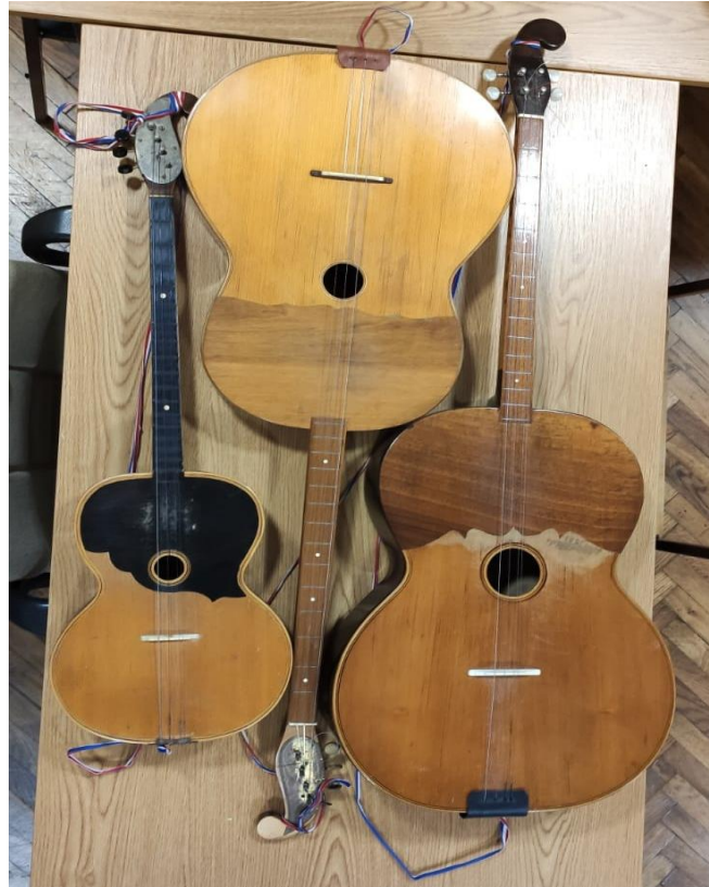
Slika 3: Bugarije Farkaševog sustava u vlasništvu KUD-a „Preporod“, Dugo Selo

(fotografirano u prostoru KUD-a „Preporod“, Dugo Selo)