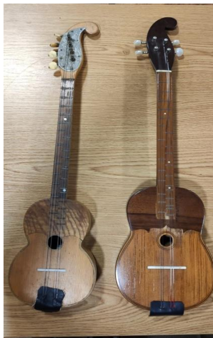
Slika 1: Bisernice Farkaševog sustava u vlasništvu KUD-a „Preporod“, Dugo Selo (fotografirano u prostoru KUD-a „Preporod“, Dugo Selo)

Bisernica (primašica) ima u orkestru funkciju jednog od najpotrebnijih glazbala, a zbog svog intenzivnog zvuka Farkaš smatra da je njezina uloga svirati vesele i živahne narodne koračnice i plesove, tj. da ona nije za sviranje solo fragmenata i sentimentalnih popijevaka. Zadatak osobe koja svira bisernicu je taj da svira što čišće te da pazi na svu dinamiku zapisanu u notama baš zato što izvodi glavnu melodiju. Ima istu funkciju kao prva violina u gudačkom sastavu. (Farkaš, 1911: 32). Razlike između bisernice i kontrašice (druge bisernice) u načinu sviranja nema. Prema Farkašu: „Kaže se da tko zna svirati bisernicu, mora znati i kontrašicu“. Kontrašica svira najčešće melodiju bisernice prateći ju za tercu niže, a njezina je uloga ista kao kod druge violine u gudačkom sastavu/orkestru. Farkaš tvrdi da bez kontrašice orkestar nije pun te da se bez nje osjeti praznina u cijelom harmonijskom suzvučju. (Farkaš, 1911: 39).