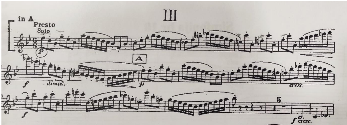
Notni primjer 4.7. Dmitrij Šostakovič: Simfonija IX, treći stavak t.1-17

Simfonija br. 11 donijela mu je i Lenjinovu nagradu za izvrsnost 1958. godine. Umro je 1975. godine od zatajenja srca.