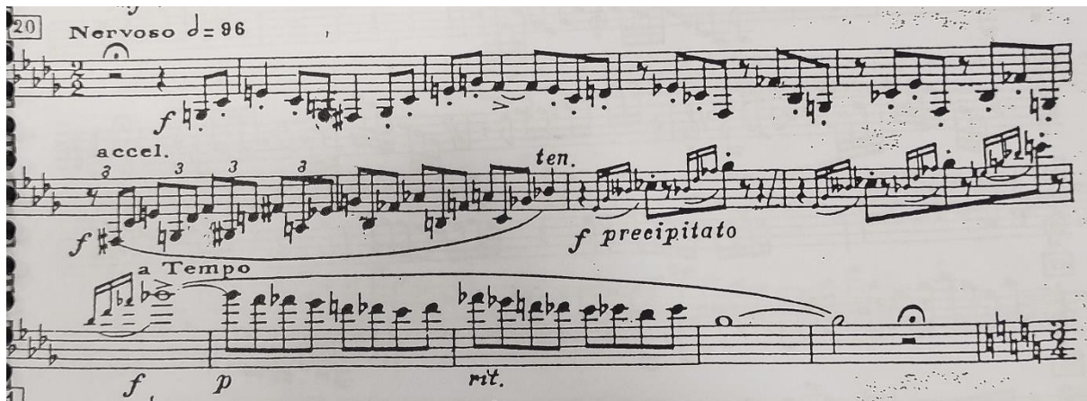
Notni primjer 4.5. Sergei Prokofiev: Petar i vuk, br.20: t.1-14

Svaki lik u ovoj simfonijskoj bajci oponaša jedan od instrumenata ili sekcija u orkestru. Flauta predstavlja pticu, oboa patku, klarinet mačka, fagot Petrovog djeda, tri horne vuka te gudači predstavljaju Petra. Klarinet u solu koji započinje u broju 20 prikazuje mačkov bijeg od vuka. Mačak u početku nervozno kruži oko drva tražeći mjesto kuda će se popeti. Kandžama se uspinje preko debla do prvih grana (triole), zatim skače s grane na granu sve do vrha samo kako bi se onda pretvarao da uopće nije nervozan.