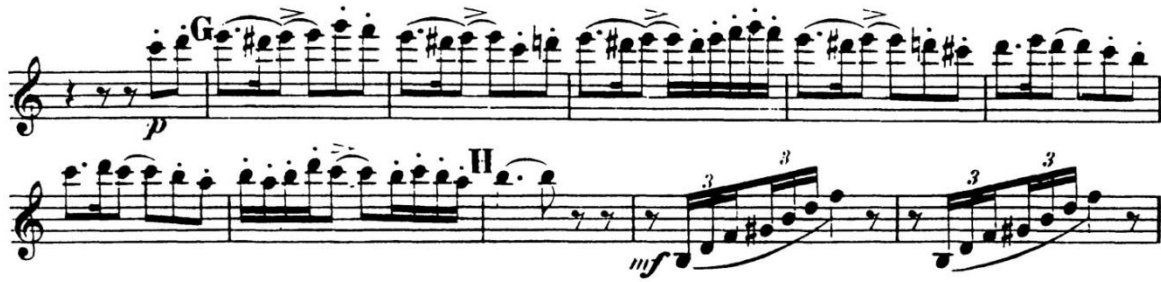
Notni primjer 4.6.c Nikolaj-Rimski Korsakov: Šeherezada, treći stavak t.107-115

Na audiciji ovaj solo treba svirati u ppp dinamici. Konstantna potpora dijafragme i čvrsta ambažura olakšat će sve atake i prijelaze između registara. Pozornost treba obratiti na akcente i kratkoću artikulacije. U slovu G je najteži dio sola koji je u p dinamici stoga komisija na audiciji prati koliko kandidat može nježno i jasno artikulirati i kontrolirati visine. Ne smije se žuriti preko šesnaestinke dis_3 i treba pronaći siguran prstomet za g_3 koji izlazi lagano, nježno i štima. Predlažem prepuhani h_2 . Iako nizak kada se svira u sporom tempu, u brzini se to ne čuje i puno jednostavnije izlazi od ostalih prstometa. Za lakšu artikulaciju d_3 , može se koristiti njemački prstomet (otvoreni palac, a ostatak lijeve ruke poklopljen skroz te kažiprst, prstanjak i es-klapna desne ruke). Ako je taj nezgodan, prstomet za d_3 iz prvog stavka Beethovenove šeste simfonije ( cis_3 + gis_1 klapna) dobra je opcija. Tempo ovog stavka varira od dirigenta do dirigenta. Solo treba pripremiti i u sporijem i bržem tempu kako bi se u slučaju da komisija traži određeni tempo, bilo spremno na sve. Na audiciji je najbolje svirati u umjerenom tempu, ni prebrzo ni presporo, ali malo brži tempo je sigurno lakše izvediva varijanta.