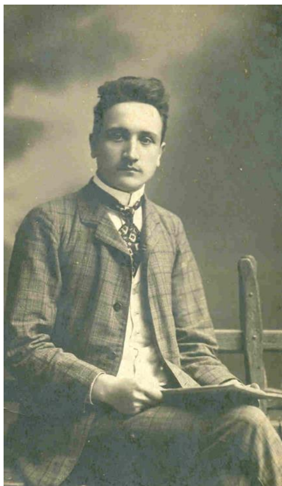
Slika 1. Franjo Lučić kao student.

S predavanja Pavla Mašića o Lučićevim orguljaškim skladbama u sklopu Lučićevih dana , crkva Navještenja Blažene Djevice Marije, Velika Gorica, 24. ožujka 2021.