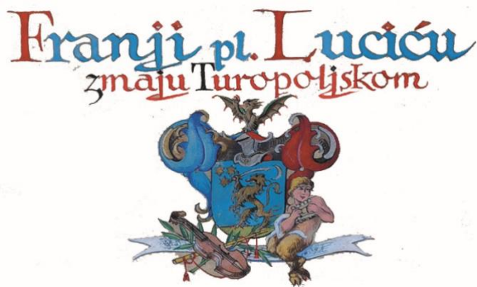
Slika 6. Zmajski grb Franje pl. Lučića

Godine 1919. Lučić postaje utemeljiteljnim članom Družbe Braće Hrvatskog Zmaja s matičnim brojem 270. Kasnije, 1927., izabran je za redovitog člana imenom Zmaj Turopoljski, a 1930. izabran je u Meštarski zbor u časti Meštra zabave i glazbe, u čijem je sastavu bio do 1934. Družba Braće Hrvatskog Zmaja bavi se čuvanjem i