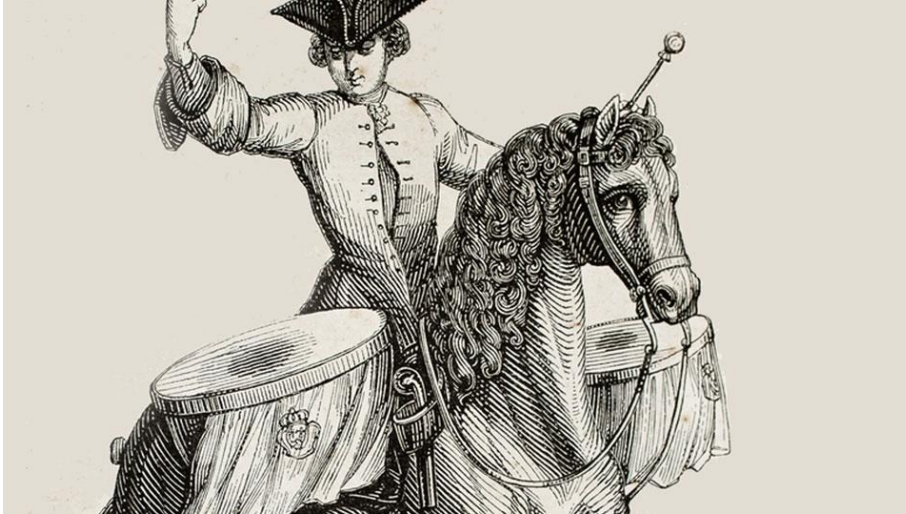
Slika 1. Naker koji se koristi u vojne svrhe

Tijekom 15. i 16. stoljeća vladari i kraljevi zapošljavaju prve timpaniste na dvorovima. Godine 1675. Jean Baptiste Lully napisao je operu Thesee u koju uvodi timpane naštimate na C i G. Nakon njega skladatelji sve češće uvode timpane u svoje skladbe. U 19. stoljeću Ludwig van Beethoven koristi timpane kao melodijski instrument. Timpani sviraju akorde ili imaju solo odlomke poput onih u Devetoj simfoniji .