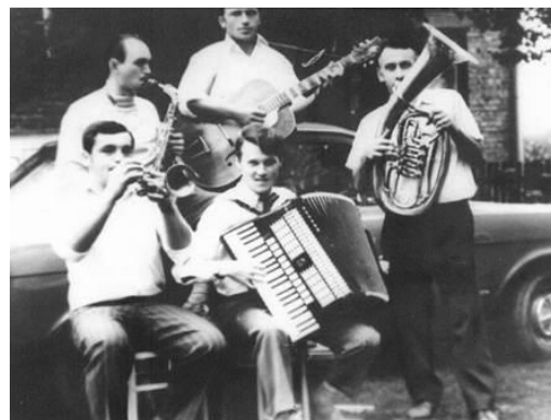
Slika 4. „Veseli kvintet“ (1968.) 10