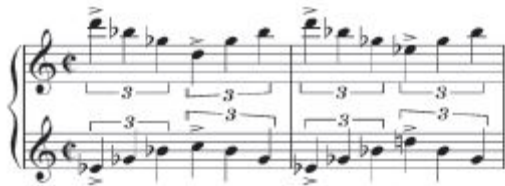
Slika 3.3.3.b. Vrtoglavica – „Hitchcockov akord“ u obliku linearnog dvoglasja 37

Film Vrtoglavica donosi opet Hermannovo eksperimentiranje s akordom terce, no ovaj put je riječ o dvije melodijske linije u protupomaku, koje međutim u „zbroju“ ne čine nikakvo tonalitetno uporište. Ne treba smetnuti s uma da poznata scena pred kraj filma, kad se glavnom muškom liku, koji pati od vrtoglavice, čini da gubi tlo pod nogama i da pada u bezdan – da je autor te scene Salvador Dali, jedno od prvih imena nadrealizma.