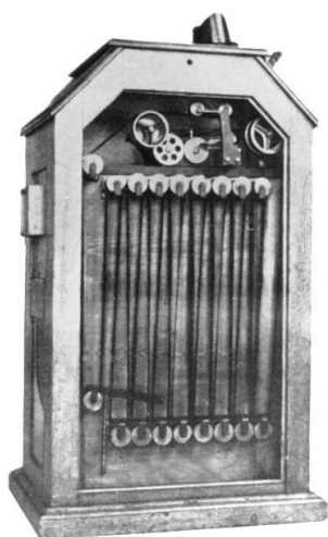
Slika I. 3.4.a. Kinetoskop 63

očevidno, nakon spoznaje, učiniti još tri pothvata: stvoriti podlogu (filmsku vrpču) koja će moći primiti niz brzih snimaka jednu za drugom, takav, ondašnjim jezikom, fotografski aparat (filmsku kameru) koji će biti pogodan za snimanje takvom vrpcom i specijalnu napravu (projektor) koja će rezultat snimanja prenijeti gledatelju. 62 Kasnije će filmsku vrpču George Eastman, inače osnivač tvrtke Eastman Kodak i pionir popularne fotografije i filma, zamijeniti elastičnom celuloidnom vrpcom. Potom je William Kennedy Laurie Dickson na poticaj Thomasa Edisona (tvorca fonografa) stvorio kinetoskop, prvo kino , odnosno uređaj za prikazivanje filmova.