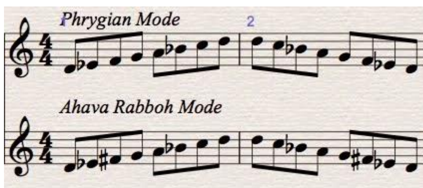
Slika 3. notni primjer Ahava Rabboh modusa.

Ahava Rabboh modus često se naziva i dominantni frigijski jer se nalazi na V. stupnju harmonijske mol ljestvice, a u sebi sadrži sniženi II. i VI. stupanj. Zsigurno je najpoznatija židovska folklorna pjesma u ovom modusu „Hava Nagila“. Vrlo je slična frigijskom modusu, ali sadrži veliku tercu.