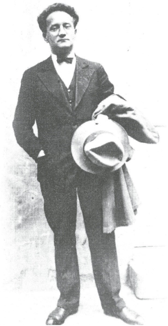
Slika 1: Josip Štolcer Slavenski

Josip Štolcer Slavenski rođen je pred kraj 19. stoljeća, točnije 11. svibnja 1896. u Čakovcu. Ondje je njegov otac Josip radio kao pekar, a u Čakovec se doselio iz zagorskog gradića Zlatara. No korijeni Štolcera Slavenskog sežu sve do njemačkog grada Frankfurta na Majni odakle preko Slovenije u Hrvatsko zagorje doseljuje kompozitorov pradjed. Josip Štolcer Slavenski uz oca je izučio pekarski zanat, a to će mu znanje kasnije pripomoći kako bi financijski pridonio svom školovanju (osobito tijekom studija u Budimpešti). Osim