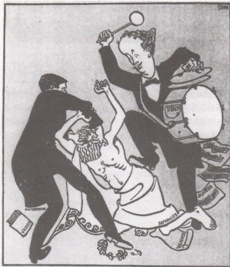
Ein furchtbares Paar. Wen der erste — „bearbeitet“ hat, den „vertont“ sofort der zweite!

Nije izostalo ni izrugivanje nekih novinara, uglavnom na račun veličine orkestra koji je na premijeri bio sastavljen od 107 instrumentalista. Jedna karikatura je prikazivala publiku naguranu u rupu za orkestar, dok je orkestar zauzimaostatak teatra. Također, bez kritika nije prošla ni disonantna i bitonalitetna 40 glazba te opere. Tako je jedan novinar tvrdio da je na izvedbi u Dresdenu pola orkestra sviralo Salome , a druga polovica Elektru , a da publika to nije primijetila. Strauss je sve te kritike prihvaćao s humorom. 41