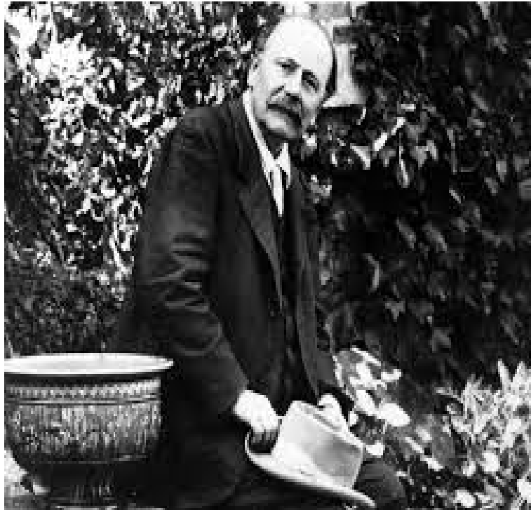
Slika 3: Jules Massenet u svom vrtu u kući u Port – de – l'Arche