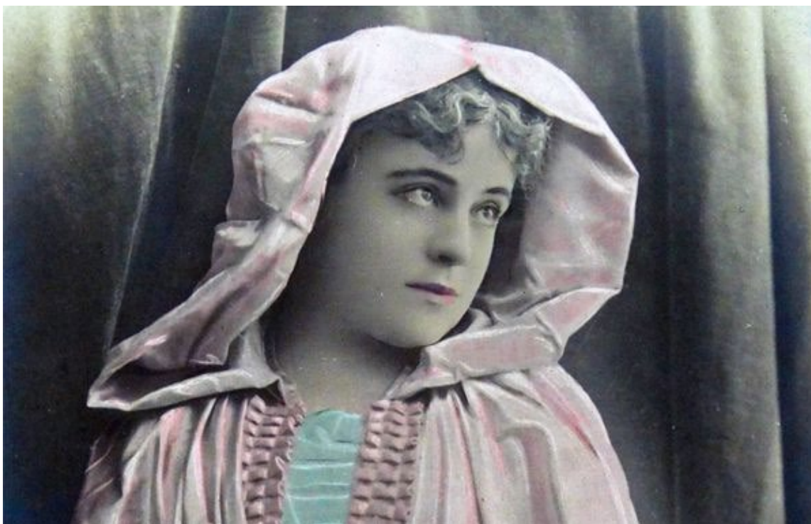
Slika 4: Portret sopranistice Sybil Sanders ( 1865. – 1903. )