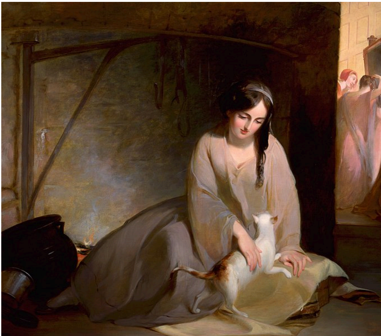
Slika 1: Pepeljuga kod kuhinjskog ognjišta, Thomas Sully, 1843., ulje na platnu.

U ovom radu pokušat ću prikazati da likovi opere nisu crno/bijeli kao u bajci, nego svi u sebi nose i svjetlo i tamu. Dat ću svoj pogled na likove, njihove karaktere i glasovnu interpretaciju. Detaljno ću objasniti korijene bajke, jer je vrlo bitno vidjeti kako su književnost i opera isprepleteni više no što na prvi pogled shvaćamo. Smatram da je važno duboko shvatiti povezanost dvije umjetničke vrste kako bismo mogli sagledati cjelovitu sliku. Željela bih približiti ovu operu jer zaista smatram da je djelo na kojemu studenti mogu puno naučiti, djelo u kojem publika i izvođači uistinu mogu uživati.