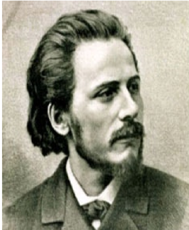
Slika 2: Jules Massenet u mladosti 1

Prvu profesionalnu priliku za skladateljski posao dobio je 1867. godine kada mu Opera - Comique u Parizu nudi skladanje jednočinke Le grande tante . Godinu dana nakon toga, bračni par je dobio svoje jedino dijete, kćer Juliette. Iste godine upoznaje izdavača i novinara Georgesa Hartmanna koji mu pomaže u karijeri idućih 25 godina.