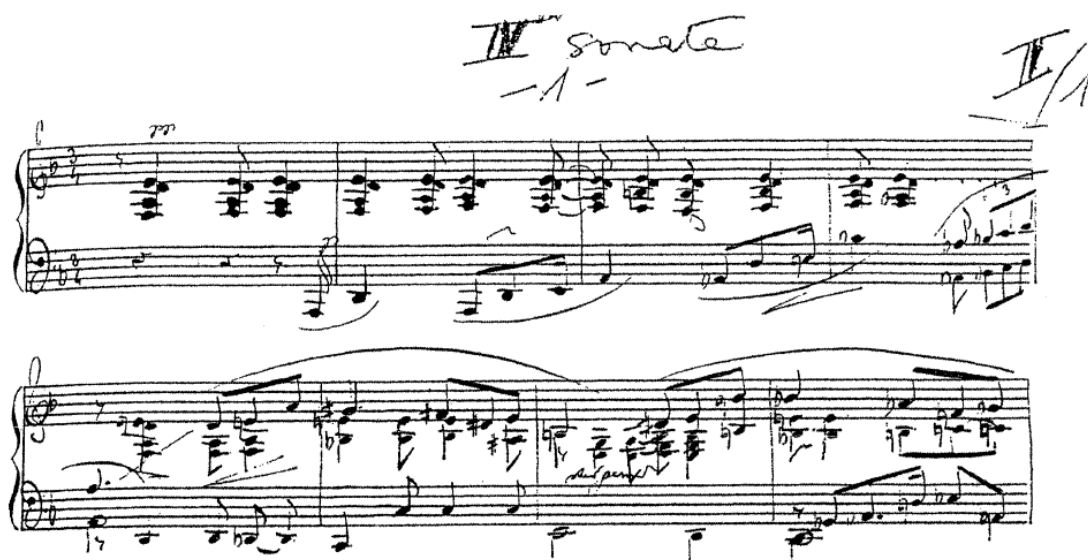
Primjer 2a: Jedna od skica početka sonate 1

Alban Maria Johannes Berg rođen je 9. veljače 1885. u Beču u obitelji uspješnog njemačkog trgovca i kćeri bečkog draguljara. Mladi Alban pokazivao je interes za glazbu i književnost, a s majčine je strane naslijedio i dar za likovne umjetnosti. Dobrostojeća obitelj zapala je u financijske probleme 1900. nakon smrti oca Conrada te je Albanu daljnje školovanje omogućila njegova teta. U glazbi je bio samouk i u njegove prve kompozicijske pokušaje spada tridesetak pjesama nastalih između 1901. i 1904., koje su se često pjevale u krugu obitelji. Kod Schönberga je počeo učiti 1904., nakon što je Albanov brat Charly za Schönberga saznao preko oglasa i potajno mu odnio nekoliko Albanovih pjesama. Schönberg je prihvatio Albana kao učenika i besplatno mu davao poduke sve do kraja 1905. kad su financije obitelji Berg krenule nabolje.