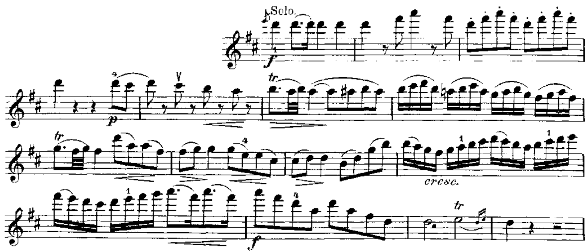
Notni primjer 5: Prva tema u violinskom solu

Mozart u solističkom dijelu ekspozicije nadodaje prijelaznu slobodnu temu, tzv. „sujet libre“ 5 kao most ka motivima druge teme.