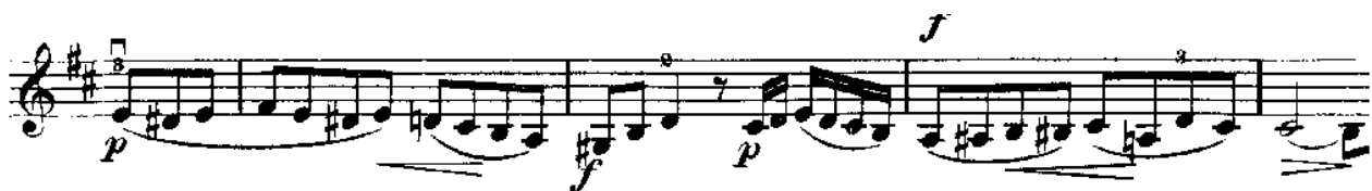
Notni primjer 6: Druga tema

Mozart u solističkom dijelu ekspozicije nadodaje prijelaznu slobodnu temu, tzv. „sujet libre“ 5 kao most ka motivima druge teme.