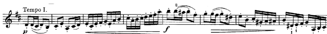
Notni primjer 11: Prva tema

S oznakom Tempo I. počinje A-dio u kojem violina iznese virtuoзnu, folklorno obojenu glavnu temu stavka i definira njegov plesni karakter.