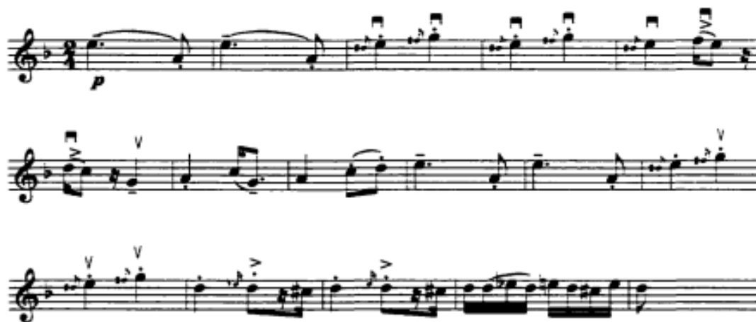
Notni primjer 20: Druga tema 76 - 90

Nakon prolazne teme i fermate započinje treći dio s novom temom, koja u nizu virtuoznih varijacija u accelerandu vodi ka završetku skladbe, gdje se kao reminiscencija javlja tema