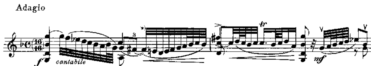
Notni primjer 1: Adagio , takt 1 – 2

I. Adagio - uvodni stavak se izvodi u skladu oznake tempa - polako, slobodno, mirno. Konstrukciju stavka čine akordi, koji su povezani pasažama improvizacijskoga ponekad i ornamentalnog karaktera.