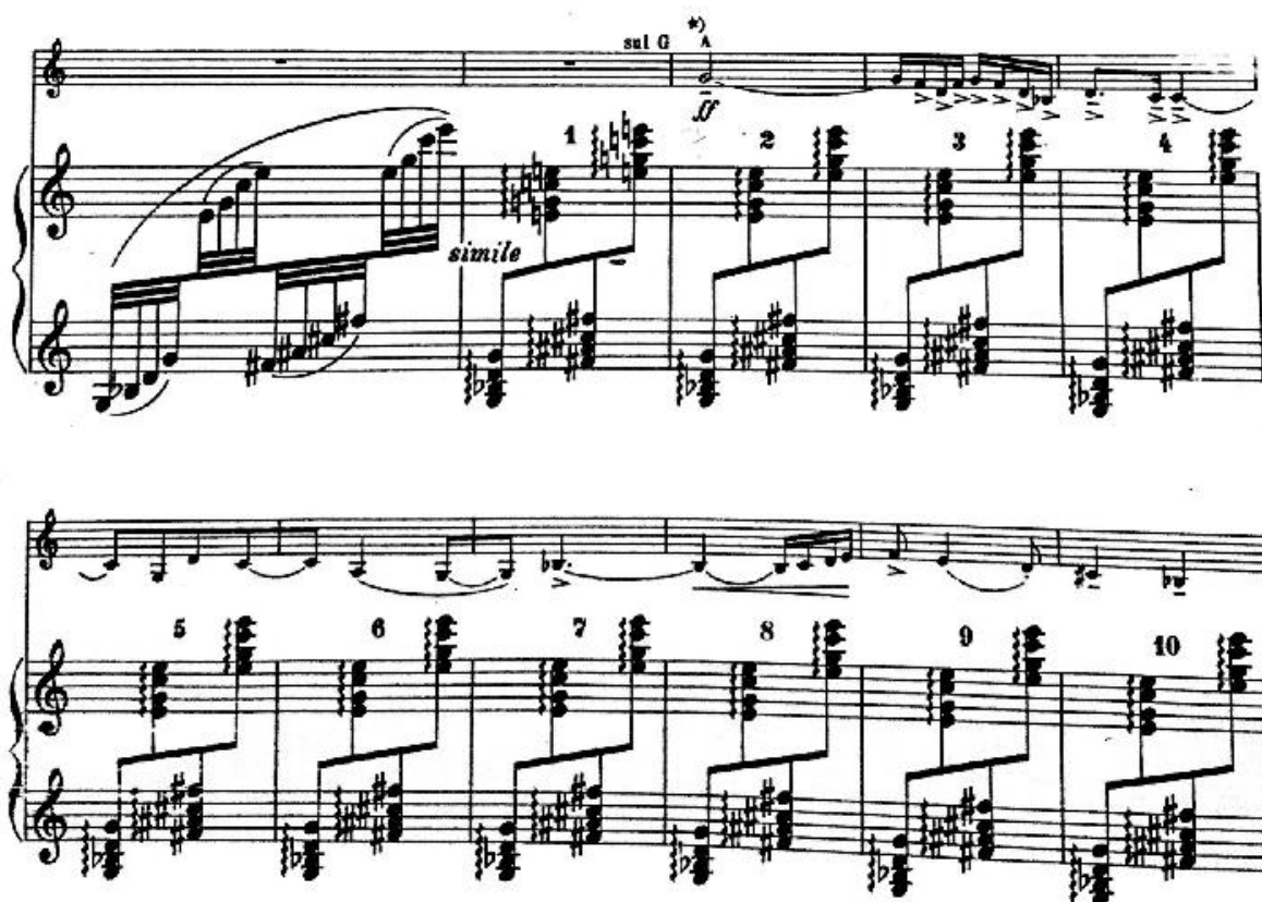
Notni primjer 22: Prva tema uz ostinatnu pratnju

Sonata je nastala 1924. godine, kad je i prvi put izvedena. Sastoji se od jednog stavka, koji se zasniva na tri dijela. Nakon kratke klavirske introdukcije u prvom dijelu „Allegro agitato energico“ nad akordskim ostinatom se pojavi prva nemirna i ritmički razgibana tema u violini, koja oscilira između dorskog modusa i balkanskog mola.