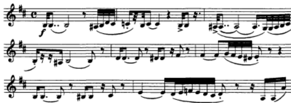
Notni primjer 19: Prva tema, takt 1-9

U uvodnoj solo kadenci slobodnog recitativnog stila nastupa prva tema, koja se kasnije višekratno ponavlja u različitim varijantama.