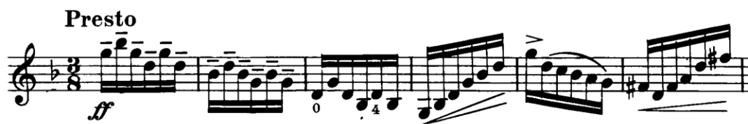
Notni primjer 4: Presto, takt 1 - 6