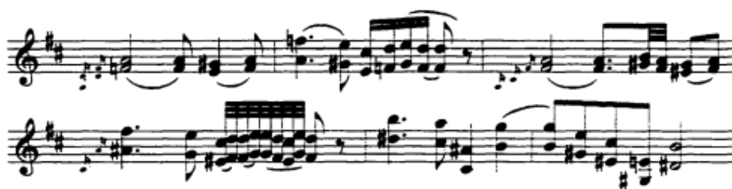
Notni primjer 18: takt 42 - 47

Paralelne terce i sekste, tipične za vokalnu glazbu, pojavljuju se uglavnom u tužnim, „lamentoso“ odlomcima.