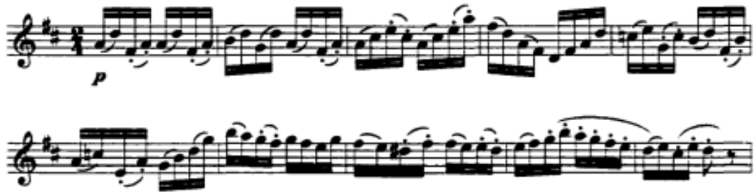
Notni primjer 21: Treća tema 227 - 236

drugog dijela, varirana u šesnaestinskom ritmu. Preko kromatične violinske pasaže pređe u zaključne pizzicato akorde.