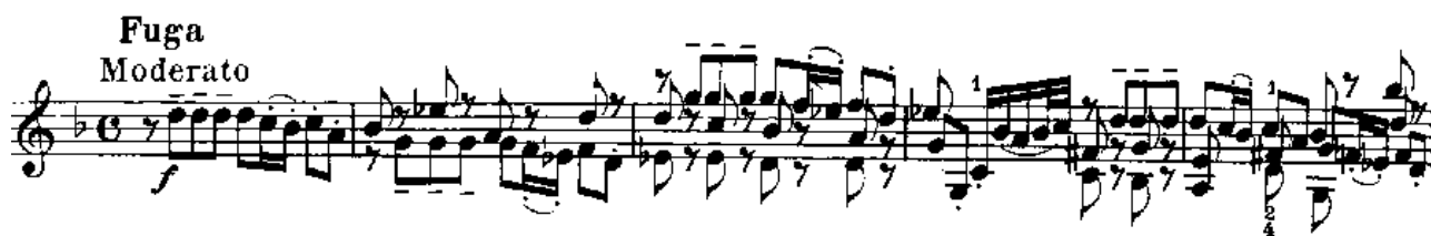
Notni primjer 2: Fuga, takt 1 – 5

III. Siciliana - naziv „siciliana“ se je u 17. i 18. stoljeću koristio za polagane instrumentalne stavke plesnog karaktera u talijanskom stilu. Napisana je u 6/8 ili u 12/8 taktu s jednotaktnim ili dvotaktnim frazama. Kao polagani stavak nalazi se u Händelovim i Corellijevim suitama. U Bachovim sonatama je jedini plesni stavak. Pastoralni karakter i ravnomjeren ritmički puls predstavljaju smirenje nakon izrazito intenzivne fuge. To je jedini stavak u duru (paralelni B-dur).