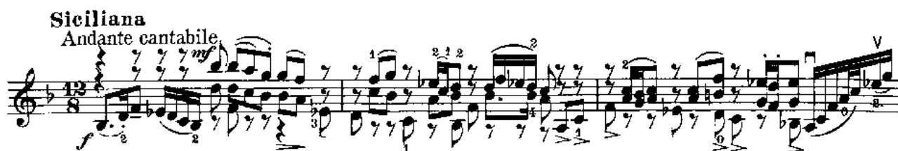
Notni primjer 3: Siciliana, takt 1 – 3

III. Siciliana - naziv „siciliana“ se je u 17. i 18. stoljeću koristio za polagane instrumentalne stavke plesnog karaktera u talijanskom stilu. Napisana je u 6/8 ili u 12/8 taktu s jednotaktnim ili dvotaktnim frazama. Kao polagani stavak nalazi se u Händelovim i Corellijevim suitama. U Bachovim sonatama je jedini plesni stavak. Pastoralni karakter i ravnomjeren ritmički puls predstavljaju smirenje nakon izrazito intenzivne fuge. To je jedini stavak u duru (paralelni B-dur).