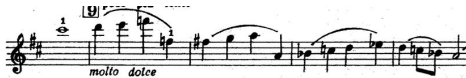
Notni primjer 15: Druga tema drugog stavka

U proslijedu se izmjenjuju motivi obiju tema kroz klavirsku i violinsku dionicu, čak i reminiscencija glavnog motiva prvog stavka. Coda je dramatična sa pikardijskim završetkom (D-dur).