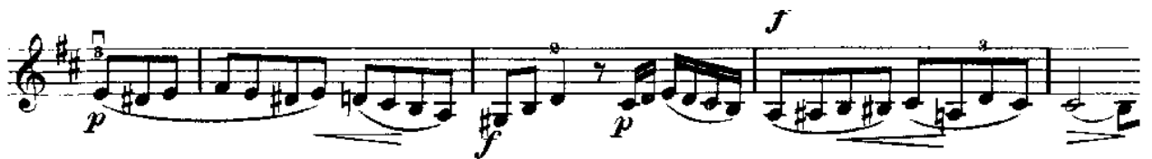
Notni primjer 6: Druga tema

Mozart u solističkom dijelu ekspozicije nadodaje prijelaznu slobodnu temu, tzv. „sujet libre“ 5 kao most ka motivima druge teme.