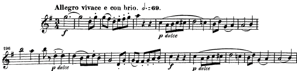
Notni primjer br. 27: Motiv prve teme, I. st. 8. simf., 5. i 197. takt, B-klarinet

Prvi stavak ove simfonije ponovno prikazuje dominantnu ulogu klarineta te pronalazimo sola, koja doduše nisu teška ni jako različita od prijašnjih, ali valja ih spomenuti. Već na samom početku u 5. taktu klarineta odgovaraju tuttiju u iznošenju prve teme kao vodeći glasovi, a isti će se motiv pojaviti još jednom u reprizi unisono s flautom (v. Notni primjer br. 27 ).