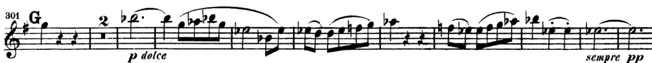
Notni primjer br. 28: Motiv prve teme u Des-duru iz kode I. st. 8. simf., B-klarinet

Beethoven doista iscrpljuje ovaj motiv do krajnjih granica. U provedbi ga često upotrebljava u dijalozima između klarineta i drugih puhača, da bi u kodi učinio nešto sasvim neobično. Naime, taj isti segment prve teme pojavljuje se u zvučćem Des-duru, a iznosi ga upravo klarinet (v. Notni primjer br. 28 ). Ovaj primjer ne samo da potvrđuje Beethovenovu težnju da eksperimentira s klasičnom sonatnom formom, nego i činjenicu da se više ne libi skladati za klarinet u udaljenim tonalitetima.