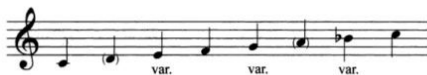
Slika 1. Unificirani prikaz blues ljestvica

U prikazu ljestvice (slika 1), stupnjevi u zagradi često se ne smatraju dijelom ljestvice, budući da je heksatonska verzija prevalentna, no nisu u potpunosti isključeni. Stupnjevi koji se snižavaju za pola tona, tzv. blue notes , označene su kao varijante (Ripani, 2009).