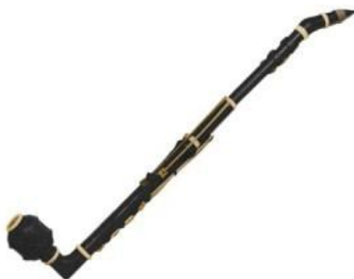
Slika 3 Stadlerov basetni klarinet in A

Anton Stadler bio je preokupiran šalmaj registrom klarineta, što je vjerojatni razlog nastanka 'produženog' klarineta, instrumenta koji je sredinom dvadesetog stoljeća prozvan 'basetni' klarinet, kako bi se naglasila njegova različitost od basetnog roga (također puno sviranog u Mozartovo vrijeme, za kojeg je i Mozart skladao djela) te bas klarineta (izumljenog tek u devetnaestom stoljeću). Basetni klarinet izumljen je na način da su standardnom klarinetu dodane dvije tipke na produženu cijev. Riječ je o tonovima koji su dublji od najdubljeg tona standardnog klarineta, pisanog e malog, a to su d mali i c mali. Taj instrument izumio je 1788. graditelj instrumenata Theodor Lotz, nakon čije će smrti 1792. zasluge za izum Stadler pripisati sebi, iako nije dokazano da je Stadler bio i izvođač i graditelj instrumenata. Prvi basetni klarinet bio je in B, dok će se u svim važnijim djelima, posebno Kvintetu i Koncertu, koristiti basetni klarinet in A. Krajem 1790. dokumentirano je da je basetni klarinet u Stadlerovom posjedu unaprijeđen kromatskim tonovima cis malim i dis malim, potencijalom koji je u Koncertu iskorišten, no ne i u Kvintetu čije je skladanje dovršeno i koji je praižveden godinu dana prije, u rujnu 1789.