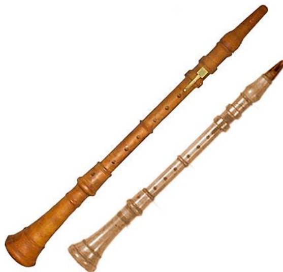
Slika 2 Dennerov klarinet

Gluck u svojim operama. Opis zvuka šalmaja nalazimo u komentaru Mozartova suvremenika, glazbenika i kritičara Christiana Friedricha Daniela Schubarta: „njegov ton je toliko zanimljiv, jedinstven i beskrajno ugodan, da bi cijeli svijet glazbe patio u bolnom gubitku da taj instrument ikad padne u zaborav“. 2