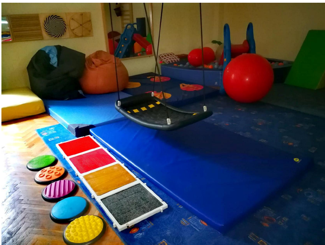
Slika 6 Soba za senzornu integraciju u Centru za autizam Zagreb 121

Poput drugih odgojno-obrazovnih sadržaja, u Centru za autizam, tako i sadržaji glazbene kulture slijede kalendarsku i crkvenu godinu, tj. određene melodije povezuju se uz određeno godišnje doba ili blagdan, čime se postiže organizirani protok vremena. Glazbene stimulacije ispunjene su raznim glazbenim sadržajima, kako bi se svakom djetetu pružila mogućnost potpunog emocionalnog doživljaja. Djeca se mogu služiti instrumentima poput udaraljki, klavijatura te nekih puhaćih i trzalačkih instrumenata. Time dijete počinje shvaćati da zajedno s terapeutom može postići neki zadovoljavajući glazbeni oblik, što mu pruža ugodu i zadovoljstvo.