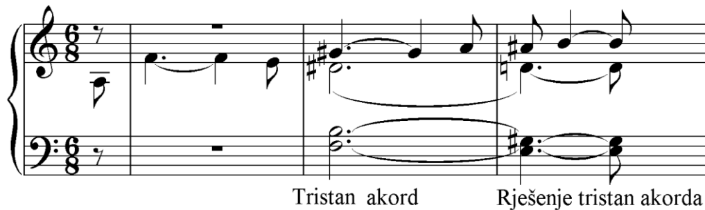
Primjer 1. Tristan akord

Ono što Tristan i Izolda predstavlja kod Wagnera, to Poslijepodne jednog fauna predstavlja kod Debussyja. To je djelo potpuno novih harmonija, prepuno boja, ugodne atmosfere, prozračnosti, ali i neuobičajenih zvukova u odnosu sve ono što je tome djelu prethodilo. Štefanac (1999) je rekao da je Poslijepodne jednog fauna anticipiralo obnavljanje orkestralnih izražajnih mogućnosti, pronalaženje novih efekata, suptilnost i profinjenost.