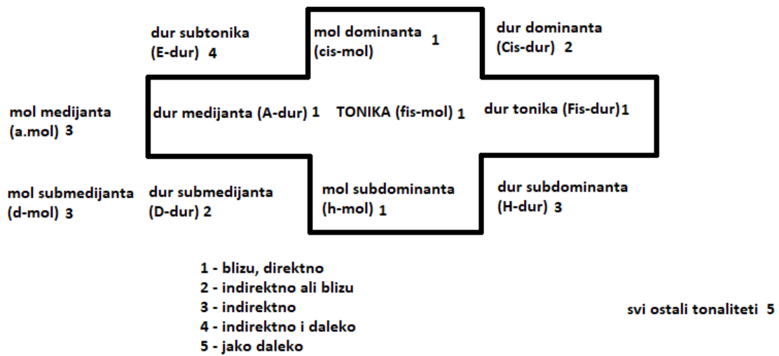
Slika 2. Prikaz ostalih tonaliteta u odnosu na tonički tonalitet prema Schönbergovoj strukturi (prema Schönberg, 1969).