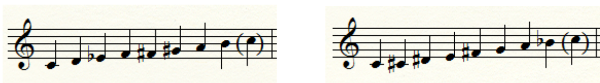
Slika 2: Mogući oblici ljestvice iz stavka Židovi (Jevreji) na tonu c

Glazbeni je materijal koji se javlja u Religiofoniji mnogostruk, a u nekim se staccima – kao što je to bio slučaj i u Chaosu – čak i podudara s tradicionalnim značenjem pojma 'teme'. Slučaj je to u stavku Židovi (Jevreji), u kojemu se jedna određena ljestvica javlja kao tonska zaliha na kojoj se stavak temelji, ali i kao značajan melodijski 'tematski' materijal, tj. kao osnovna melodijska linija. Kao i s mnogočim drugim u Štolcerovim djelima, teško je ovu ljestvicu imenovati. Prema razmješčaju polustepena i cijelih stepena, mogli bismo govoriti o simetričnoj oktatonskoj ljestvici s periodičkim rasporedom polustepena i cijelih stepena (vidi sliku 2). Ista se ljestvica još običava nazivati korsakovljevom ljestvicom (budući da ju je Nikolaj Rimski-Korsakov često upotrebljavao), a ljestvica s takvim rasporedom cijelih stepena i polustepena pojavljuje se i kao drugi modus u sustavu modusa ograničenih transpozicija Oliviera Messiaena. 232