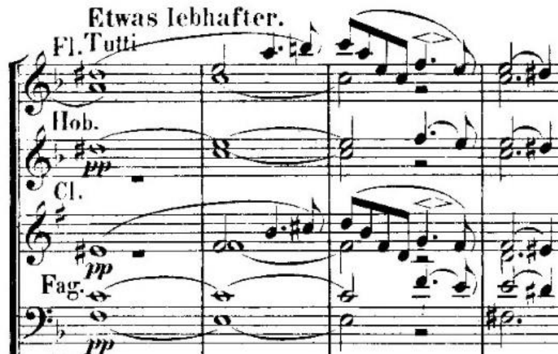
Primjer 6 - povratak teme u orkestru od takta 320.

Glavnom junaku ponovno naviru crne misli iz prvog stavka, ali ih se pokušava riješiti zazivanjem Clare, što vidimo u t. 327 (primjer 7).