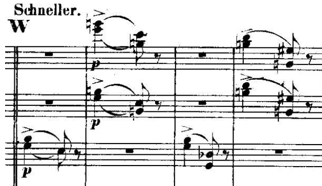
Primjer 10 - motiv Clare u orkestru u codi, od takta 722

Koncert završava codom ( Schneller ) u kojoj orkestar od svoje prijašnje funkcije komentatora i naratora stalnim zazivanjem Clarinog motiva (primjer 10) potiče Florestana da se ne osvrće natrag.