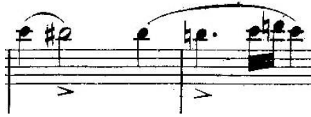
Primjer 2 - taktovi 8 i 9 u violončelu solo.

ukazuju na oštru i iznenadnu bol koja povremeno probada ali ubrzo i popušta. U cijeloj eusebijanskoj ekspoziciji prve teme primjetna je oscilacija uznemirenosti, izražaja i dinamičkog plana, koja u taktu 13, sa naznakom durskog tonaliteta, prelazi u florestanski trijumf uzlaznog rastavljenog akorda, da bi se ubrzo rasplinuo u bolnoj realnosti silazne ljestvice (primjer 3).