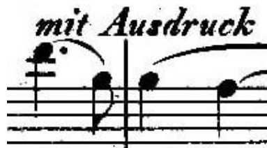
Primjer 5 - početak teme drugog stavka u solo violončelu u taktovima 286 i 287.

U t. 280 slijedi iznenadni i nježni prijelaz ( Etwas zurückhaltend ) s prvog u drugi stavak ( Langsam ), koji predstavlja svojevrsnu ljubavnu pjesmu, npr. Schumannovu upućenu Clari. On temu stavka započinje leit-motivom Clare: prve četiri dobe melodije violončela možemo vokalizirati zazivom „Liebe Clara!“ (primjer 5).