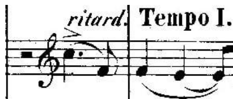
Primjer 7 - zazivanje Clare u t. 327 u violončelu solo

Glavnom junaku ponovno naviru crne misli iz prvog stavka, ali ih se pokušava riješiti zazivanjem Clare, što vidimo u t. 327 (primjer 7).