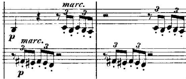
Primjer 4 - taktovi 96 i 97 u drugim violinama i violama.

Međutim, planove mu kvari orkestar koji u 96. taktu započinje razvojni dio. Triolski motiv u gudačkoj sekciji može se protumačiti kao narod, ljudi ili glasovi u (Schumannovoj) glavi koji podbadaju svojim zlim komentarima i vraćaju violončelo u realnost (primjer 4).