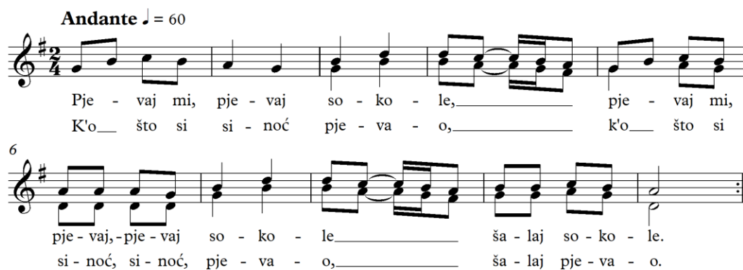
Slika 3: Notni zapis pjesme Pjevaj mi sokole (samostalan zapis prema zvučnoj snimci, 16. 06. 2019.)