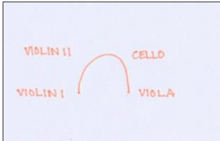
Slika 4-3: Alternativni raspored sjedenja

Za sve gore navedeno postoji razlog i poveznica. Neki violinisti kažu kako je njihova veza sa basom bolja ako violončelo sjedi pokraj prve violine, dok drugi kažu kako je ravnoteža najbolja kada je violončelo nasuprot prvoj violini.