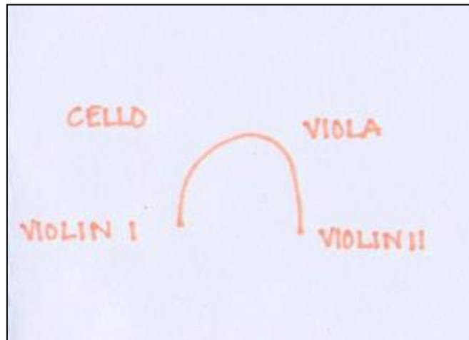
Slika 4-1: Organizacija sjedenja kroz 19.stoljeće

Nakon 19. stoljeća raspored se promijenio te su druga violina i violončelo zamijenili pozicije. U današnje vrijeme ovo je najčešći raspored instrumenata u kvartetu. Također, takav raspored je najčešći i u orkestrima.